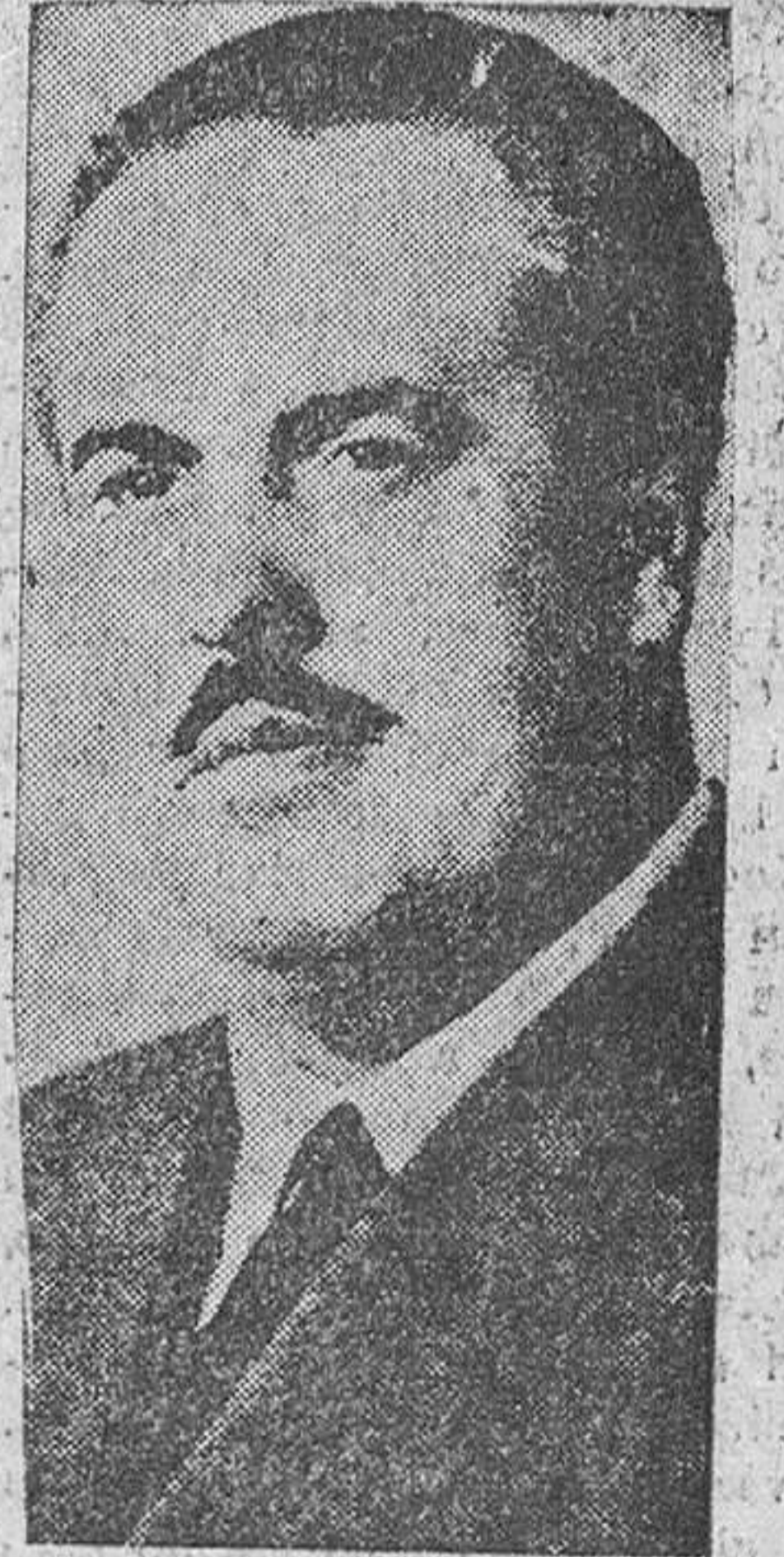
Madrid, 18.—El decimoquinto aniversario de la designación para el cargo de ministro de Trabajo a favor de don José Antonio Giron de Velasco se cumplirá el día 21 del actual.

La gestión del señor Giron al frente de tan importante departamento ministerial se caracteriza, en primer lugar, por su lealtad a Franco; por su profundo espíritu humano lleno de equidad, que tuvo su prueba en los momentos de dificultad económica por que atravesaba el país en el momento de hacerse cargo de la cartera, y por la realidad social actual, en la que hay toda una ordenación jurídico-social cuyo fin es la regulación justa de las relaciones laborales y la elevación del nivel de vida de todos los españoles.—Cifra.