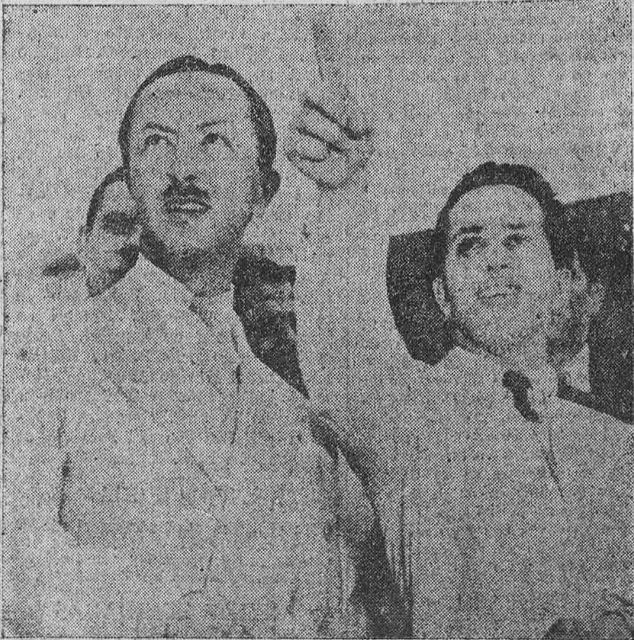
Faisal ha viajado por todo el mundo, acompañado casi siempre de su tío, el príncipe Abdul Illah, que ejerció con singular acierto la Regencia hasta la mayoría de edad del Monarca. La fotografía fue obtenida a la llegada de ambos al puerto de Nueva York, hace tres años.

Madrid, 18.—Ha llegado a Madrid el rey Faisal II, monarca del Irak. Poco antes de las cuatro de la tarde S. E. el Jefe del Estado, Generalísimo Franco, hizo su entrada en la pista de aparcamiento del aeropuerto de Barajas. El numeroso público que se había congregado en las terrazas de los edificios centrales y en sus alrededores tributó al Generalísimo una cariñosa acogida. Su Excelencia pasó revista a una compañía de tropas de Infantería de Aviación de la I Región Aérea, con bandera y Banda. Momentos después el Caudillo, al que acompañaban los jefes de sus Casas Militar y Civil y ayudantes de servicio, saludó a los miembros del Gobierno, Consejo del Reino y altos mandos militares de los tres Ejércitos.