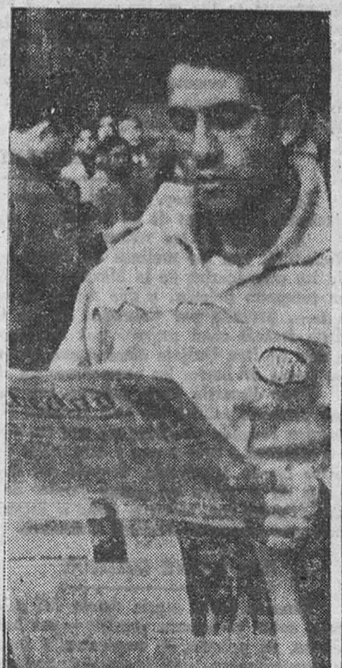
Loroño lee atentamente la clasificación de la etapa.

Albacete, 30. — (Crónica del enviado especial de "AEM"). JUAN HERNANDEZ PETIT.)