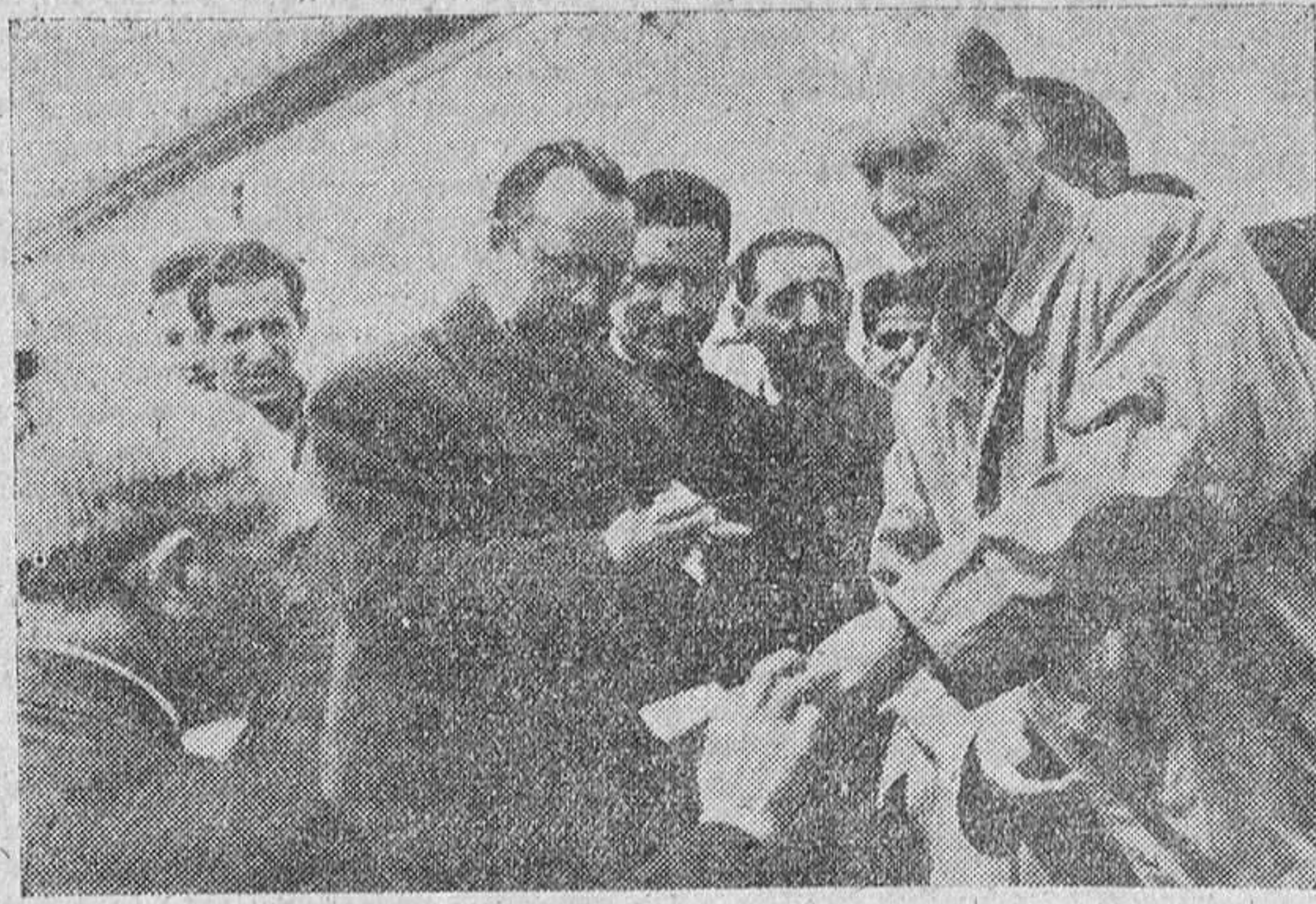
El delegado provincial entrega la llave a uno de los beneficiarios de las viviendas.