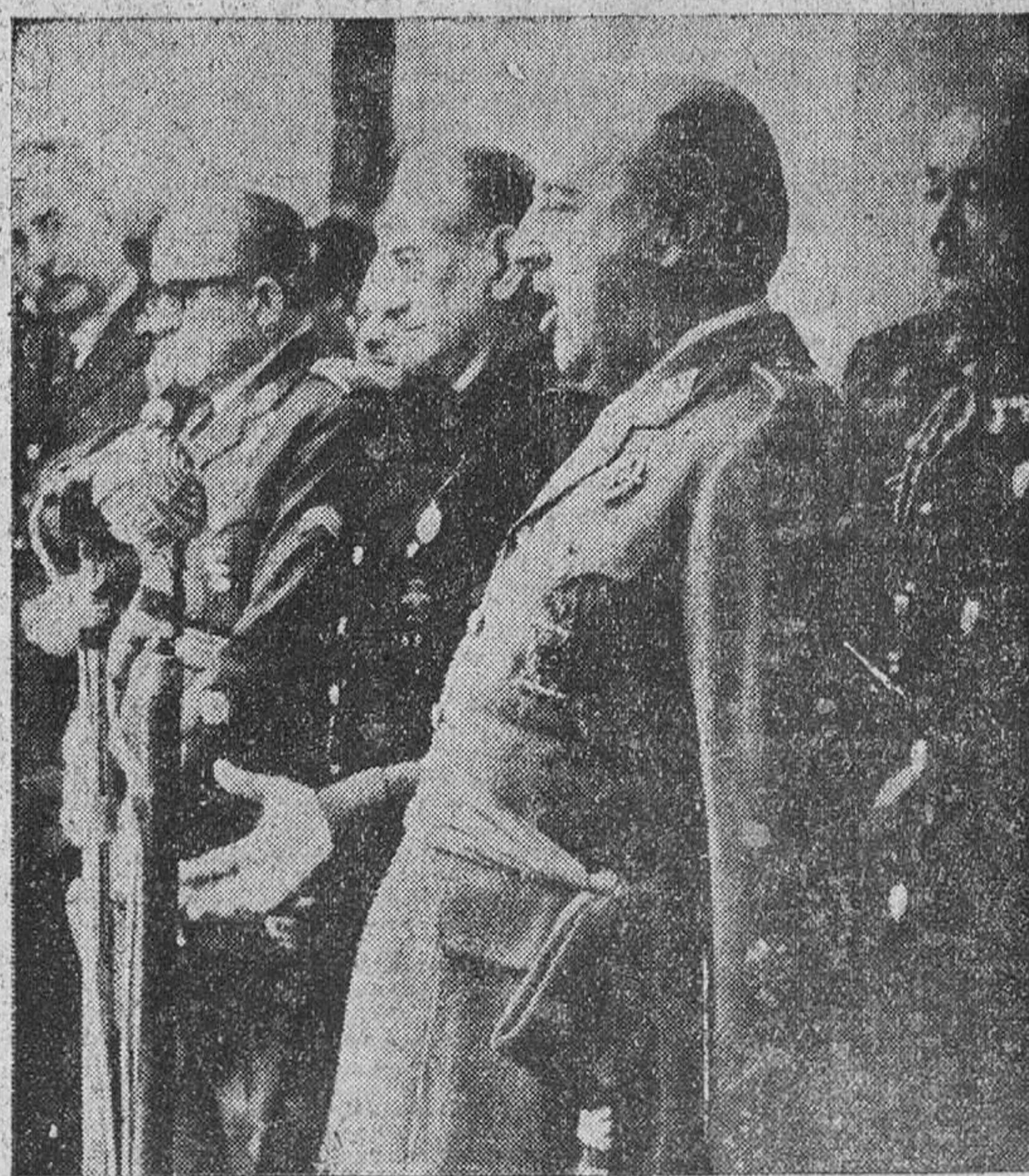
Sevilla.—Su Excelencia el Jefe del Estado durante su trascendental discurso, desde el balcón del patio de Carlos V, del Alcázar, a la Vieja Guardia sevillana.

A continuación Su Excelencia el jefe del Estado se trasladó a la Casa-Cuna, que también inauguró. Recorrió las diversas instalaciones modelo en su género. Se trata de un magnífico Centro, emplazado en un pintoresco sitio de una finca del arroyo de los Angeles. Bendijo los locales el obispo