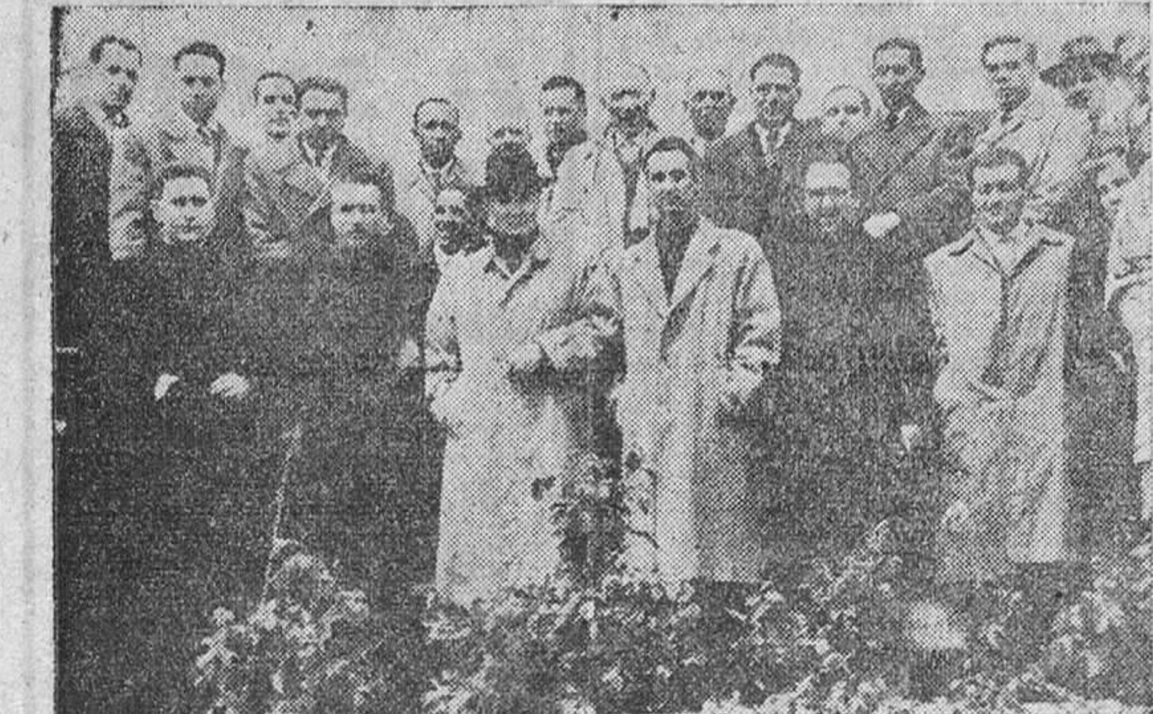
El gobernador civil, el delegado de Sindicatos y las autoridades y jerarquías toresanas, con los miembros de la Cooperativa de Nuestra Señora del Carmen.