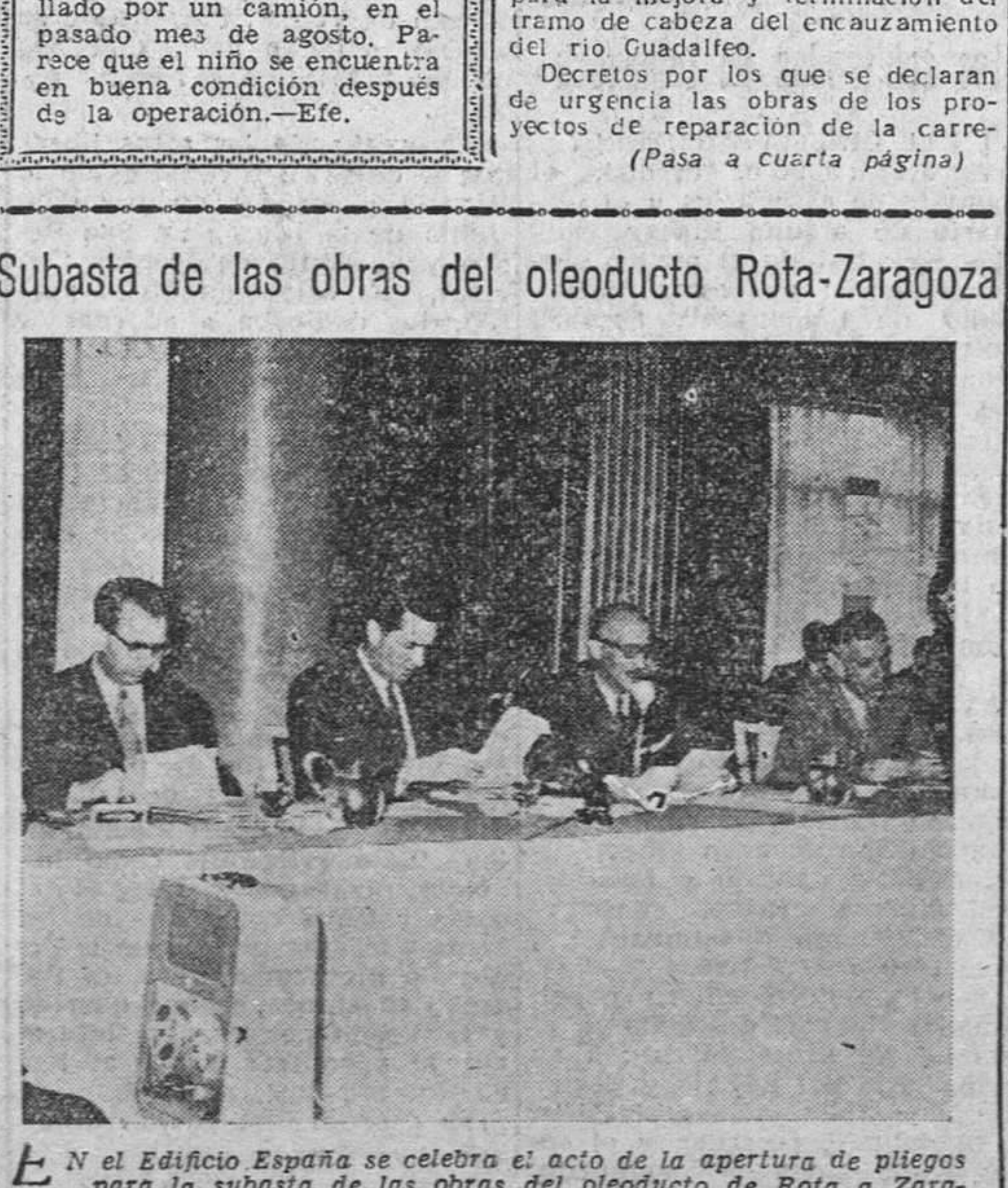
En el Edificio España se celebra el acto de la apertura de pliegos para la subasta de las obras del oleoducto de Rota a Zaragoza. La presidencia del acto, por personalidad, españolas y americanas.