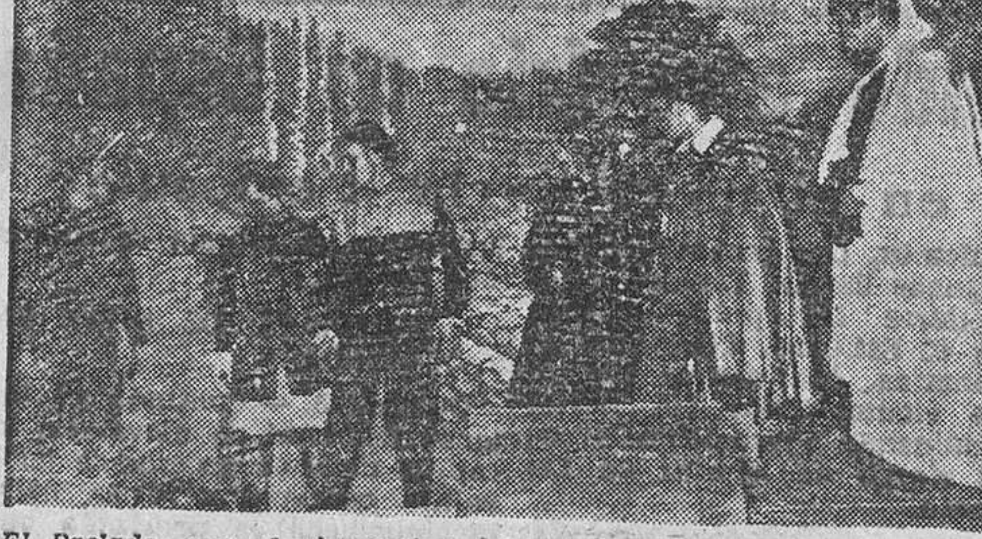
El Prelado, con el vicerrector del Seminario, presencia la velada literario-musical.— Abajo, una escena de «El colmenero divino».

El día 7, en el salón de actos del Seminario, los seminaristas ordenaron al Ángel de las Escuelas una velada literario-musical.