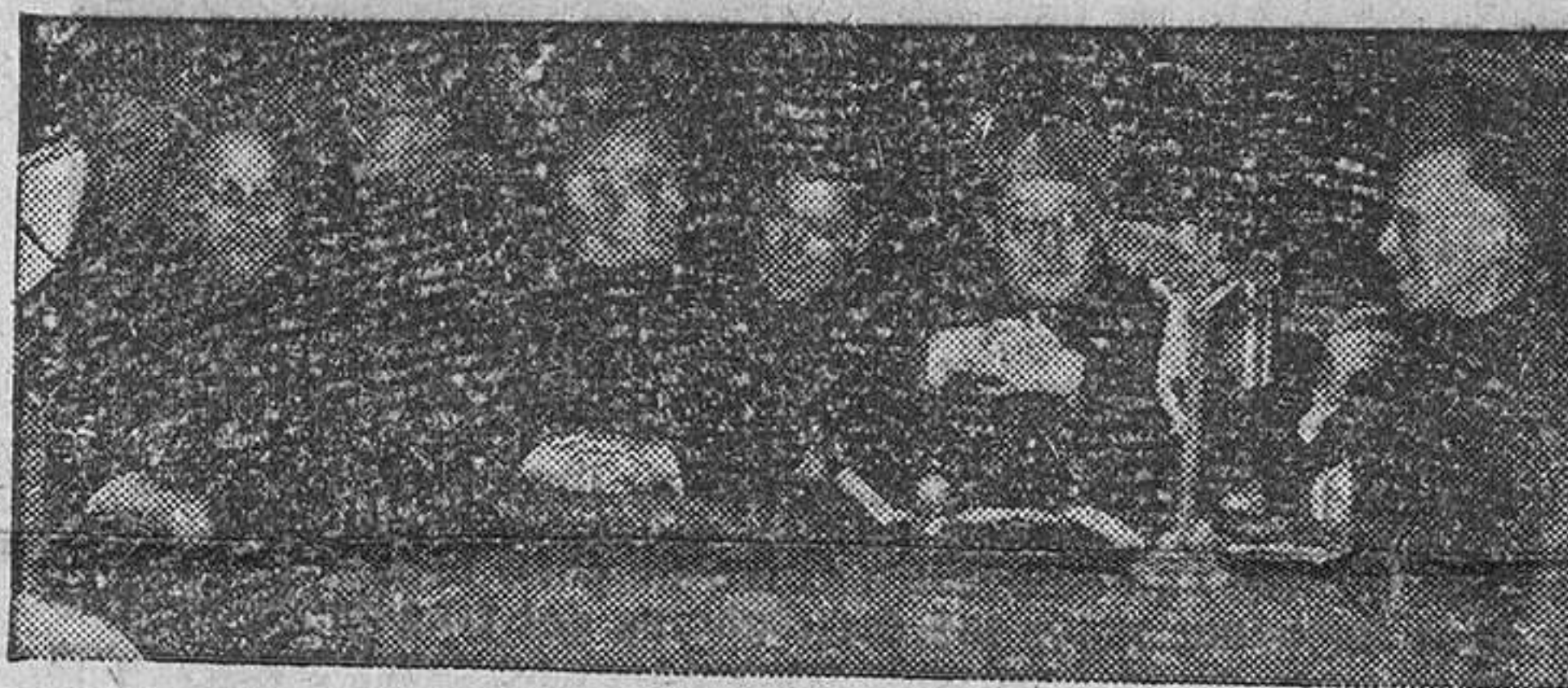
El Prelado, con el vicerrector del Seminario, presencia la velada literario-musical.— Abajo, una escena de «El colmenero divino».

Velada literario-musical en honor de Santo Tomás de Aquino