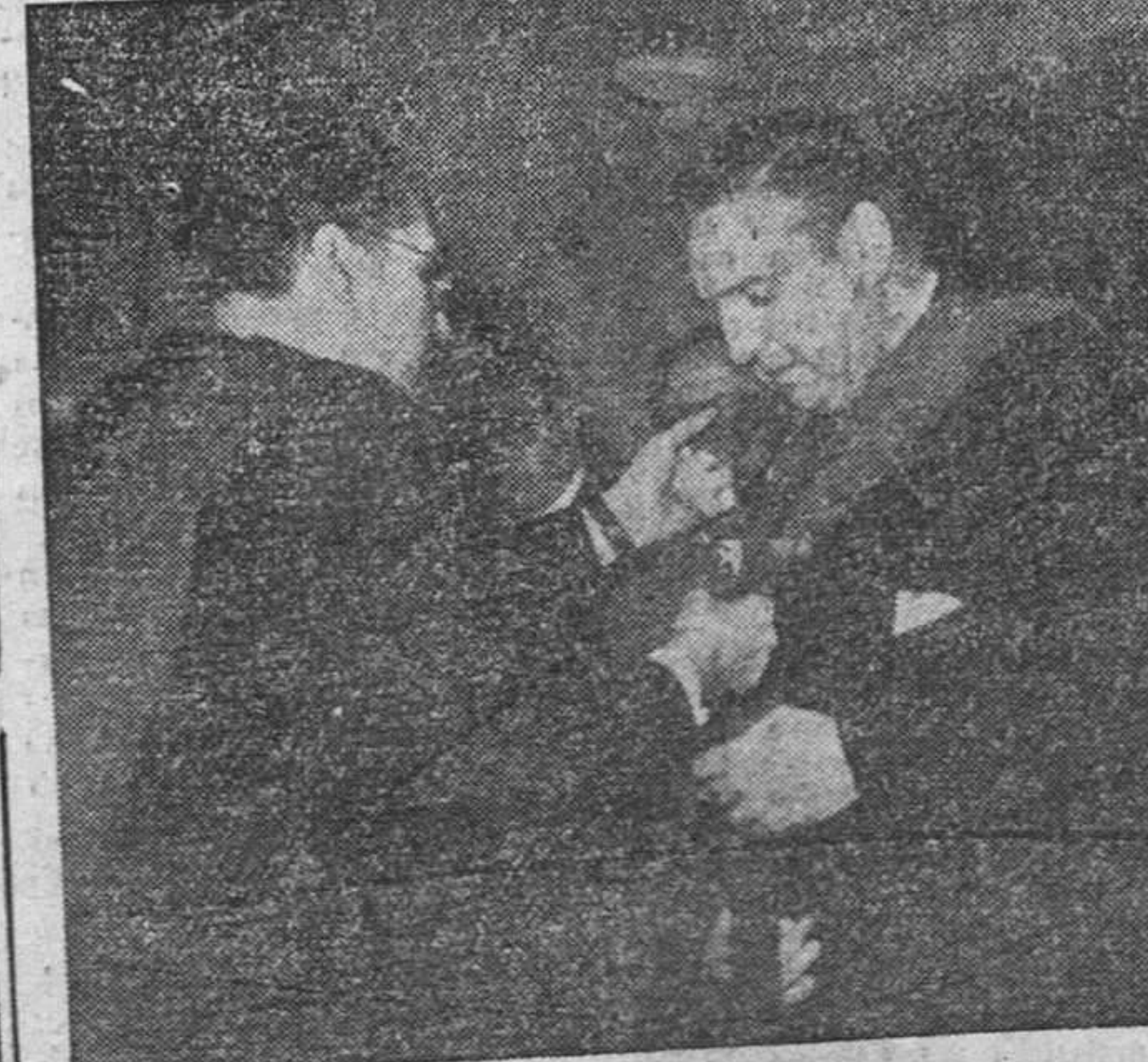
MADRID.—Con motivo de la fiesta de Santo Tomás de Aquino, Patrono de los estudiantes, se celebró una solemne fiesta en el Colegio Mayor “San Pablo”, en la que les fueron impuestas las becas de honor a los ministros de Asuntos Exteriores, señor Martín Artajo, y de Educación Nacional, señor Ruiz-Giménez.