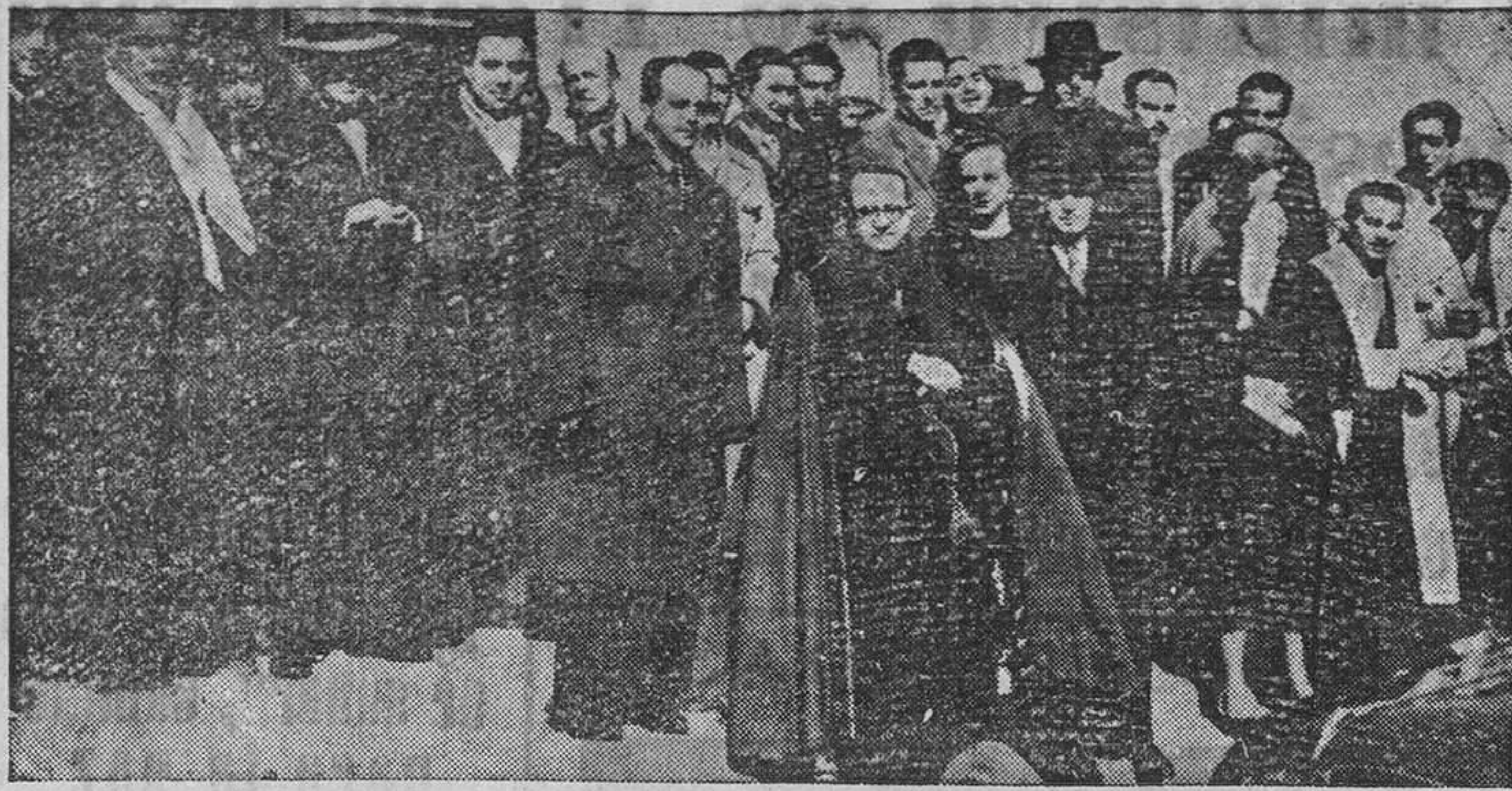
El Prelado y el Gobernador Civil rodeados de practicantes a la salida del templo.

Función religiosa.-Comida de hermandad.-Acto literario-musical.