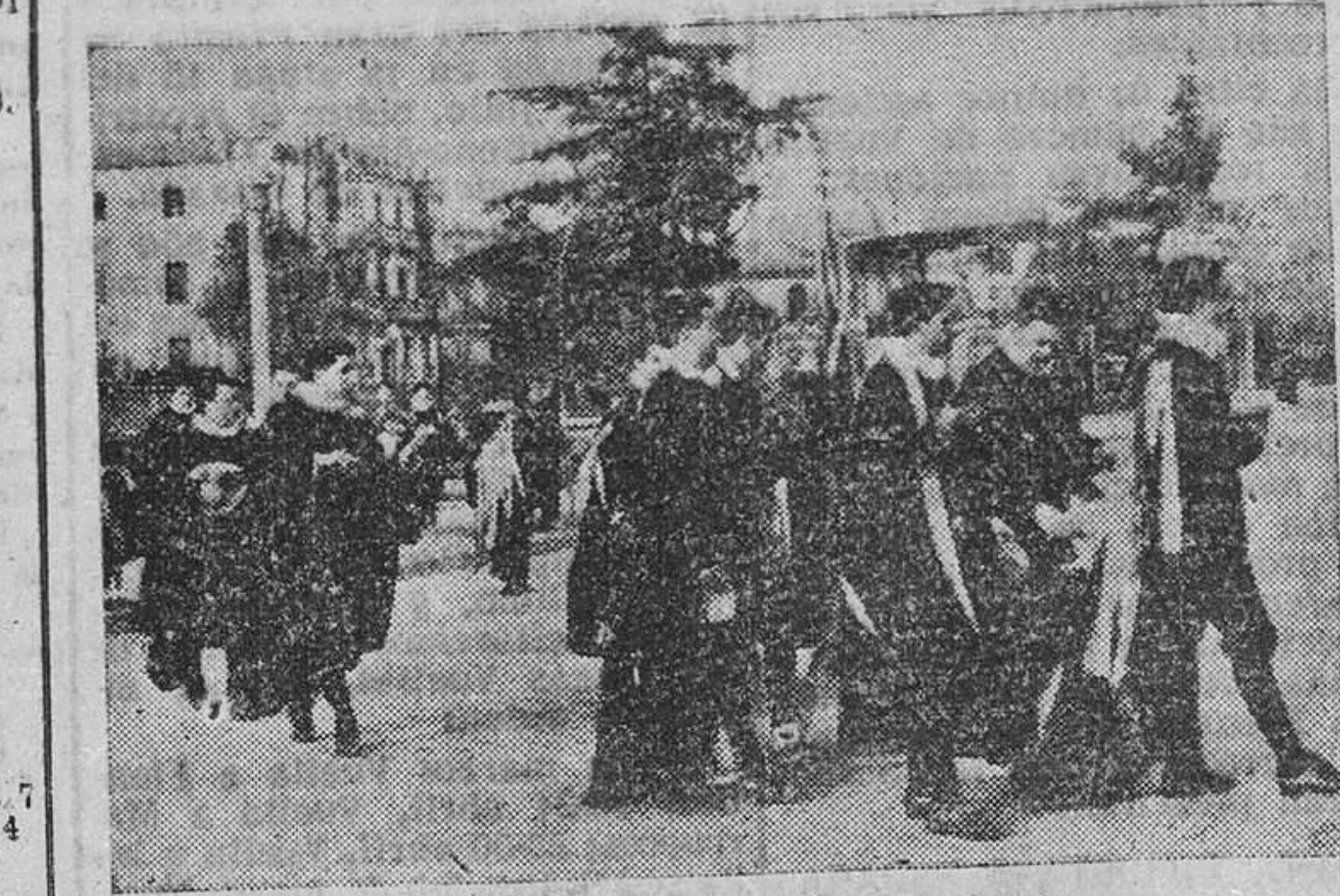
LA TUNA PASAJERA.

Diamantina está muy contenta atendiendo a sus ahijados. ¿Le dan mucho trabajo? Ninguno. Es una lástima... ¿Una lástima, qué? Que sea tan breve su paso por Zamora, porque apenas si tenemos tiempo de organizar las cosas como ellos se merecen. Menos mal que mis amigas, las damas de honor, me han facilitado extraordinariamente la tarea.