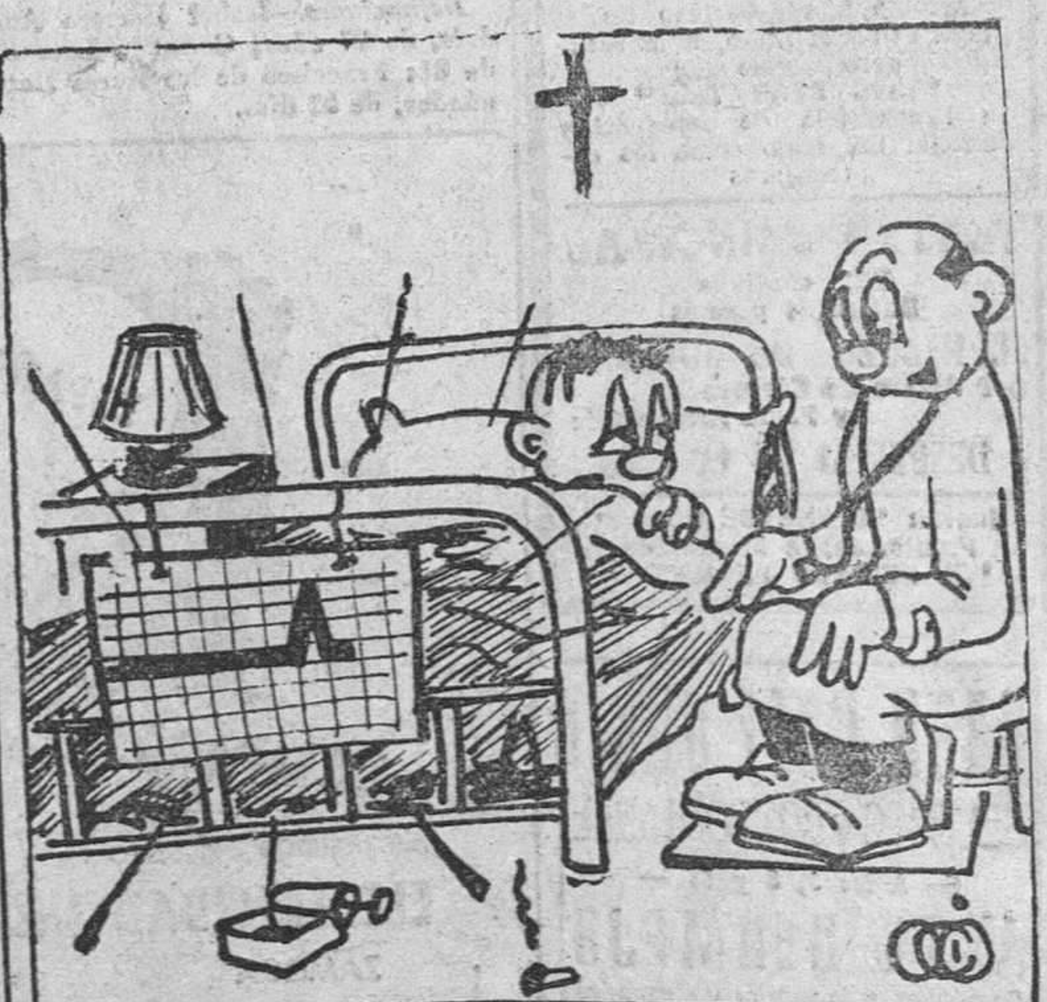
—Ayer le pasaron a usted la cuenta de la Clínica, ¿verdad? (Pasa a la cuarta página)