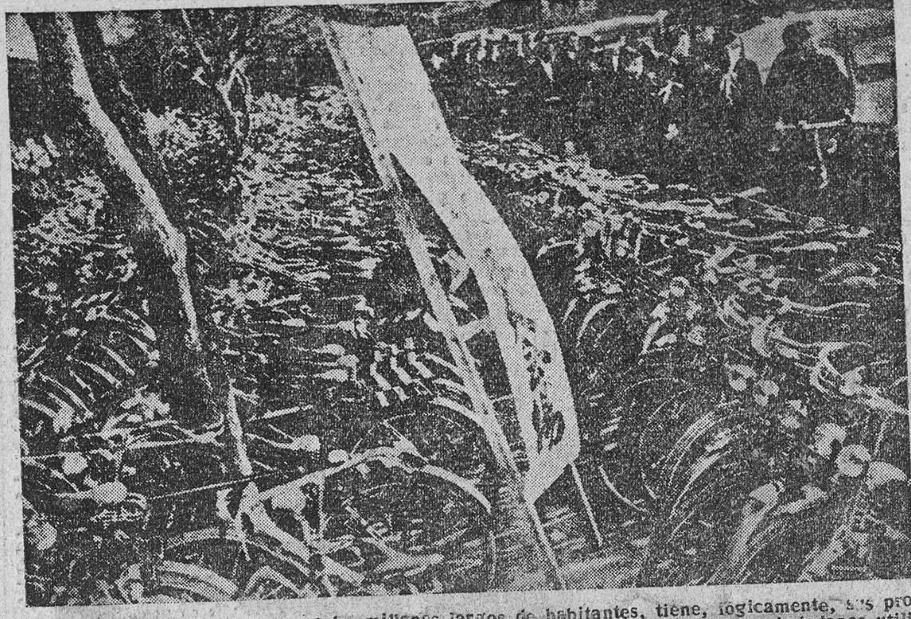
La capital del Japón, con sus ocho millones de habitantes, tiene, lógicamente, una gran necesidad de transporte colectivo. El “caballo de acero”, como un poco hipocóricamente se llamó a la bicicleta en otra época más ingenua, suple las deficiencias del transporte urbano y las inconveniencias de las distancias. Vemos en la foto unos centenares de estos económicos “caballos de acero” pastando en la vía pública mientras sus dueños trabajan.