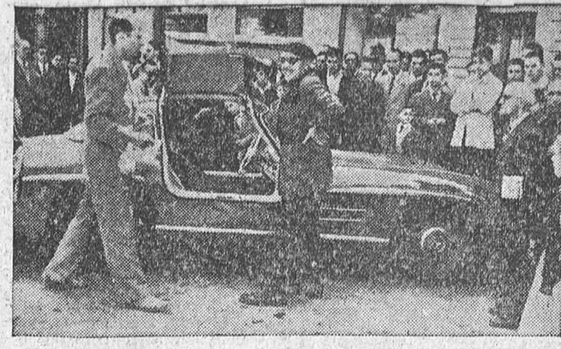
Uno de los cuarenta y nueve coches —el magnífico "Mercedes", con puertas automáticas— que ayer pasaron por Burgos...

Llegó el Madrid Los jugadores, ovacionados al aterrizar en Barajas