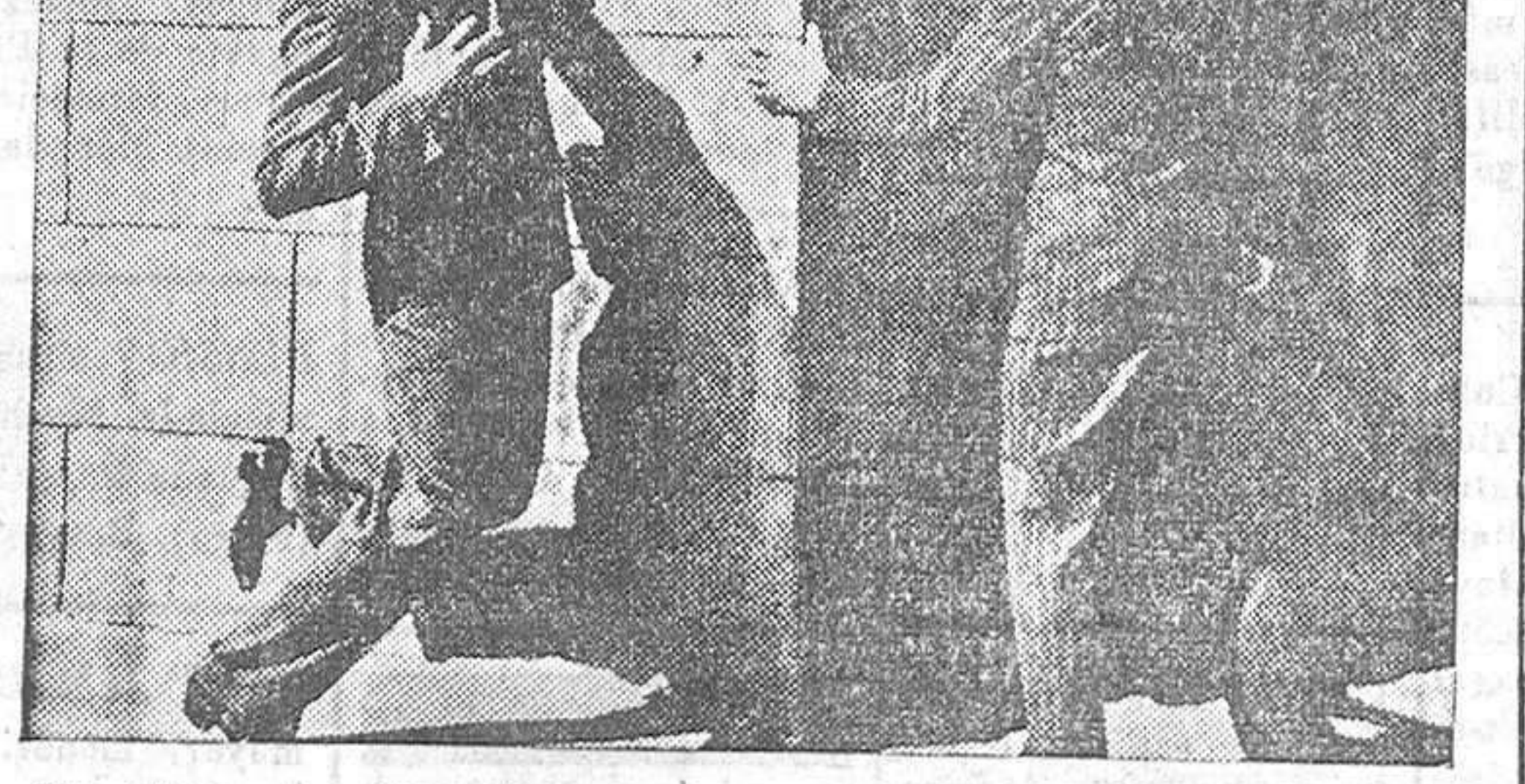
Un plano de «El enemigo público», film que consagró a James Cagney en Hollywood

“El enemigo público” le abrió las puertas de la fama