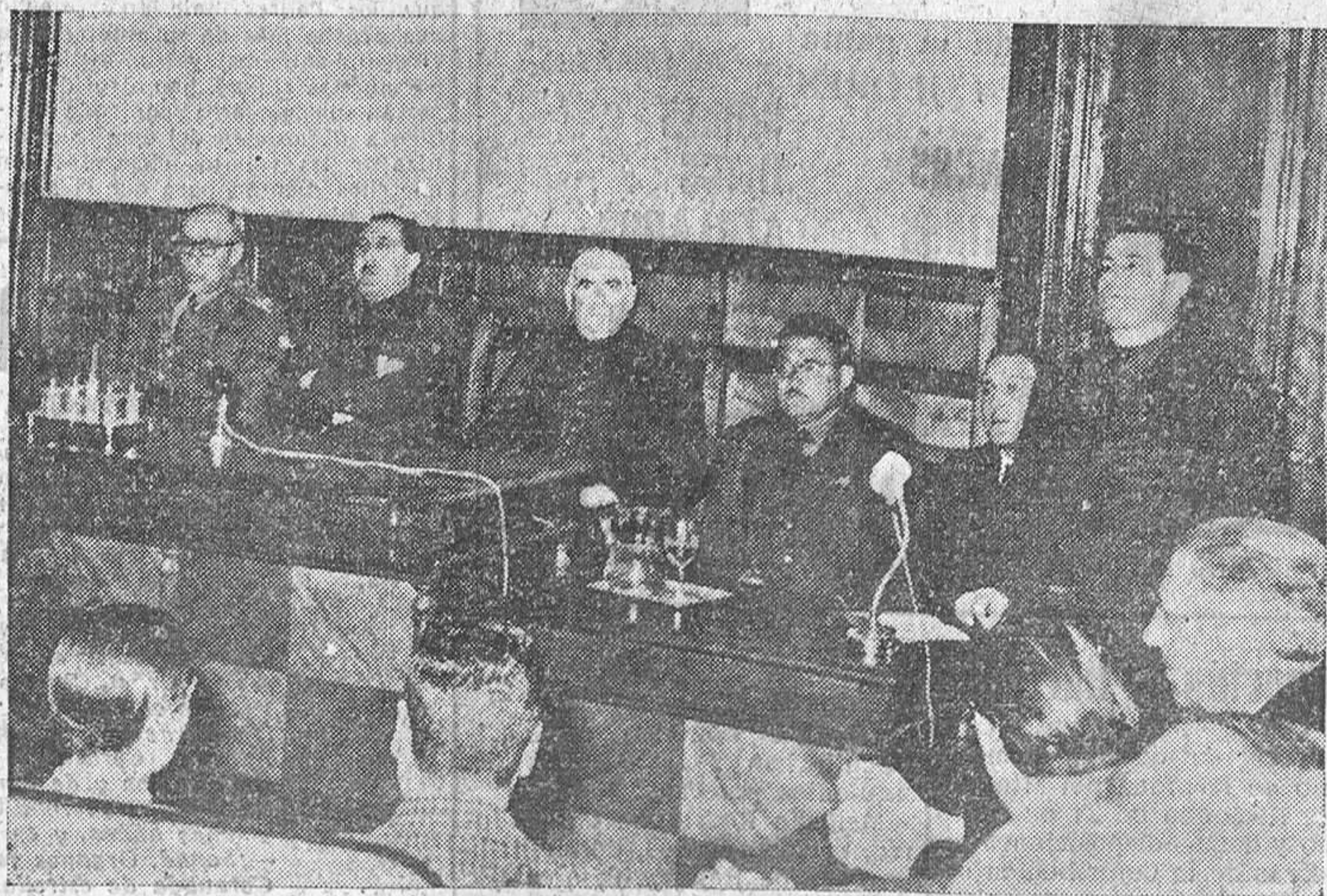
El delegado provincial de Sindicatos de Burgos durante su intervención en el Congreso