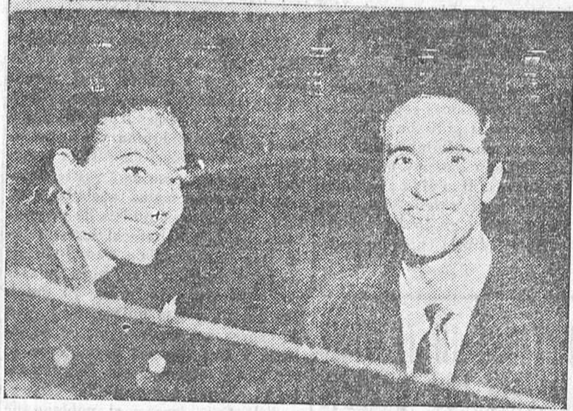
Ava Gardner con Luis Miguel Dominguin