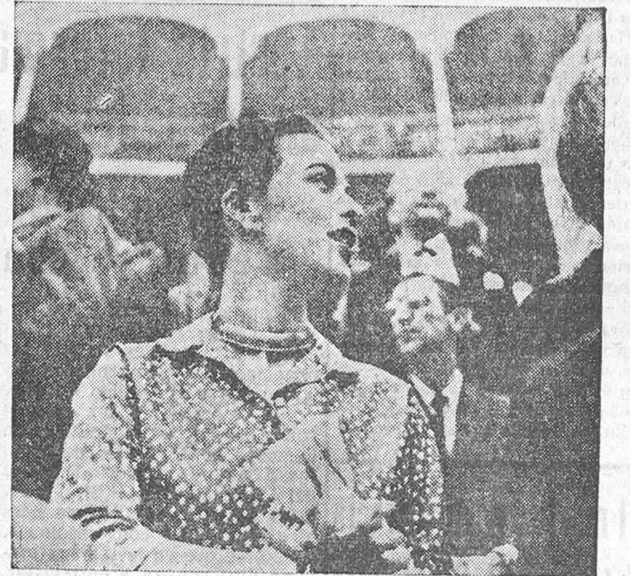
Claire Bloom asiste a una corrida de toros en la plaza madrileña de Las Ventas

Compañera de Charlot en “Candilejas”, rodará en España “Alejandro Magno”