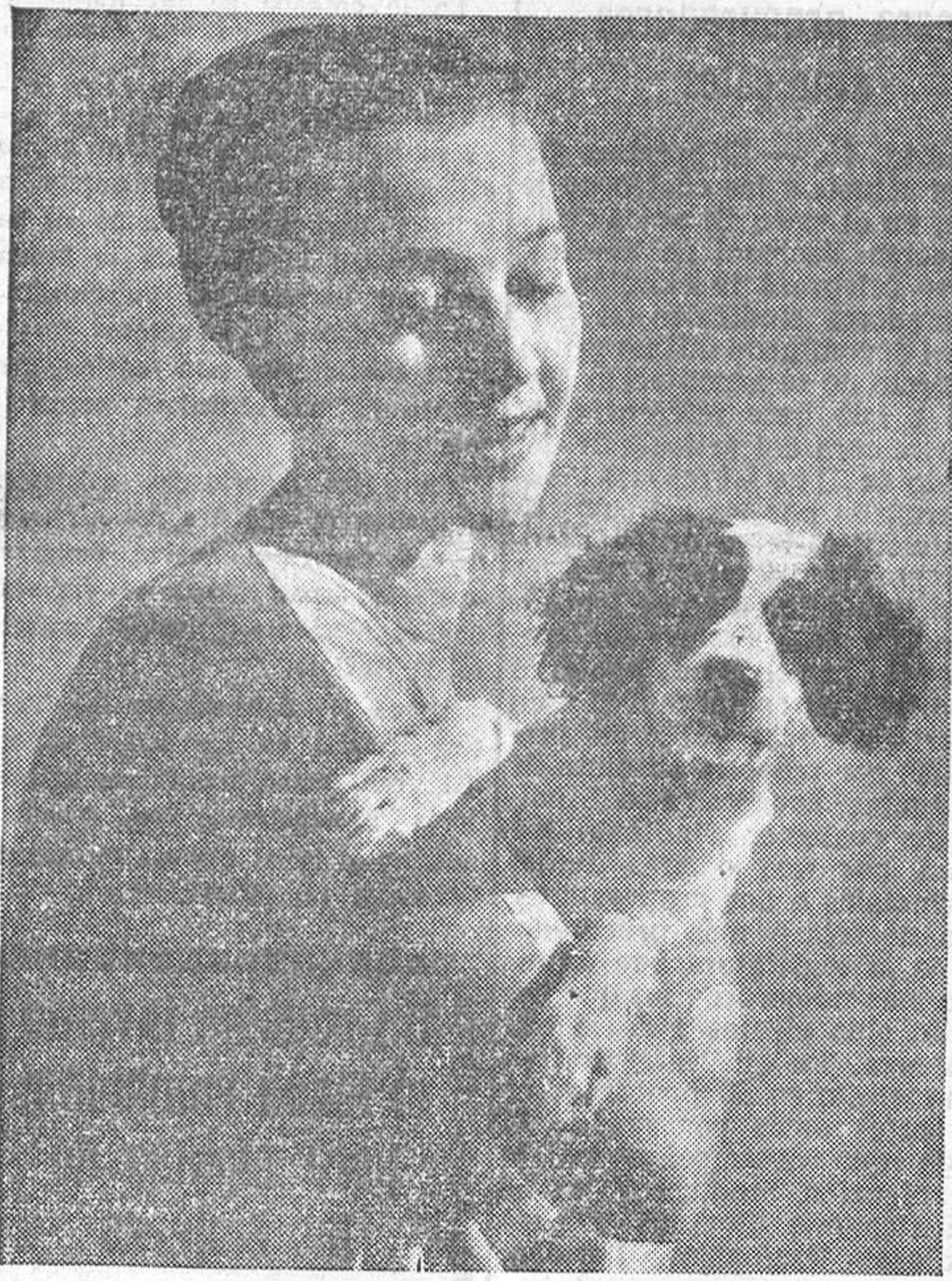
De Hollywood nos llega esta fotografía que ofrecemos a nuestros lectores y en la que Taina Elg, bailarina de la Metro y una de las últimas adquisiciones de esta productora, parece querer demostrar la fotogenia de su perro tanto o más que la suya propia.