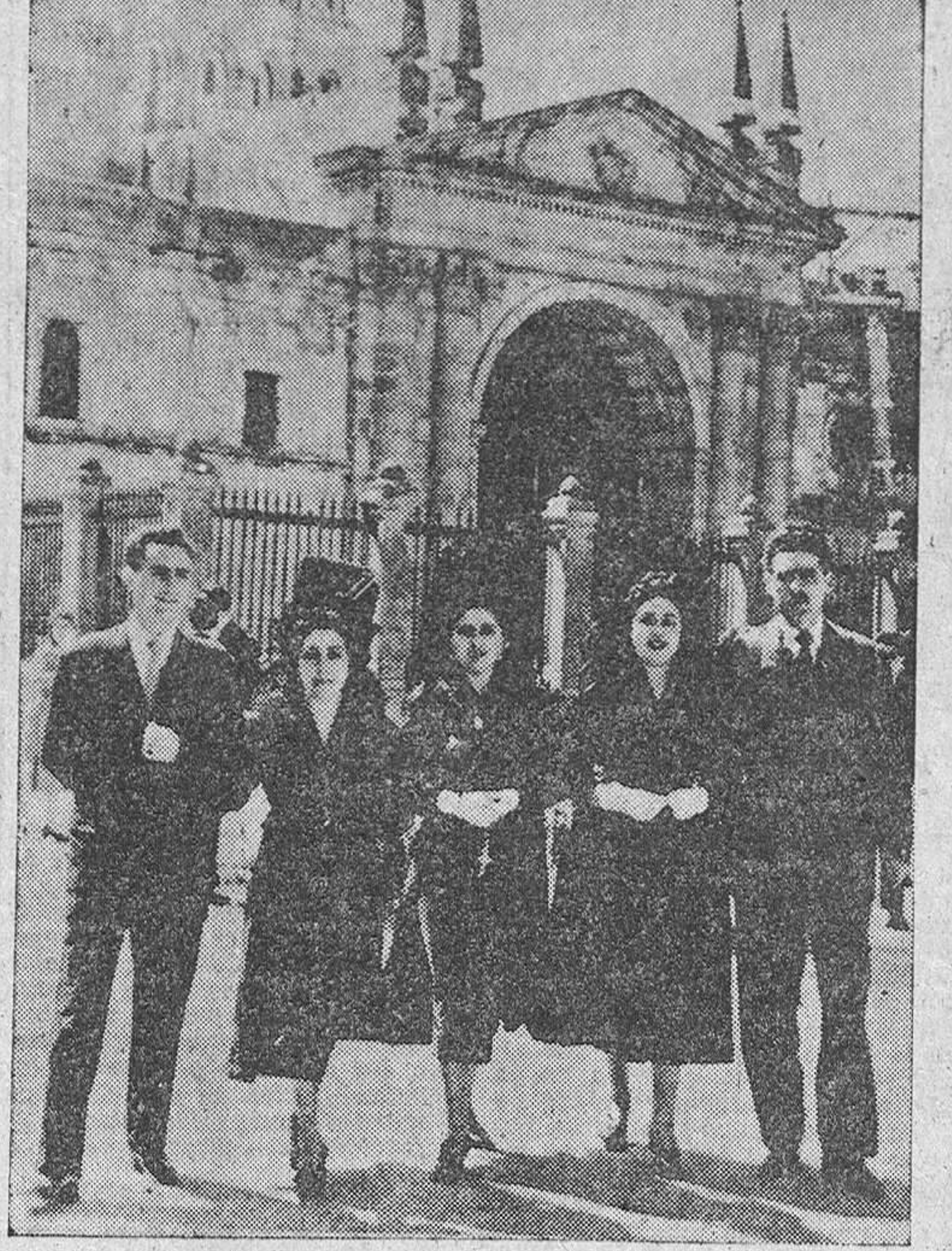
Recorriendo las estaciones.

Las bandas de música del Regimiento y del Colegio de Nuestra Señora del Tránsito, así como la de cornetas y tambores del Regimiento y de la Cruz Roja interpretaron bellas marchas fúnebres durante las procesiones.