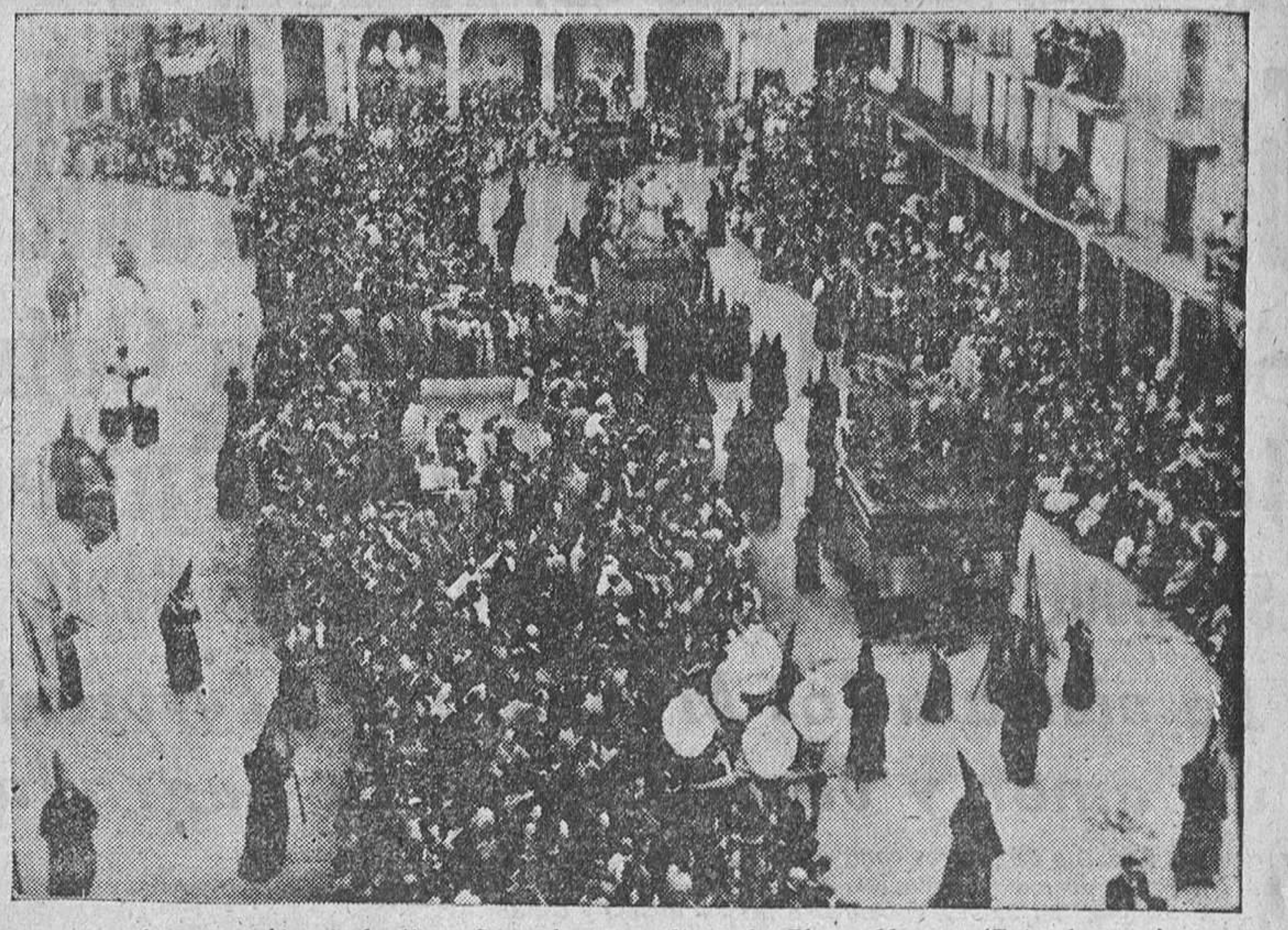
La procesión de la Vera Cruz da la vuelta a la Plaza Mayor.

Todavía no se ha apagado en nuestros ojos el reverberar de luces y flores de los Monumentos. Aun resuenan en nuestros oídos los tristes salmos del Miserere, que desde la noche serena, las estrellas se asoman a las calles silenciosas, arrulladas por el susurro del Padre Duero, que en esta hora se hace lamento sordo. De pronto, un lejano alarido de corneta, seguido del bronco tan tan de un tambor destemplado, rasga los aires llamando a los nazarenos. Las ruas, antes solitarias, comienzan a poblarse de figuras envueltas en tosco sayal, que caminan presurosos hacia la iglesia de San Juan. Son poco más de las cuatro de la mañana y el templo se halla abarrotado. Un orador sagrado, desde el pulpito, narra con acentos desgarrados la Agonía de Nuestro Señor en la Cruz, el tremendo sufrimiento de Jesús, más que por el dolor físico de las arietes, de los castigos, de la crucifixión y muerte, por el dolor que le producen nuestros pecados necesitados de tan sublime redención. Las palabras del sacerdote conmueven a los hombres y arrancan lágrimas a las mujeres, algunas con manteos y pañuelo en la cabeza, como recuerdo de una época, no muy lejana, en que los soporales de la Plaza servían de morada a muchas gentes llegadas de la tierra del pan y de la tierra del vino.