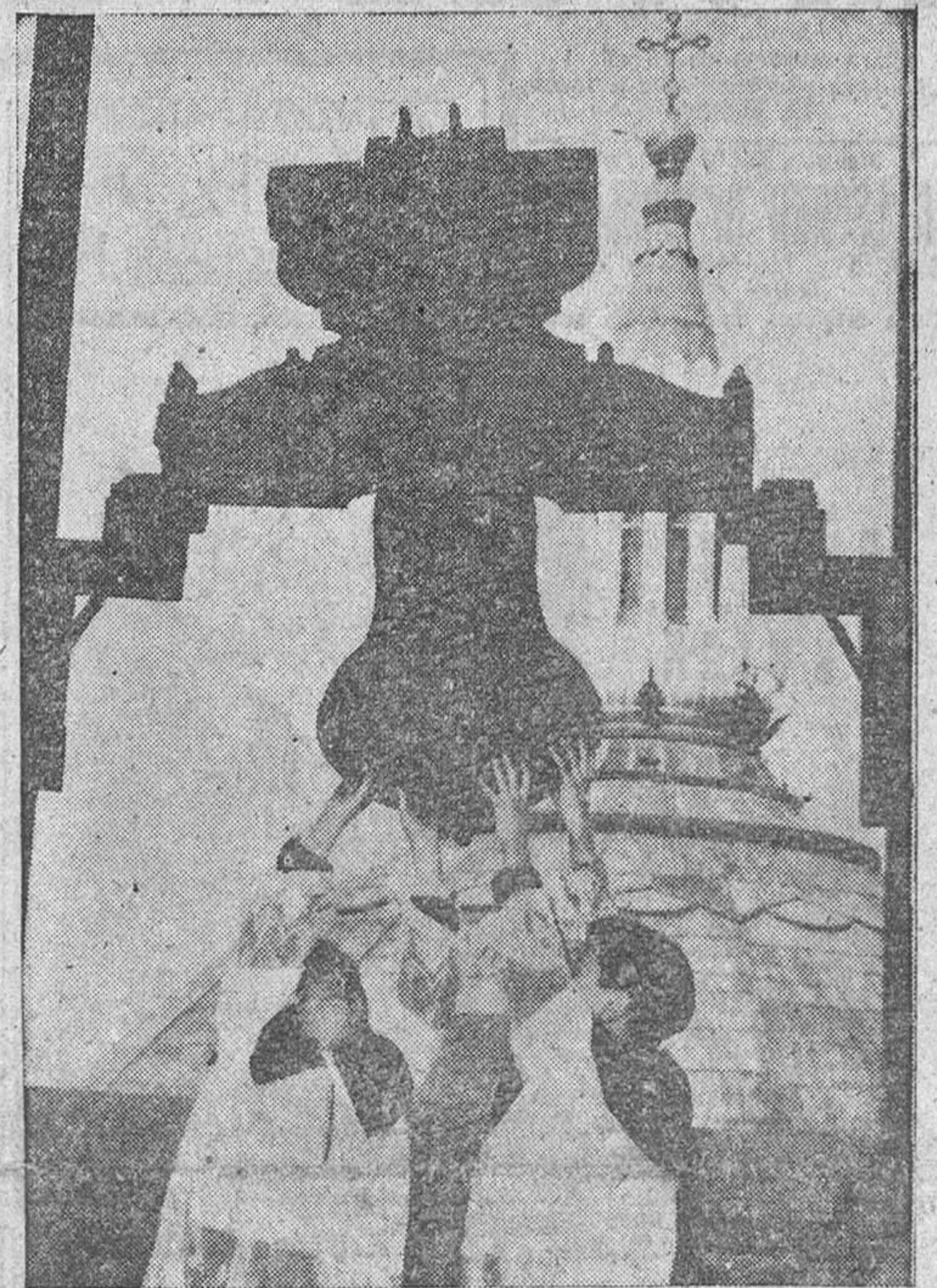
HOY, en la alegre mañana de este sábado, las campanas de toda la Cristiandad repicarán a Gloria. Han quedado atrás los días enlutados de la Pasión y ya está aquí, con la primaveza, que llega impetuosa, el fabuloso gozo de la Resurrección de Cristo.