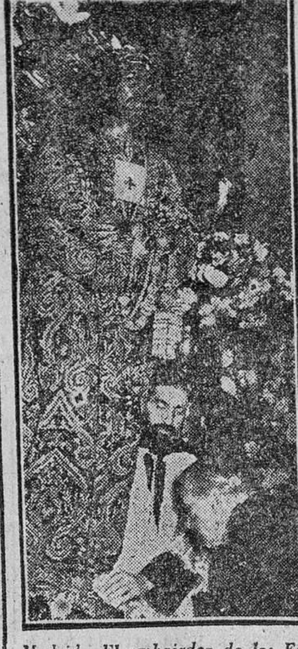
Madrid.—El embajador de los Estados Unidos, Mr. Dunn, besa los pies del Cristo de Medinaceli.

Estaba claro en la unificación de Falange y de las J. O. N. S. que no se pretendía llegar a un compromiso con el Estado o con el Poder público, ni tampoco a ser simple vínculo o vehículo de la incorporación a un régimen de la mayoría española. La ambición, era y es, más alta y encarecida: convertirse en la sustancia misma del Estado, del Régimen, del Poder público. Tal petición colectiva debe nutrirse por la continuidad social, religiosa, económica, institucional o, si se quiere decir de otra manera, constitucional.