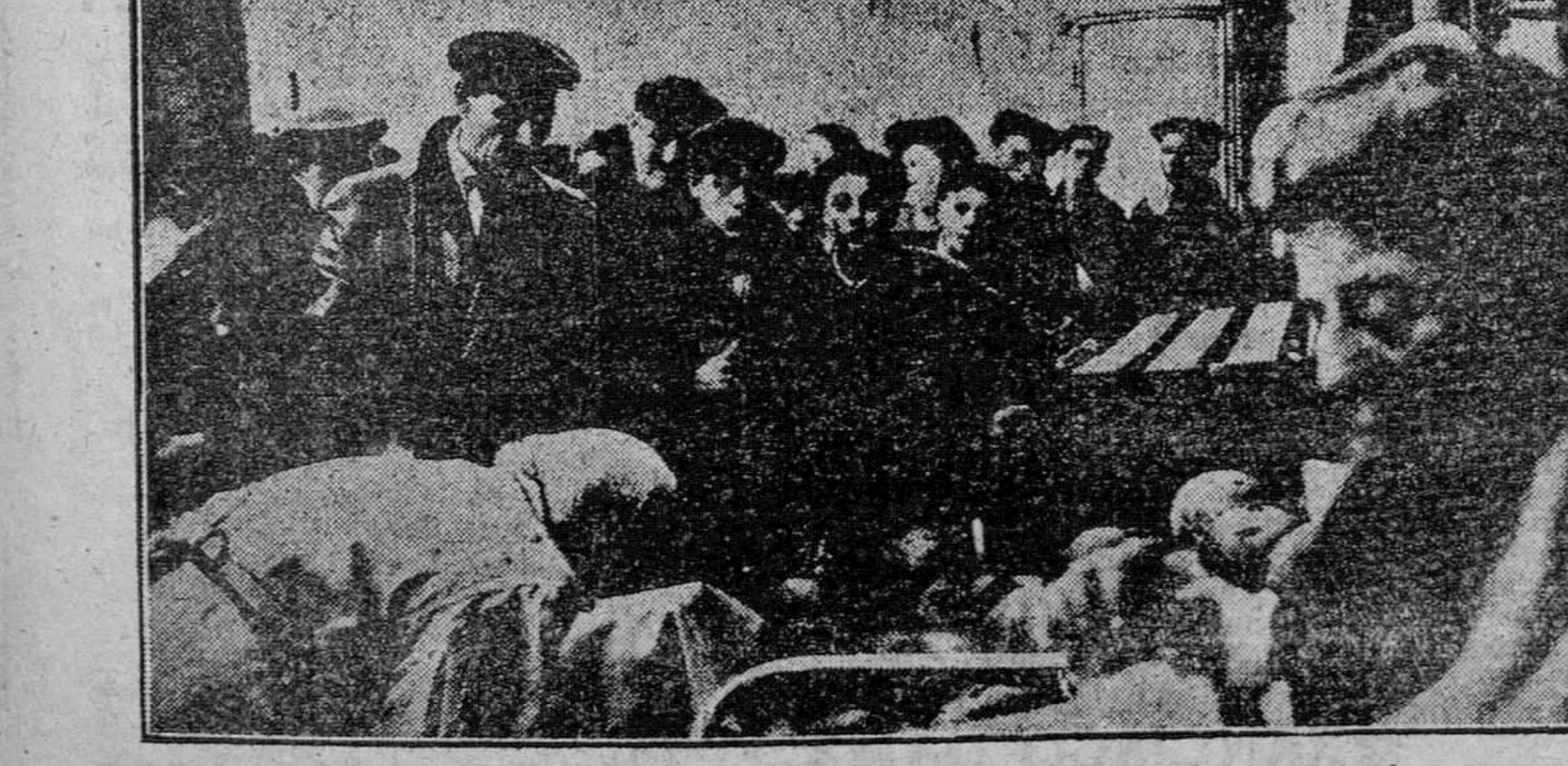
Ante un puesto de vegetales y frutas, moscovitas de todas las edades forman cola para comprar melones, fruta que escasea en Moscú, como tantas otras cosas. El fotógrafo que obtuvo esta prueba gráfica informa que en la capital soviética hoy se hacen colas para comprar el trigo y que las mismas, de tres personas en fondo, tienen a menudo enorme longitud. Aunque la fotografía no sea alegre ni sugestiva, no deja de ser excepcional, por ese maltrato a la visión de aceros que no deja caer a reducir lo que detrás de él ocurre.

La apuesta fué... Por comerse 24 tortillas de 24 huevos