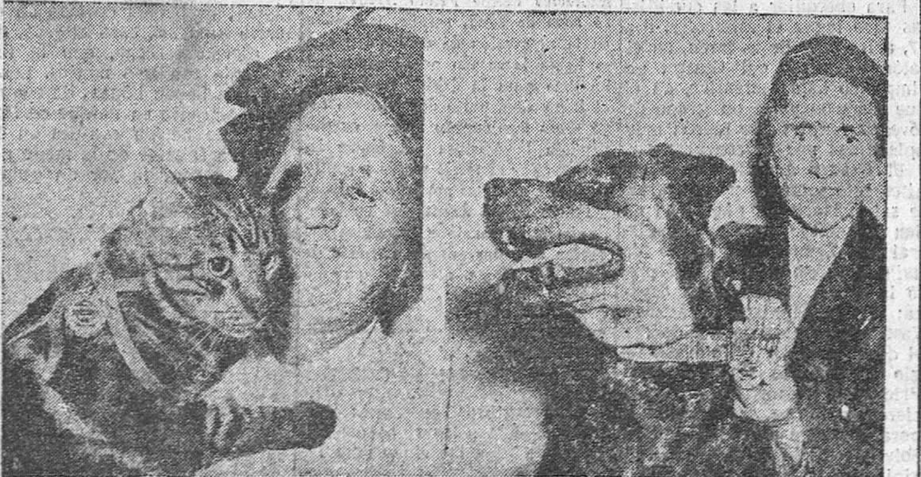
El gato "Buri" y el perro "Rita" han sido condecorados por la Sociedad Protectora de Animales de Viena con las Medallas de Salvamento. "Buri" salvó a su dueña de ahogamiento por gas; "Rita", de muerte por atraca. Se les concedió medalla y comida extra.