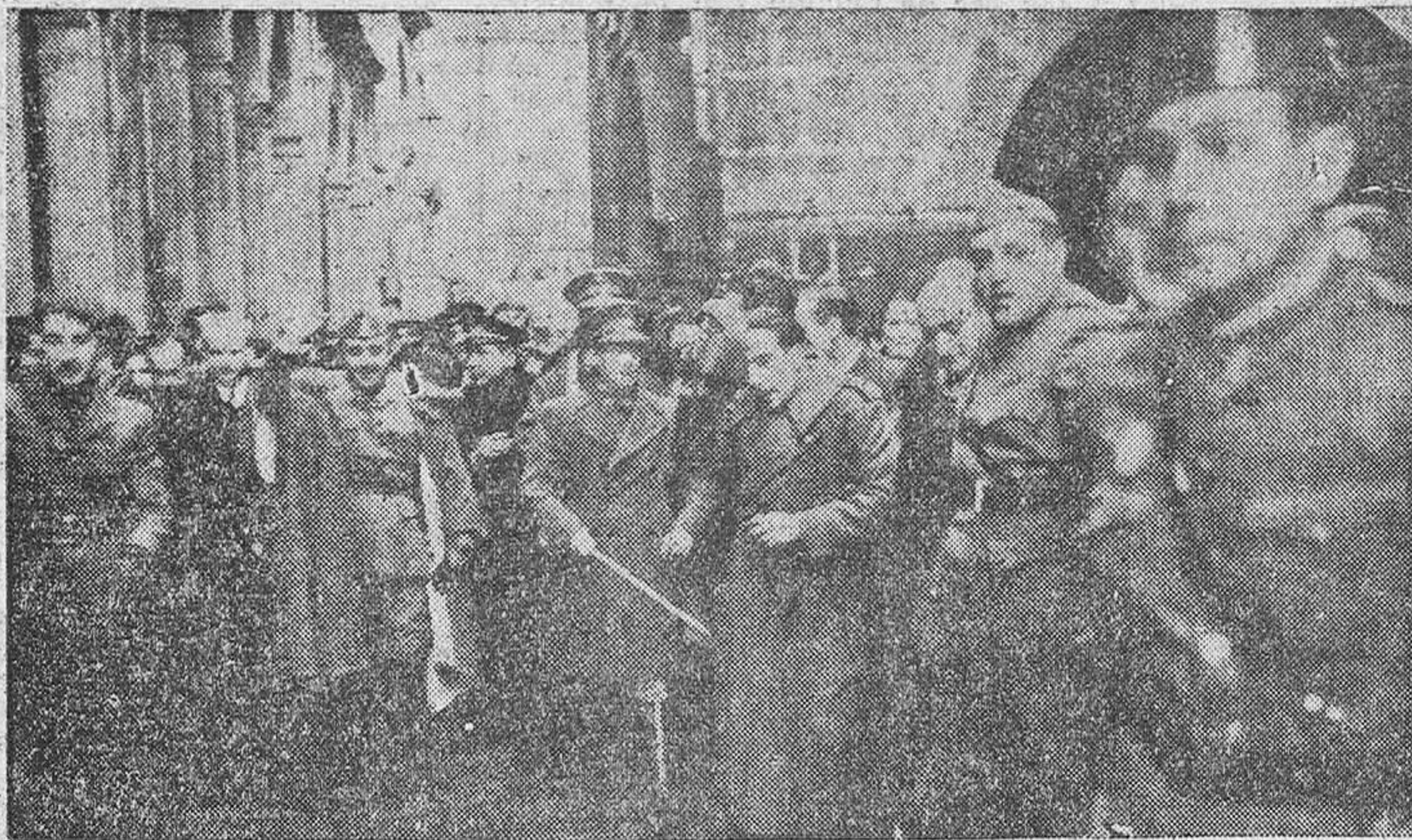
Francisco aclamado en las calles de Burgos

Por el caminito devoto de las Afriquitias de Ceuta, por la veredilla del mar que hace saltar los fandanguillos que a la Virgen verdemorena le rezan y las letanias que le cantan, iba el General Francisco Franco en la mañana clara de estío para impetrar el milagro. Tras sus espuelas, cabildo y ciudad, caminaban, en la restauración de una de aquellas antiguas y ferrosas peregrinaciones, hacia la Catedral, donde una Virgen varada en bahías de concilios conciliaba Roma y Africa.