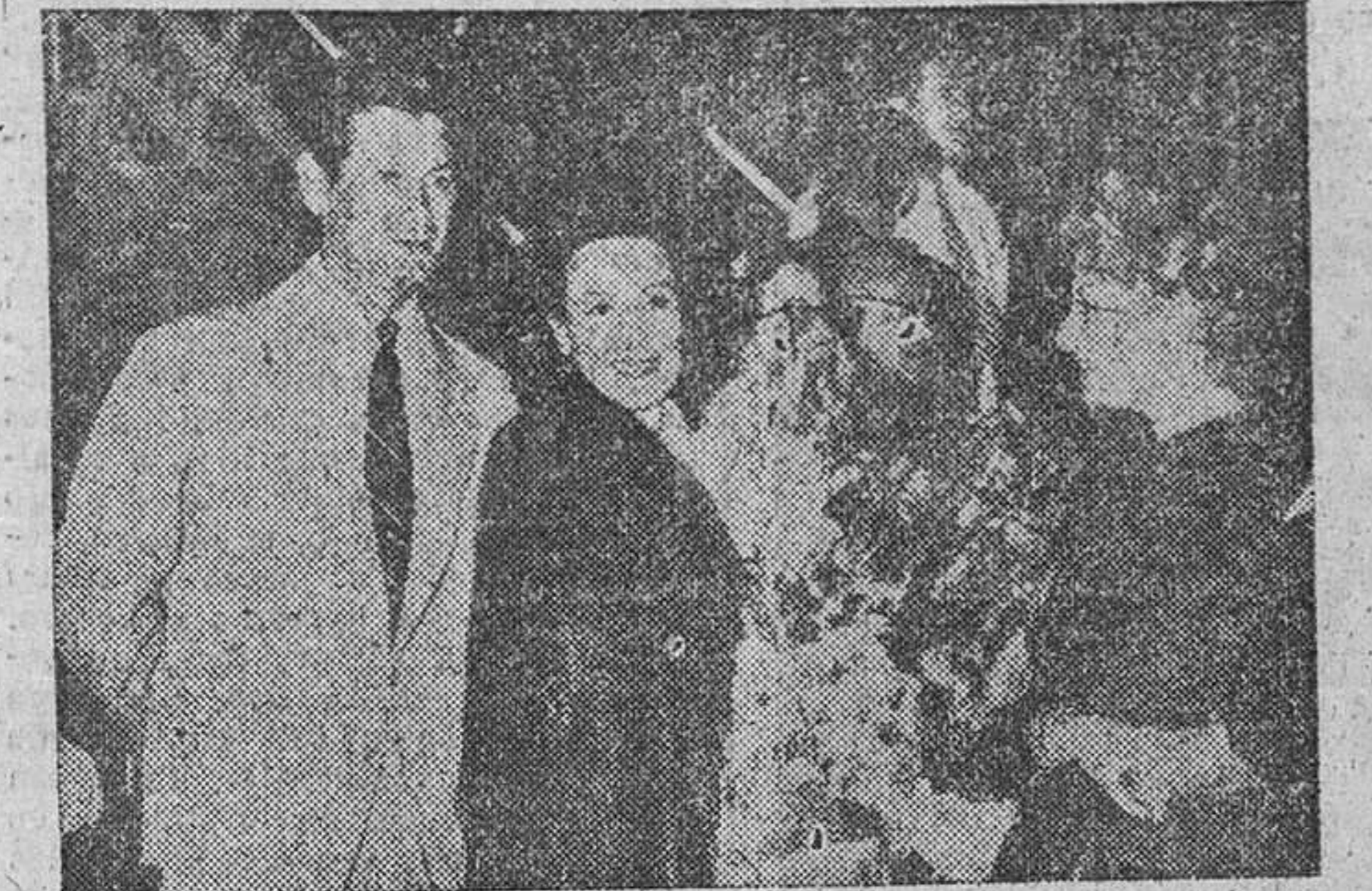
Dolores del Rio es saludada en el aeropuerto de Barajas por la actriz Lina Yegros y el galán José Suárez, su compañero de interpretación en la película "Señora Ama", según este drama de Benavente.

2.500.000 ESCUDOS PARA LA INDIA PORTUGUESA Lisboa, 26.—El Gobierno portugués ha abierto un nuevo crédito de 2.500.000 escudos para la India portuguesa.—Efe.