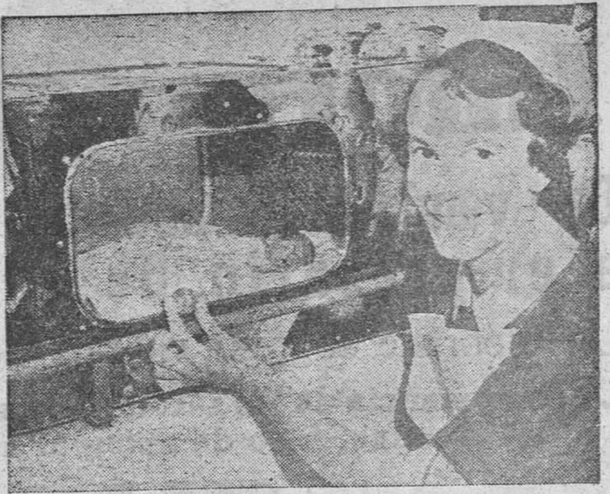
El ser más diminuto de las Islas Británicas es esta niña, que pesó al nacer ochocientos gramos, aproximadamente. Nació a los seis meses de gestación y fué depositada en la incubadora, donde se la ve en la fotografía.