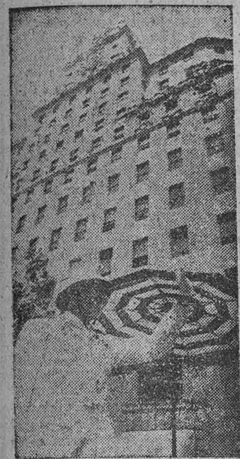
Los guardias de la circulación se protegen como pueden para resistir la alta temperatura del mediodía. (Un interesante reportaje en tercera página.)