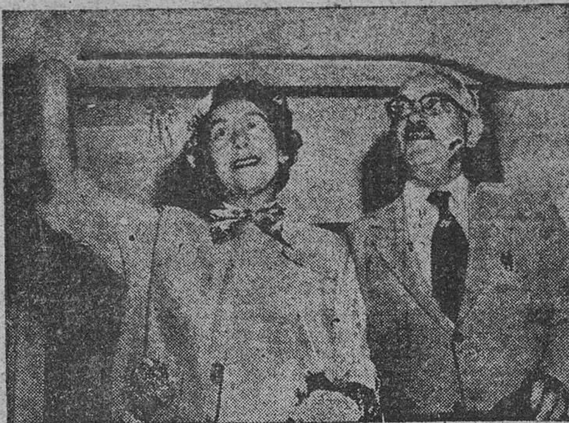
Premio Nobel de Medicina y Psicología, el doctor Selman Waksman, acompañado de su esposa, ha embarcado en el trasatlántico «Andrea Doria», rumbo a Madrid, donde pronunciará una conferencia sobre la tuberculosis.