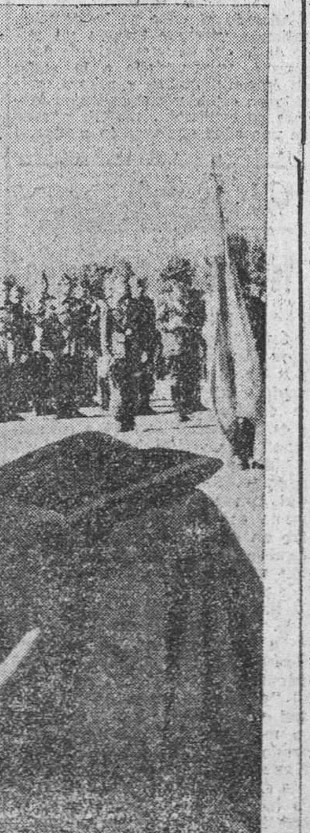
El general Vierna, gobernador militar de Valladolid, que presidió los actos.

Lisboa, 1. — Instrucción militar será dada inmediatamente al grupo de voluntarios de Goa, según afirma el gobernador general de la India portuguesa. El grupo voluntario portugués será destinado en su momento a la misión que designe el gobernador general. El más joven de estos voluntarios, autorizado por su padre para alistarse, cuenta con 12 años y el de más edad, 36. Se calcula que el número de estos voluntarios asciende a unos 300.—Efe.