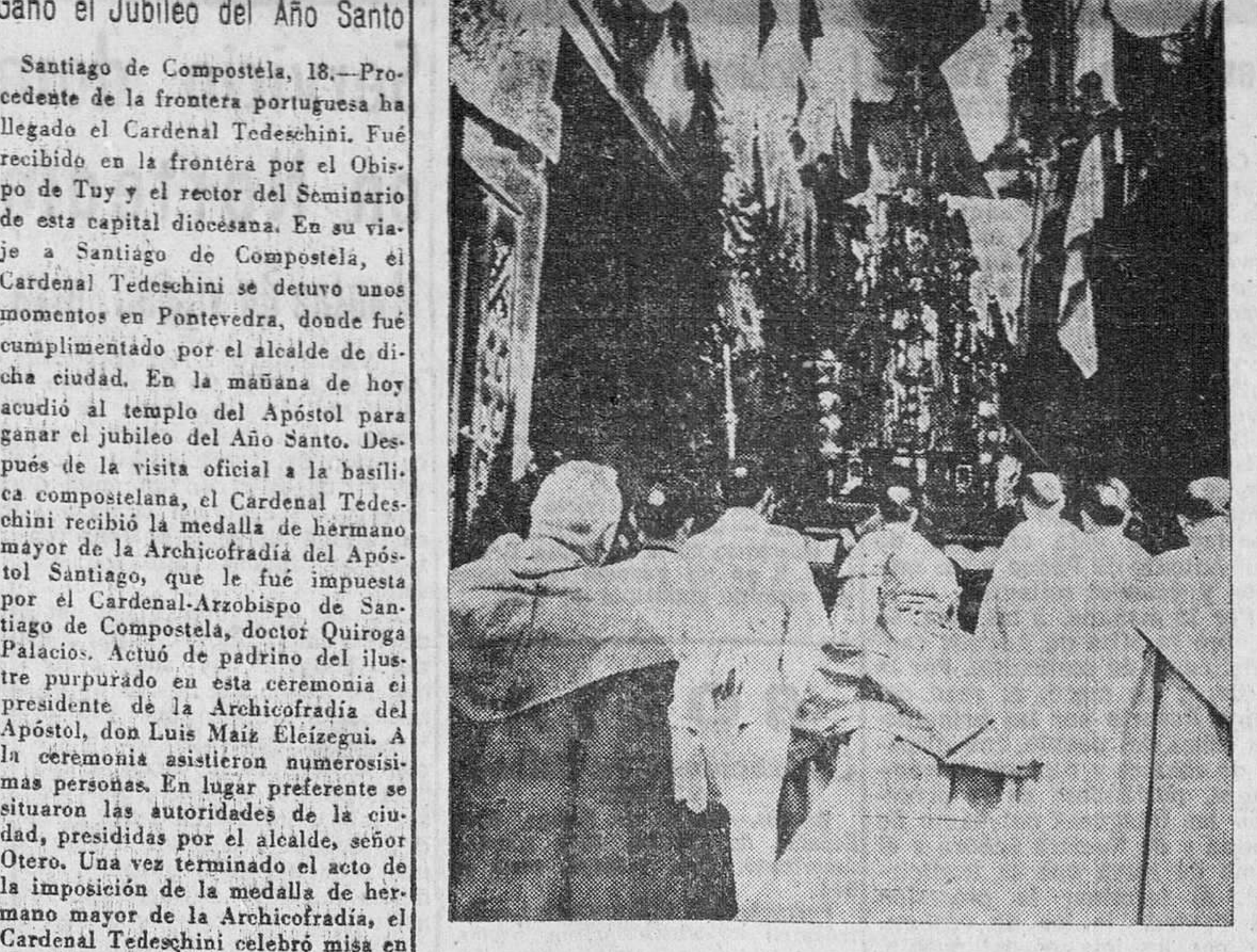
La Custodia, bajo toldos, en las calles alfombradas de romero y tomillo reflejan una de las más famosas procesiones de España, a la que todos los años acuden miles de torasteros españoles y extranjeros.

El ministro de Asuntos Exteriores de Pakistán visita a Dulles Washington, 18.—El ministro de Asuntos Exteriores del Pakistán, sir Zafrullah Khan ha hecho una visita de cortesía al secretario de Estado, Foster Dulles. Zafrullah Khan se halla en Estados Unidos para llevar a efecto discusiones con funcionarios del Banco Nacional.—Efe. Marcha a Tetuán el Alto Comisario Barajas, 18.—En avión ha marchado a Tetuán el Alto Comisario de España en Marruecos, teniente general García Valiño, acompañado de su esposa y séquito. También viaja en el mismo aparato el general Gallego, jefe de las Fuerzas Aéreas de Marruecos.—Cifra.