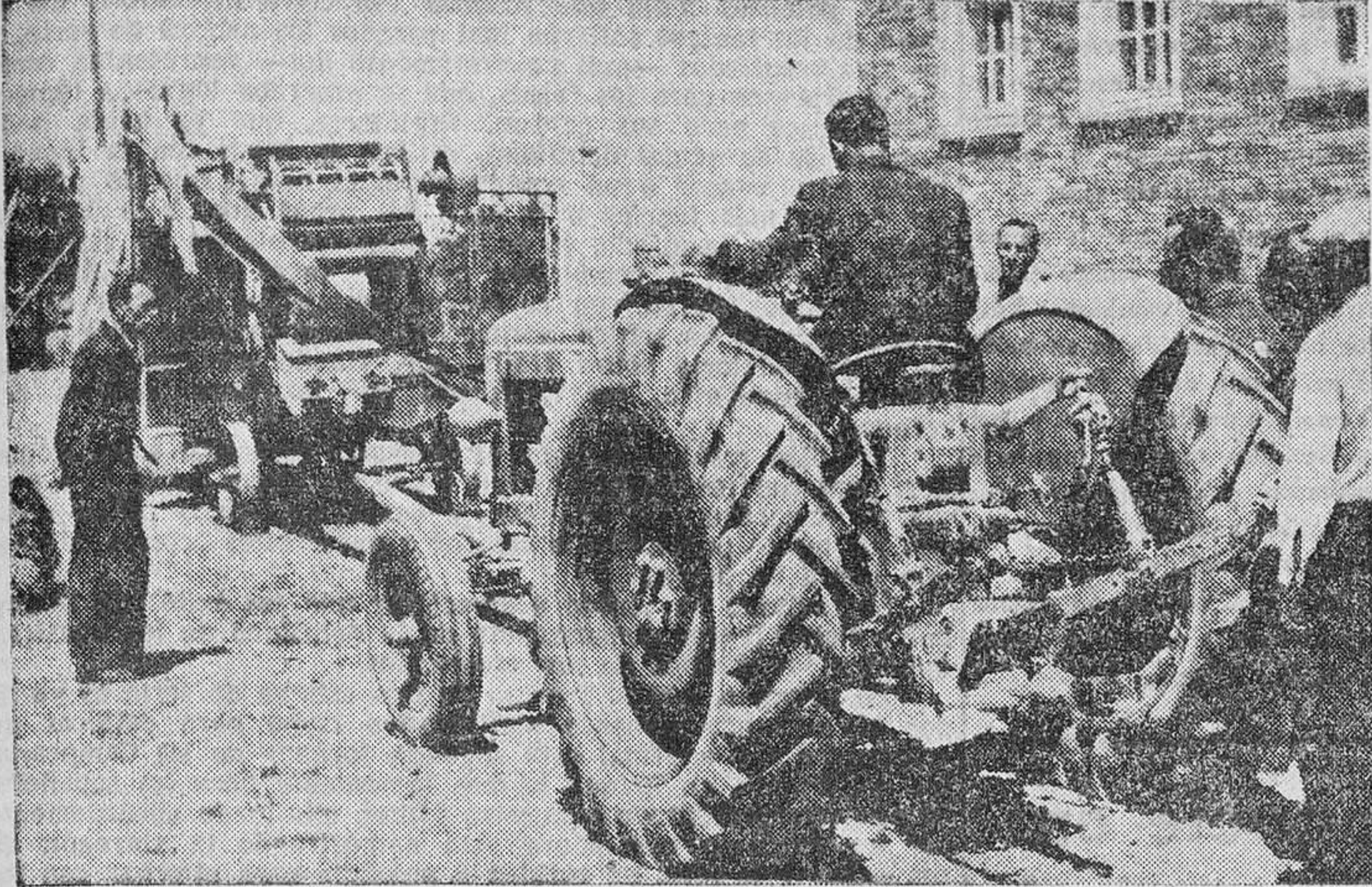
Un momento del Concurso.

Valladolid.—El jueves se celebró, en terrenos de la Escuela Profesional "Onesimo Redondo", el Concurso Regional de Tractoristas, organizado por la Cámara Agraria de Valladolid, y valedero para optar al premio nacional de tractoristas "Destreza en el Oficio", creado por la Delegación Nacional de Sindicatos y que otorga la Junta Nacional de Hermandades del campo, cuyas pruebas se celebrarán en Madrid en el próximo mes de julio.