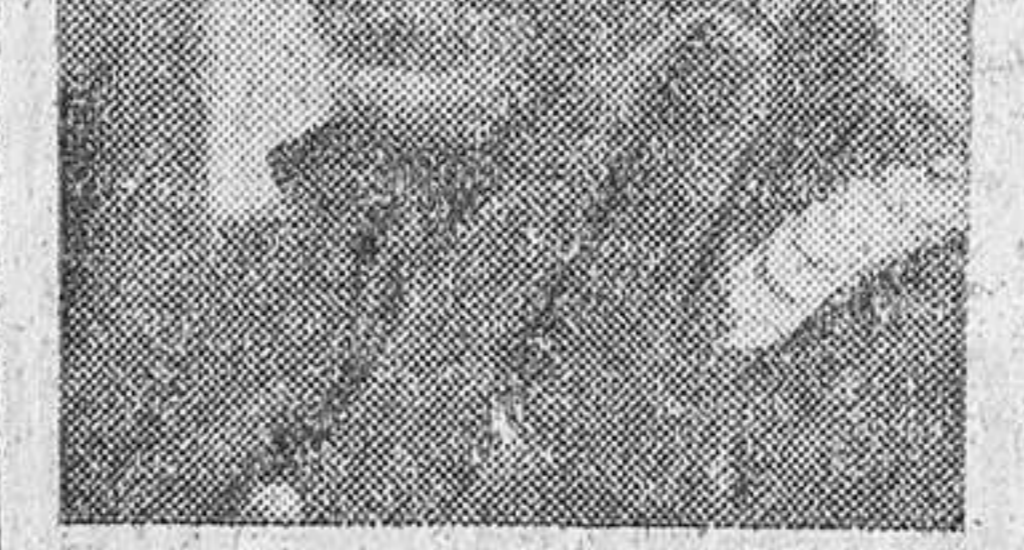
"El Bombero Torero"

"El Bombero Torero" y Eduardini son los creadores del elenco