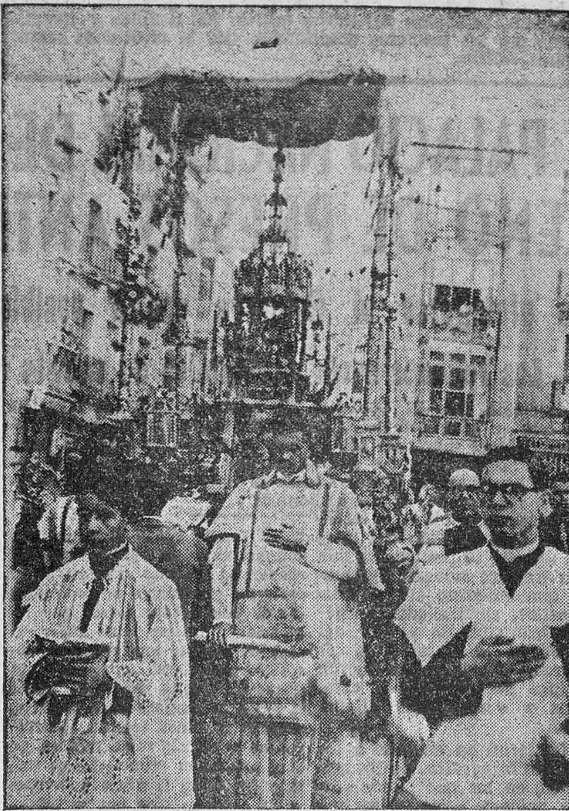
En la luminosa tarde del Corpus Christi, el Carro Triunfante recorrió el tradicional itinerario en medio del fervor de los zamoranos.