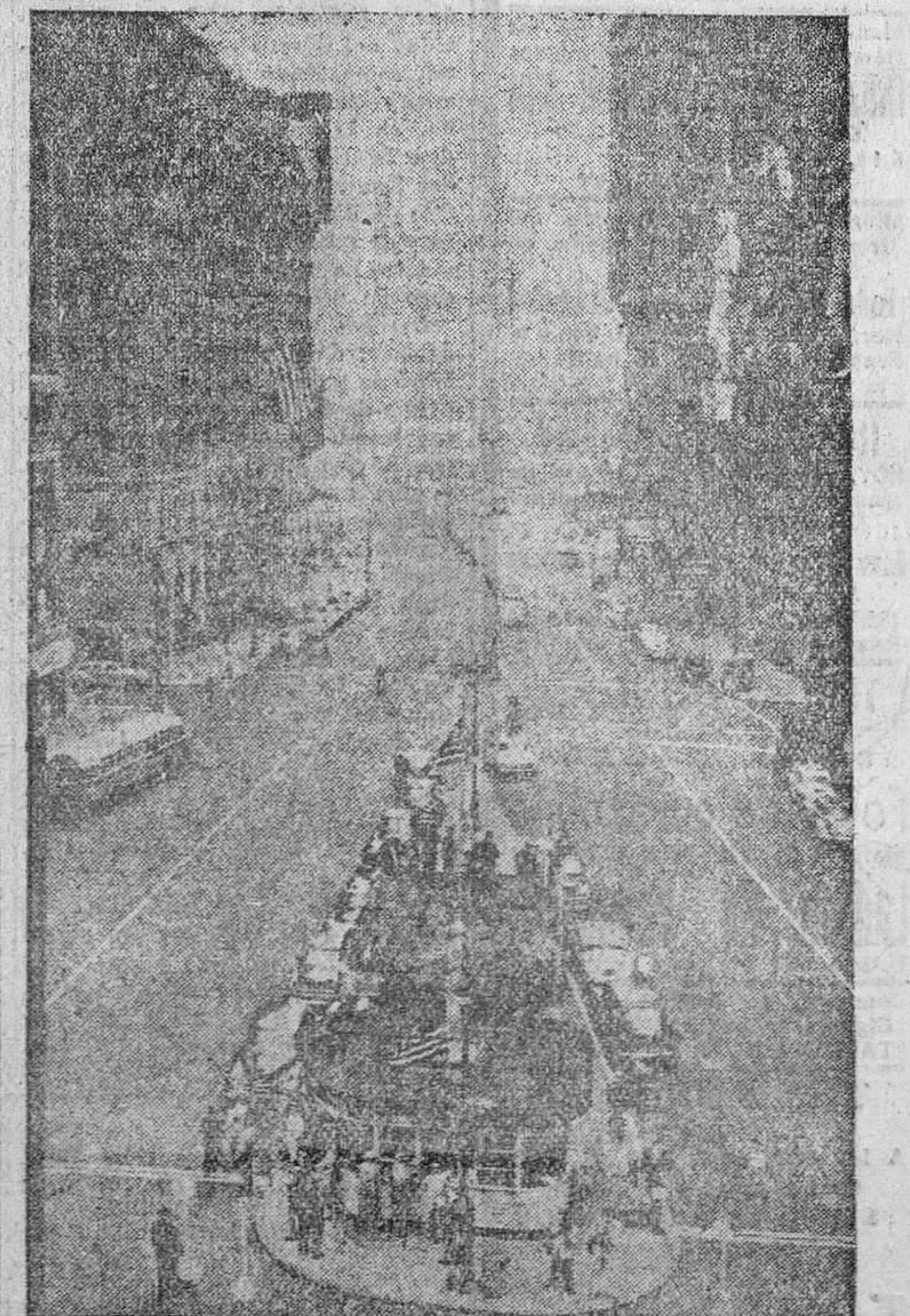
La famosa Times Square, de Nueva York, segundos después del anuncio del hipotético bombardeo con la bomba "H" sobre cincuenta y cuatro ciudades norteamericanas y canadienses. Los "muertos" fueron más de cinco millones y los "heridos" más de tres.