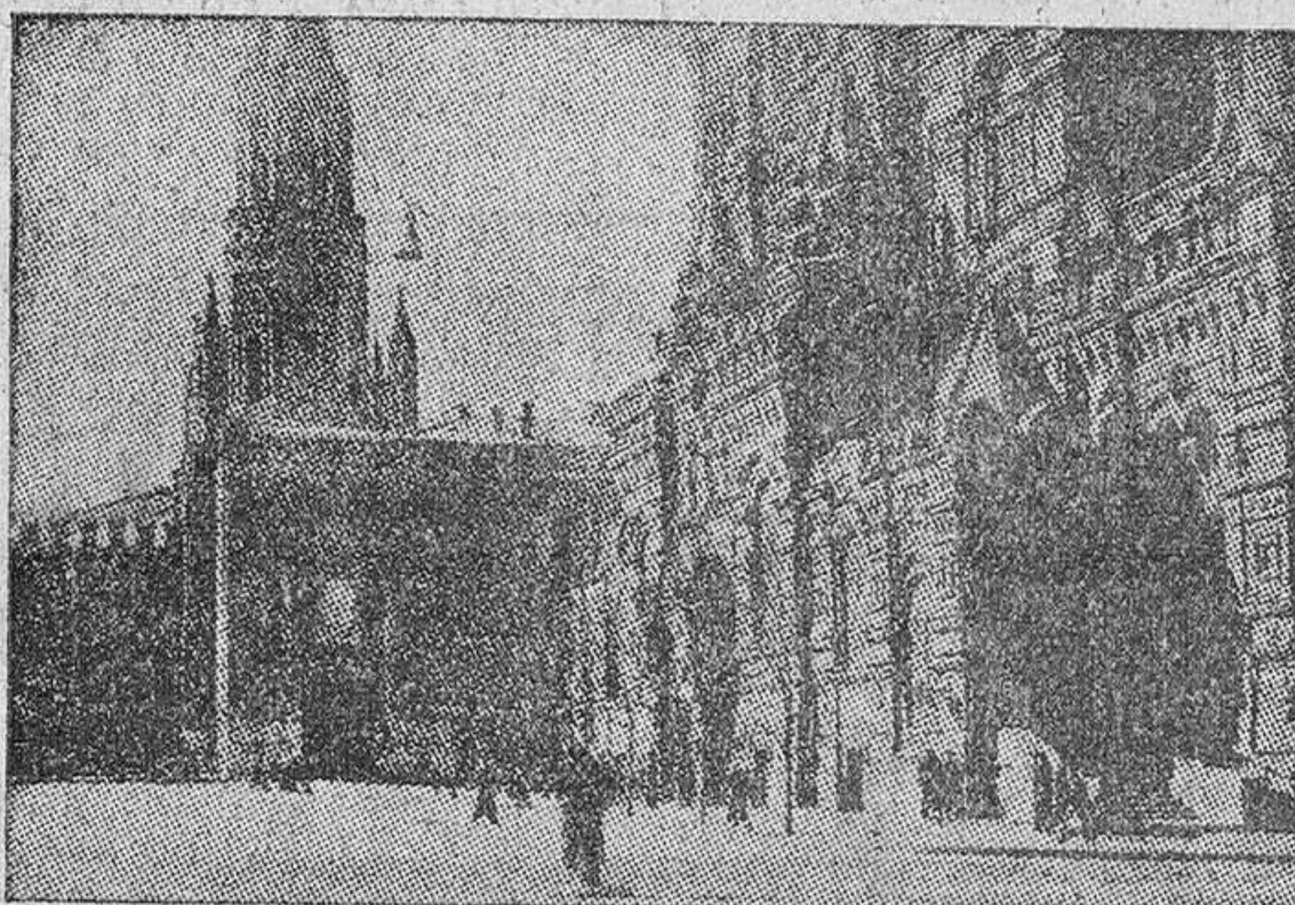
Una de las puertas del Kremlin. A la derecha, la fachada del Museo Histórico de Moscú.

En Leningrado ha sido abierto de nuevo el "Museo de las Religiones", obra de la más solapada hipocresía