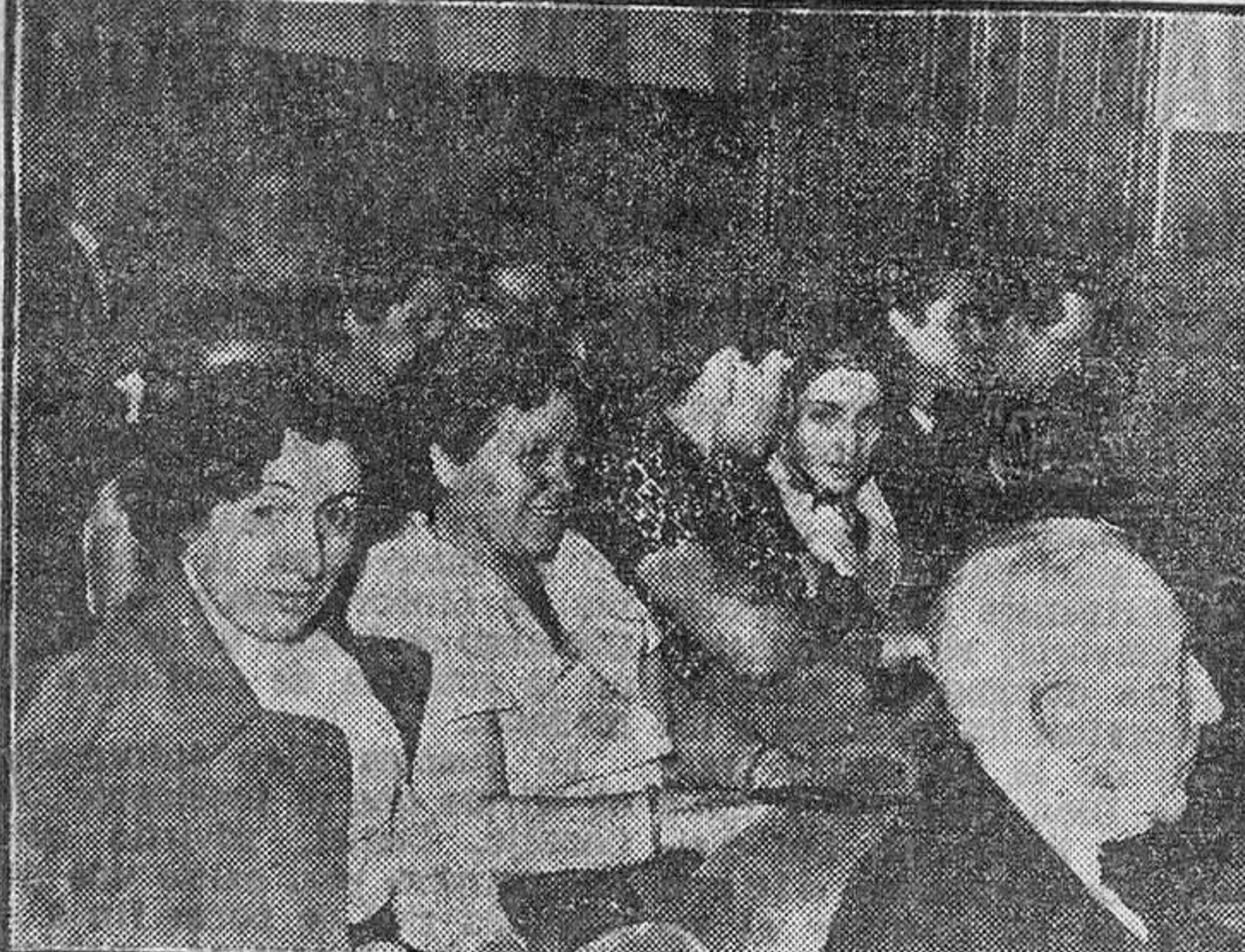
Aspecto del salón de la Cámara de la Propiedad Urbana durante el coloquio que siguió al acto de entrega de premios a los concursantes laureados por la Junta de Semana Santa.