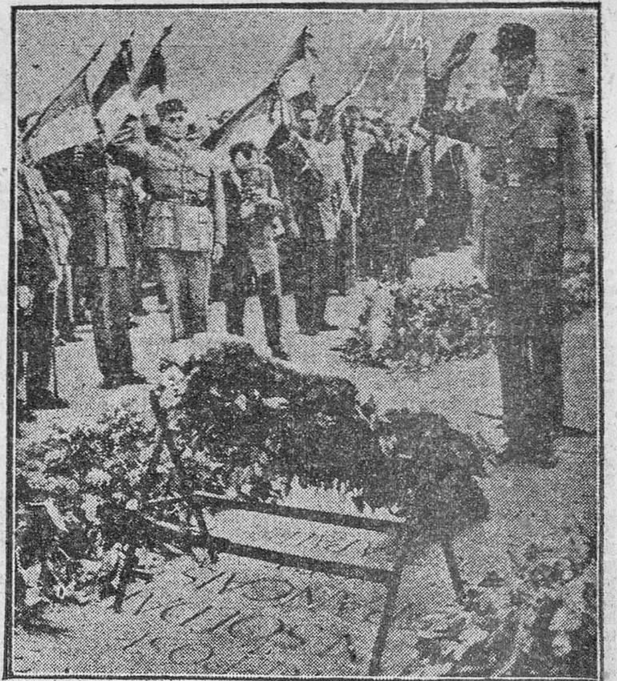
El general De Gaulle rinde su homenaje, entre solitario y clamoroso, a la memoria de los soldados de Dien Bien Fu. Desde aquel saludo ferviente que hizo a los comunistas de Stalingrado, hace unos años, han pasado el tiempo y los sucesos.