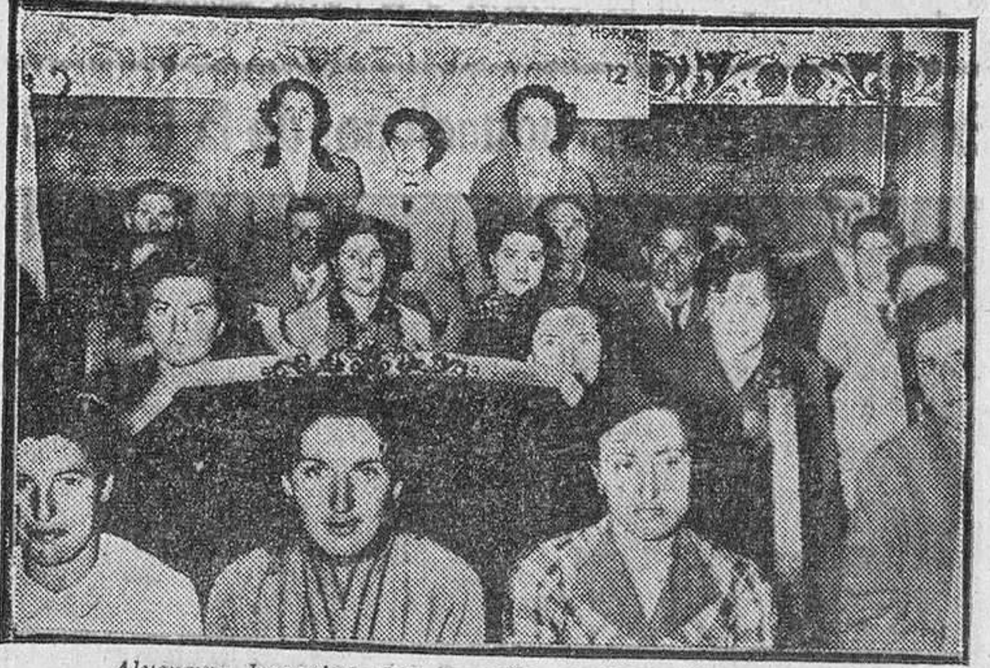
Alumnos becarios del Cursillo de Industrias Lácteas.