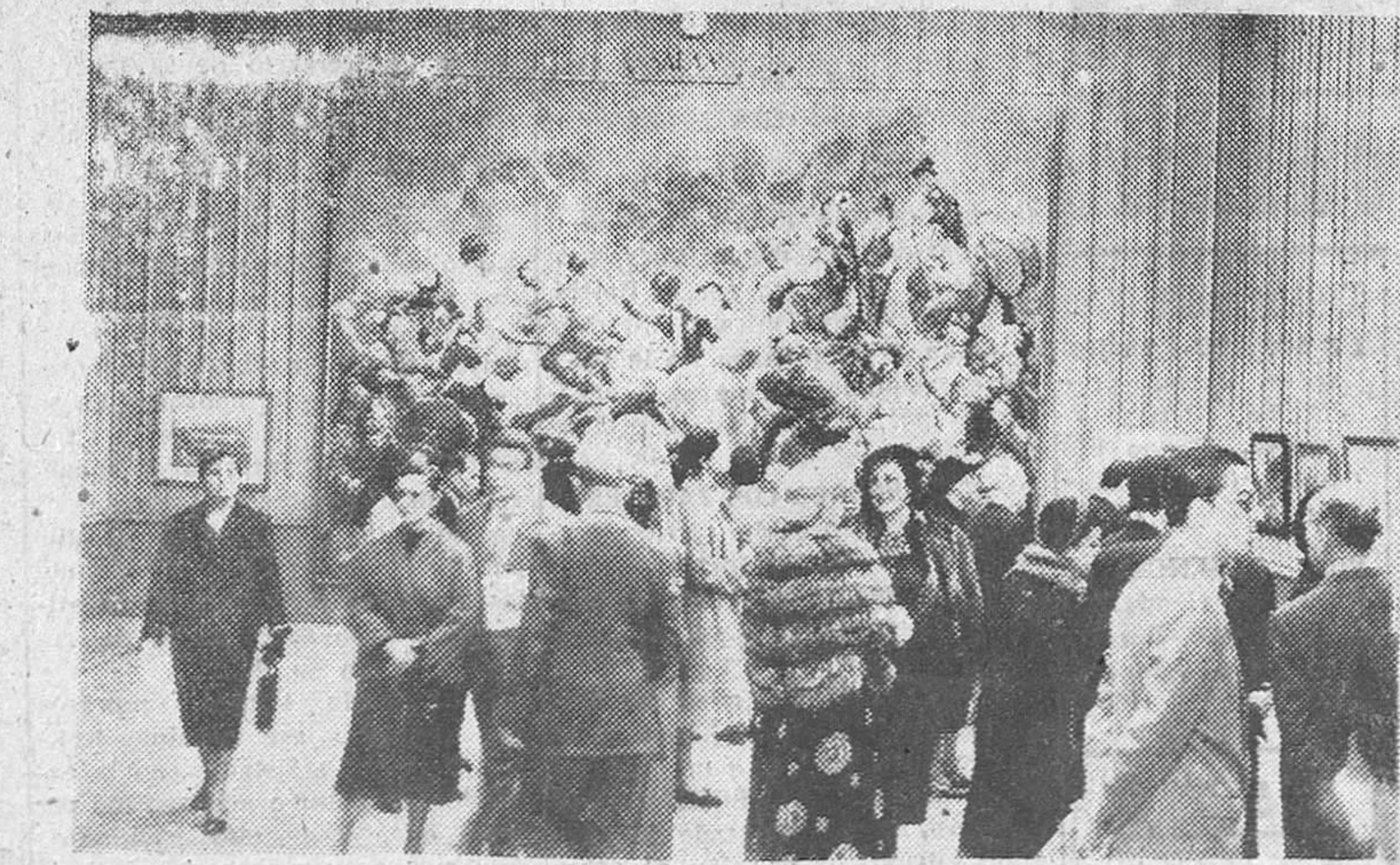
Vista de una de las salas del Palacio de Exposiciones del Retiro, en Madrid, durante la inauguración del XXV Salón de Otoño.

España, pese al trato injusto de que ha sido objeto, no abandona su puesto en esta hora difícil del mundo y está ahí, en el Alto de los Leones de Castilla, dando norma y ejemplo.