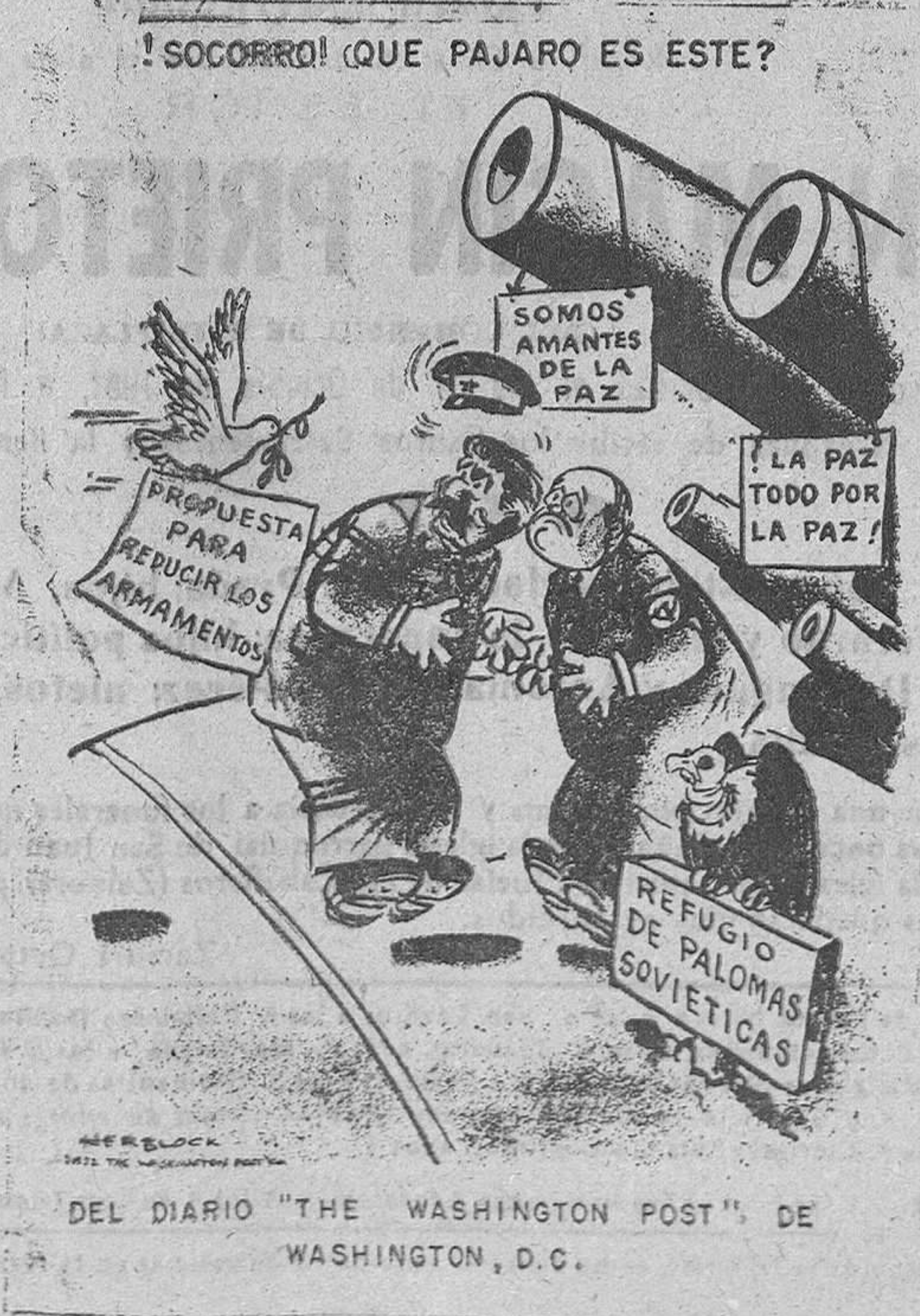
DEL DIARIO "THE WASHINGTON POST", DE WASHINGTON, D.C.

ORENSE, 15.—A las doce de esta mañana se recibió en el palacio episcopal la noticia oficial del nombramiento del nuevo obispo de Orense, recaído en la persona de don Angel Temiño Saiz. Inmediatamente se reunió el cabildo catedralicio en sesión extraordinaria y acordó que en todos los templos se lanzasen las campanas al vuelo en señal de júbilo, lo que se hizo a la una de la tarde, y que a las cuatro se celebrase un Te Deum en la catedral.—Cifra.