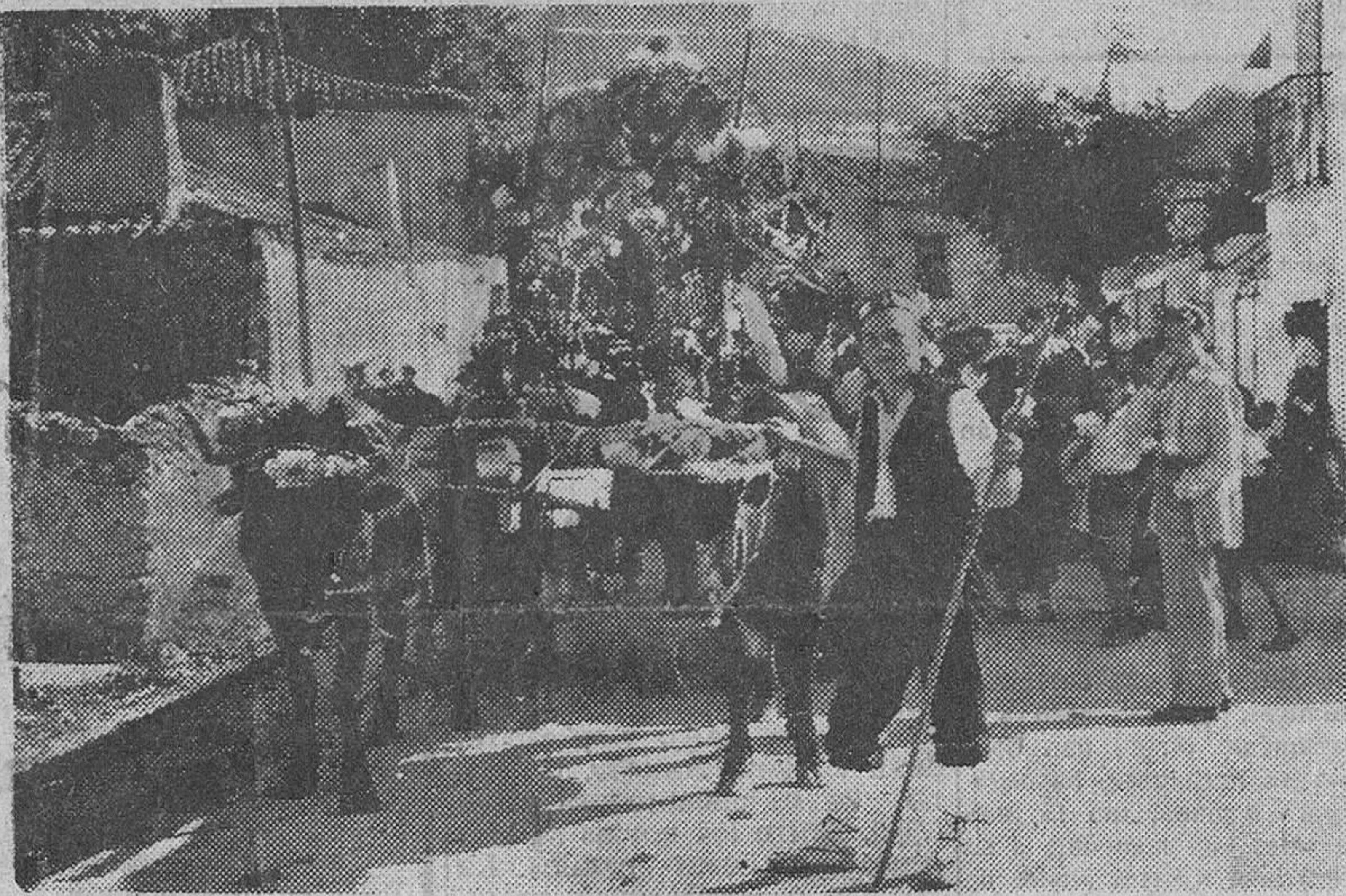
En casi todos los pueblos de España se celebran fiestas en estos días de septiembre. He aquí un pueblecito de Aragón en el que los labradores conmemoran la festividad de su Santa Patrona. En una carretera enjaezada va la Virgen, entre guirnaldas de flores. ¿Se concibe una manera más emotiva y sencilla de adorar a Dios?