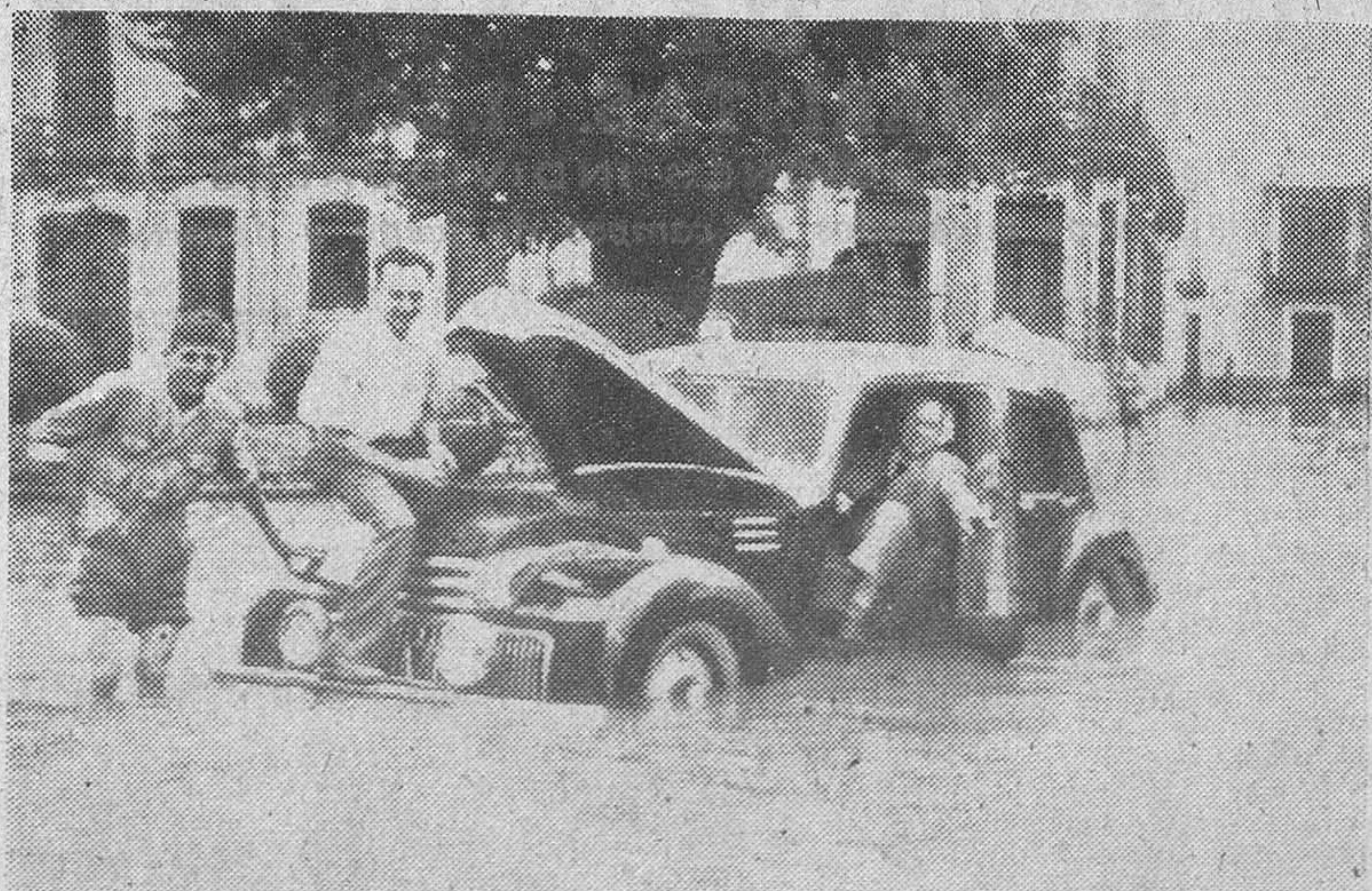
Una de las calles de Ciudad Real, que las lluvias torrenciales de estos días convirtieron en ríos poco menos que navegables.

WASHINGTON, 6.—En algunos medios oficiales se está a punto de renunciar a la posibilidad de llegar a una tregua en el conflicto de Corea. La impresión es tan pesimista que en la actualidad los planes estratégicos se basan en la creencia de que la actual situación se prolongará durante mucho tiempo.—Efe.