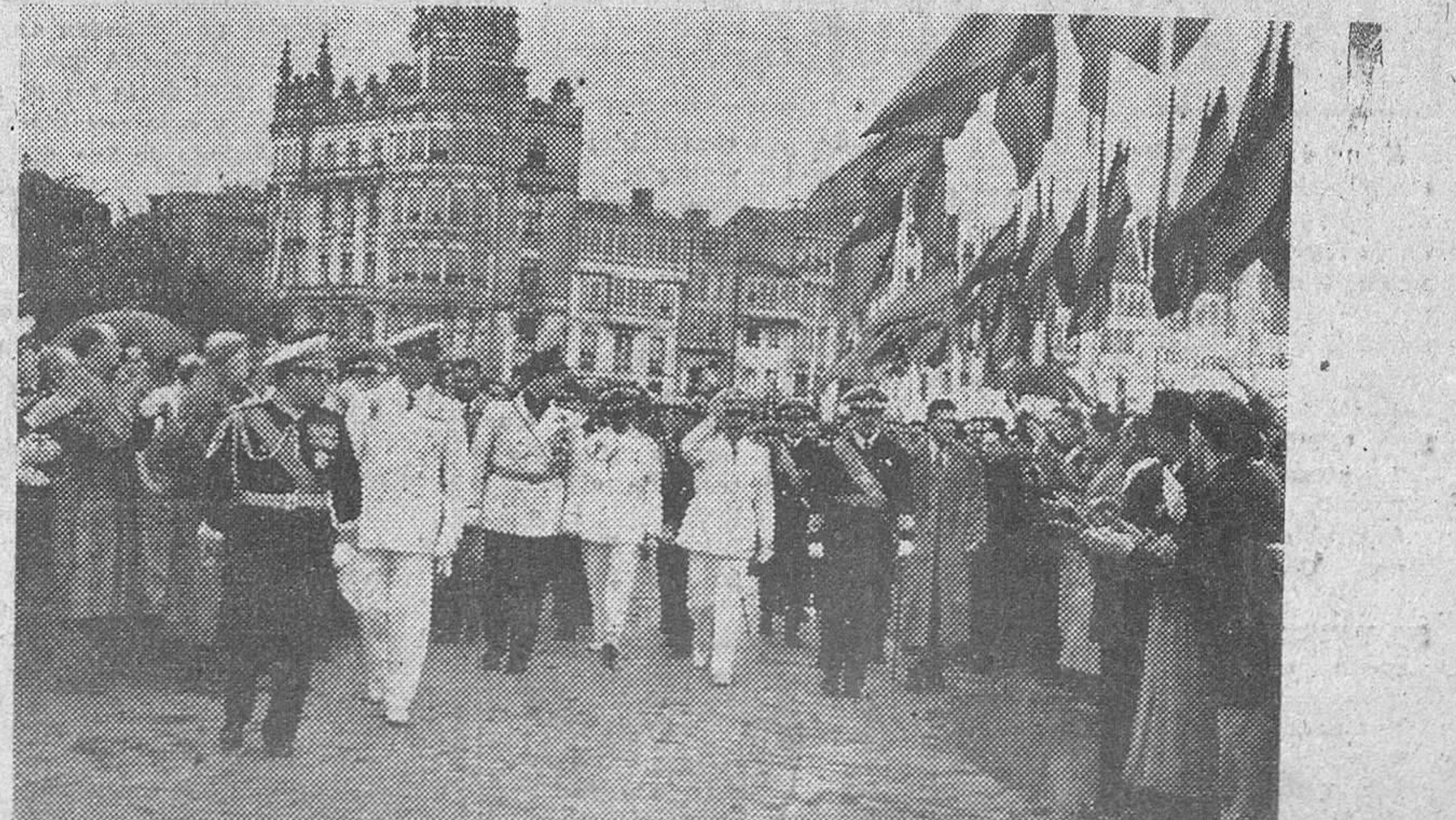
LA CORUNA.—El Jefe del Estado, Caudillo Franco, aclamado a su llegada a esta ciudad por la multitud que se apiñaba en el puerto a pesar de la inclemencia del tiempo.

Malik se extendió en argumentos de que los Estados Unidos apoyan solamente la admisión de los Estados que son sus aliados presentes o potenciales. Dijo que Washington apoya a Italia y Finlandia porque se ajustan al mando de los planes "agresivos" norteamericanos. "Venimos —continuó— que los Estados Unidos consideran a Italia como aliada presente y a Finlandia como posible aliado del futuro. Los Estados Unidos tienen el proyecto de establecer una posible base militar en Finlandia con el objeto de una agresión contra la Unión Soviética. También dijo que los Estados Unidos estaban tratando de convertir a las Naciones Unidas en una organización americana y que el delegado norteamericano Warren Austin está confundiendo a las Naciones Unidas con la NATO. Calificó al delegado chino nacionalista en el Consejo, Ung Fu-Tsiang, de agente del Kuomintang de una isla china ocupada por las tropas americanas.—Efe.