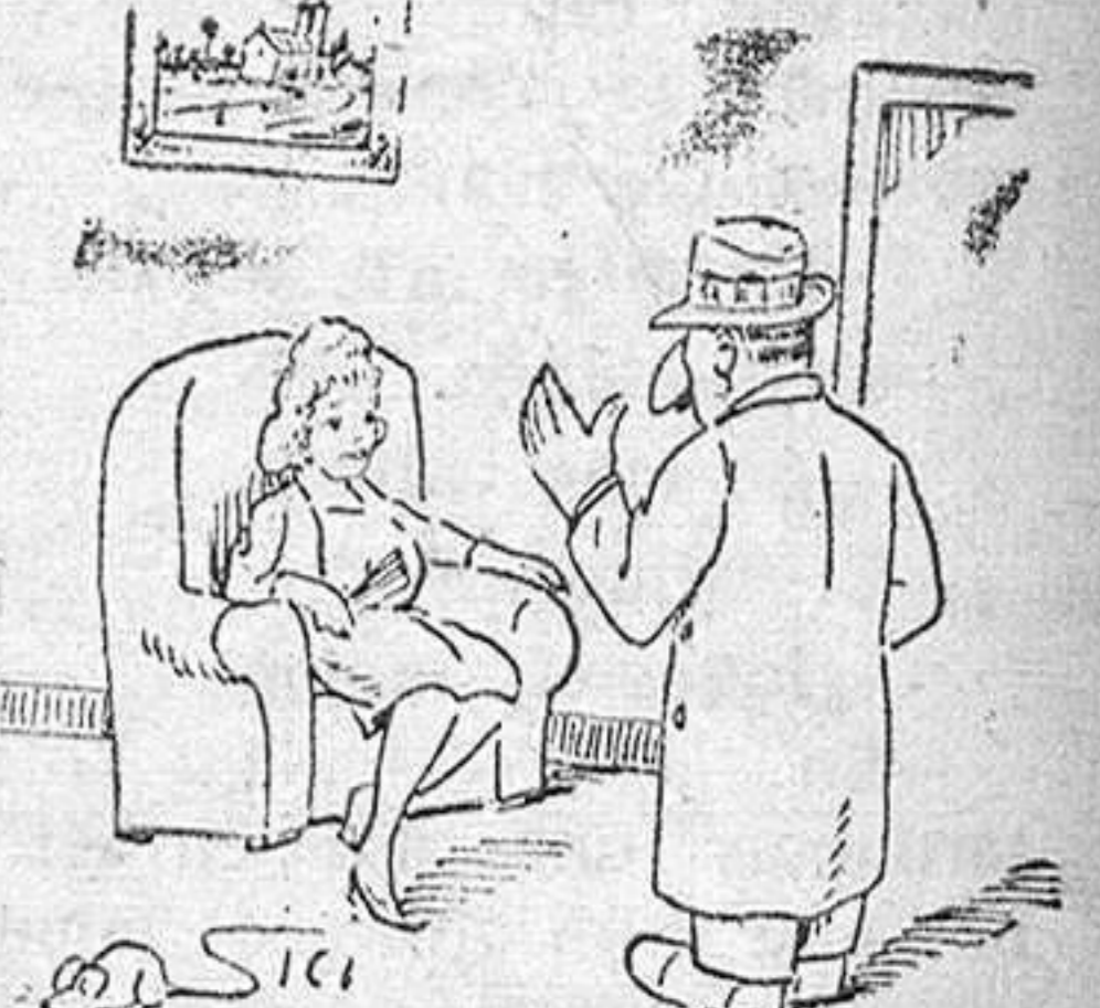
—A ver si tienes buena mano. —Buena no se, pero grande a la vista está.

En Hamburgo (Alemania), una estación de radio local, estableció una serie de premios para la novia ideal. Entre los regalos que la novia ideal elegida ha recibido, figura un certificado remitido por un abogado. Dicho certificado autoriza a la pareja de recién casados, a celebrar con el abogado una consulta gratuita sobre los procedimientos que hay que seguir, para obtener el divorcio.