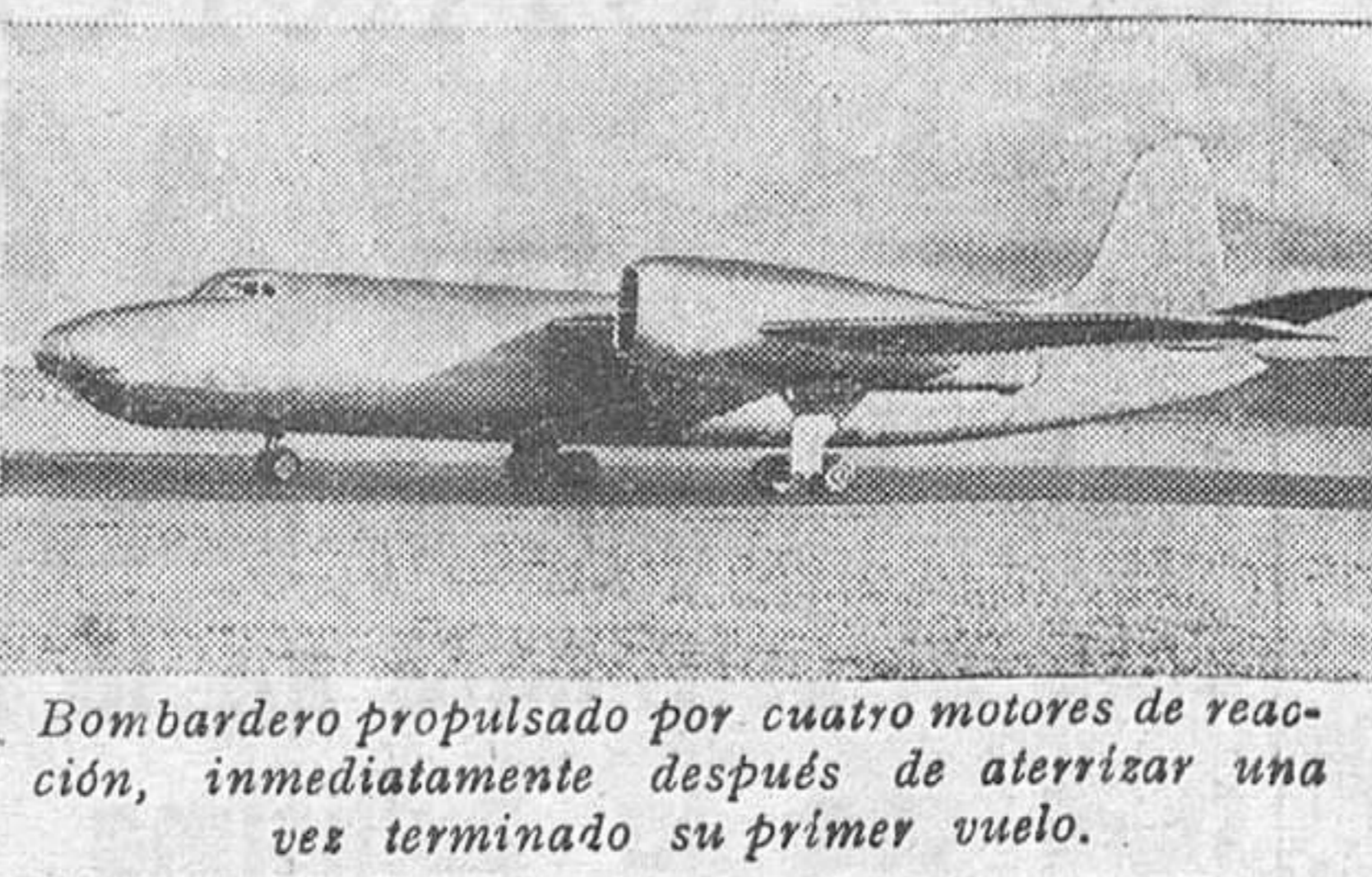
Bombardero propulsado por cuatro motores de reacción, inmediatamente después de aterrizar una vez terminado su primer vuelo.

La creciente potencia aérea de los soviets inquieta a los americanos EL PENTAGONO ESTA DEBIDAMENTE INFORMADO