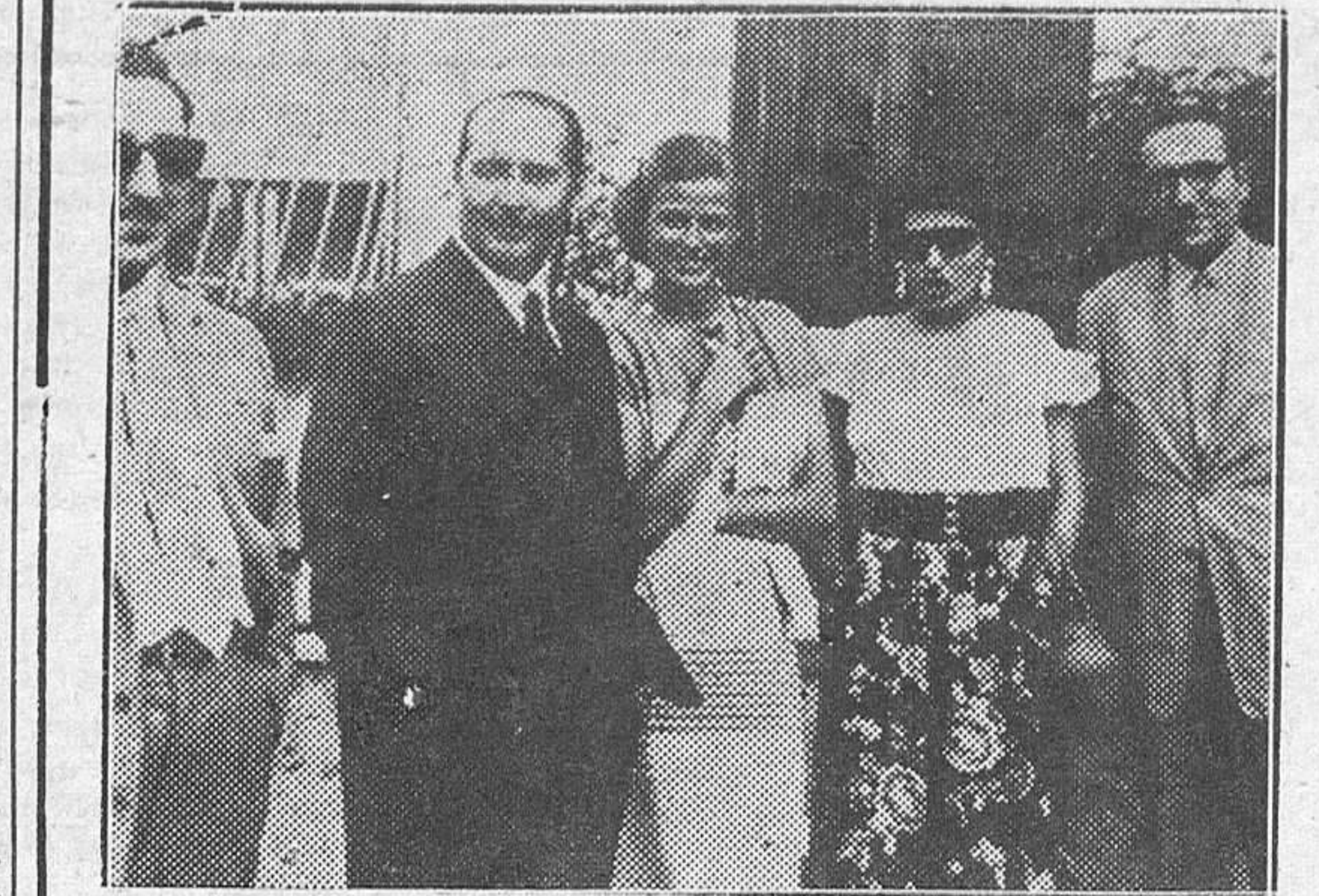
Jesús Vasallo visita a Ingrid Bergman y Rosellini

BARCELONA, 12.—Tres turistas norteamericanos, una muchacha y dos jóvenes de unos 18 a 20 años, han sido multados por la Brigada de servicio especial de la Guardia Urbana, con cincuenta pesetas