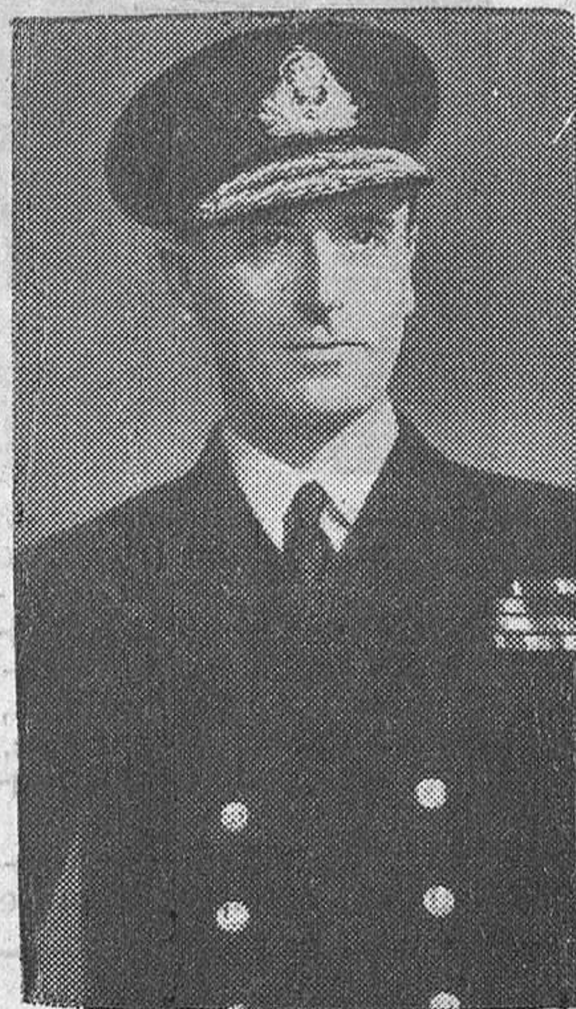
Se sabe en Washington que Grecia y Turquía se opondrían al nombramiento de Mountbatten como comandante de las fuerzas navales del Mediterráneo, pero se cree que estas objeciones podrían ser resueltas por el hecho de que Mountbatten estaría bajo las órdenes del almirante norteamericano.

En la organización prevista por las fuerzas navales aliadas del Mediterráneo, los círculos militares de Washington aseguran que las fuerzas aero-navales norteamericanas, con sus "armas especiales" (proyectiles atómicos y teledrificados), tendrán que estar bajo el control exclusivo de comandantes norteamericanos, a menos que el Congreso altere las leyes vigentes. Por otra parte, el control de las líneas tradicionales de comunicación del Mediterráneo, estaría garantizado por la armada británica.