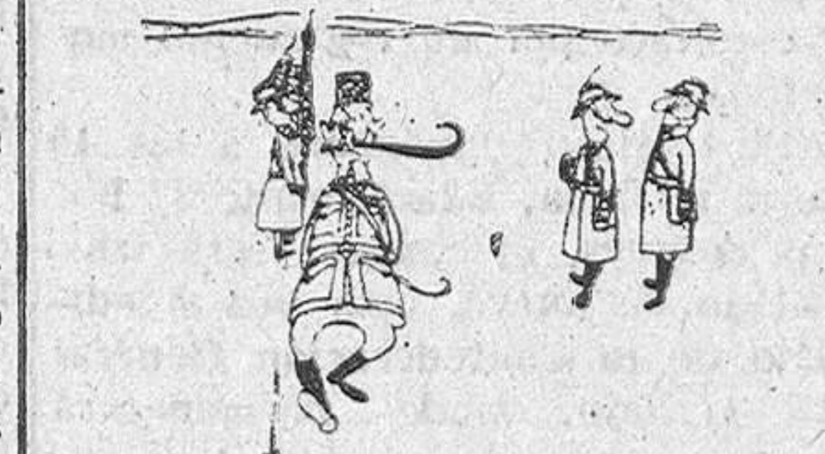
—De revista en revista, el general ha acabado por llevar solamente medio bigote.

La técnica de nuestras películas de dibujos es excelente; nuestros dibujantes tienen inspiración y gracia, y bien pueden competir con los mejores de cualquier parte. Pero la competencia no está sólo en el arte sino más aún, por lo que al cine se refiere, en las industrias, y la industria americana nos lleva una ventaja de muchos años y de mucha organización en materia de cine. Cuando el espectador de buena fe se pregunta por qué los dibujos animados españoles, pese a sus virtudes muy abundantes, no son tan buenos como los americanos, ha de pensarse en este hecho fundamental de la experiencia. Nada más que en eso.