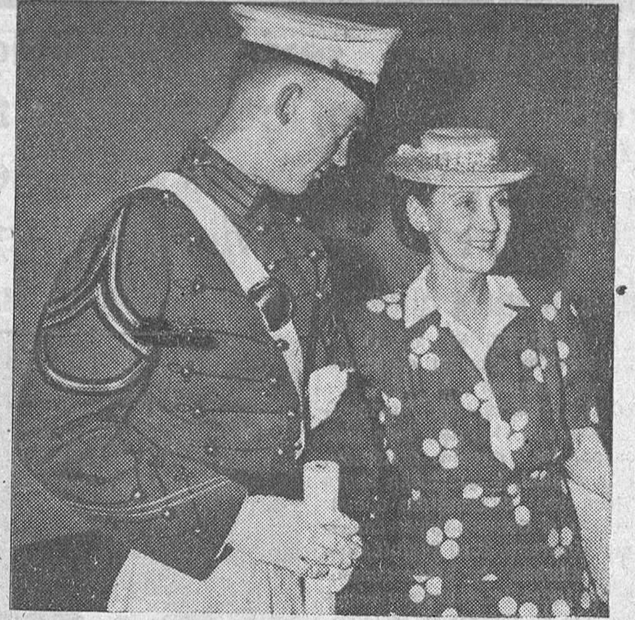
La esposa del general Eisenhower aparece aquí junto a su único hijo John S. D. Eisenhower.

¿QUIEN será en 1953 la primera dama de los Estados Unidos? ¿Quién recibirá, al lado del nuevo Presidente, a los invitados de la Casa Blanca?