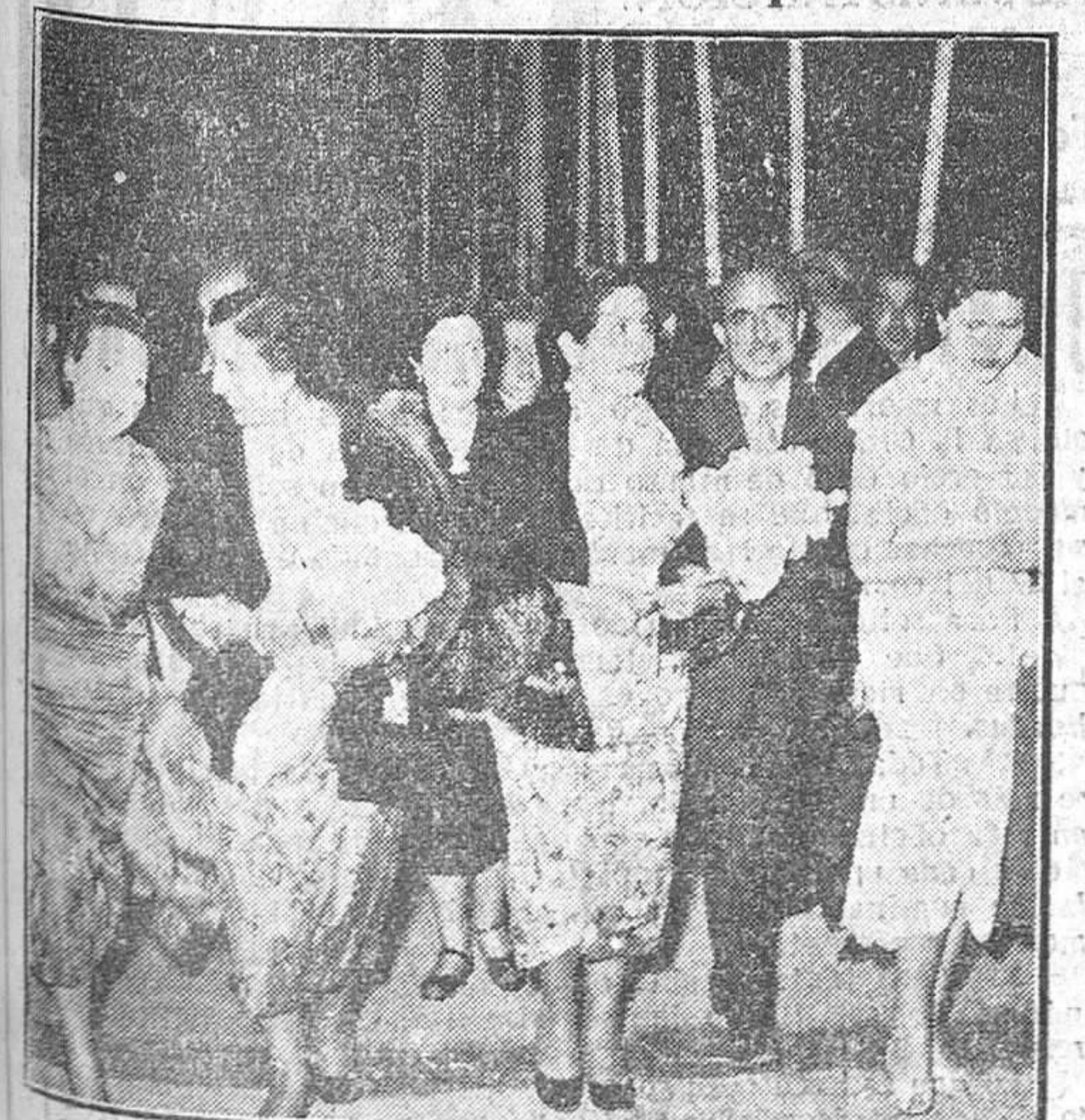
MADRID.—La esposa de S. E. el Jefe del Estado, doña Carmen Polo de Franco, y la esposa del presidente del Perú, doña María Odría, acompañadas de otras personalidades, a su llegada al teatro de la Feria para presenciar una fiesta folclórica.