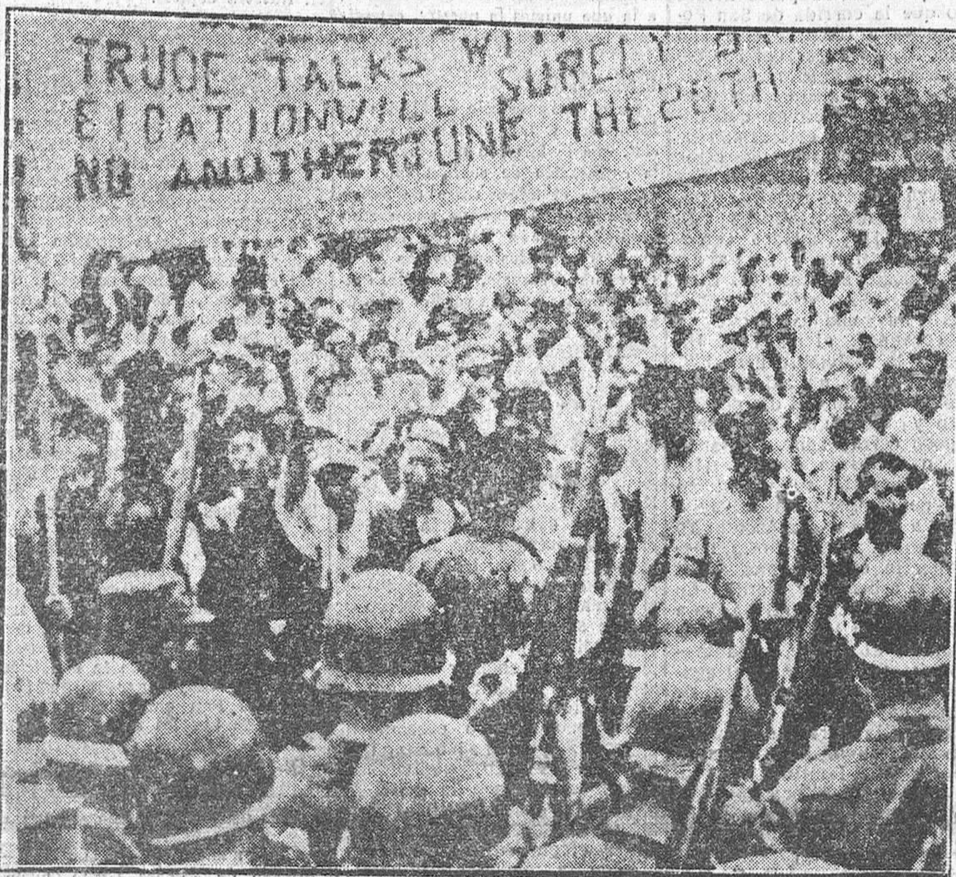
Comunista están para cumplirse tres años de guerra, en las ciudades de Corea del Sur arrecian las manifestaciones contra la tregua que se gestiona en Panmunjon. "El armisticio no traerá otro 25 de junio", dicen los cartelones, precisamente ahora que esa fecha va a repetirse por tercera vez.