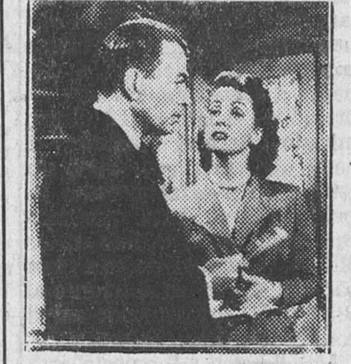
Ayer se estrenó en el Cine Barrueco, con gran éxito la película “Operación Cicerón”. Por falta de espacio aplazamos nuestra crítica para el próximo número.

a los intrépidos pilotos de pruebas que del cielo a la tierra, tejen, con su sangre, una línea de heroísmos.