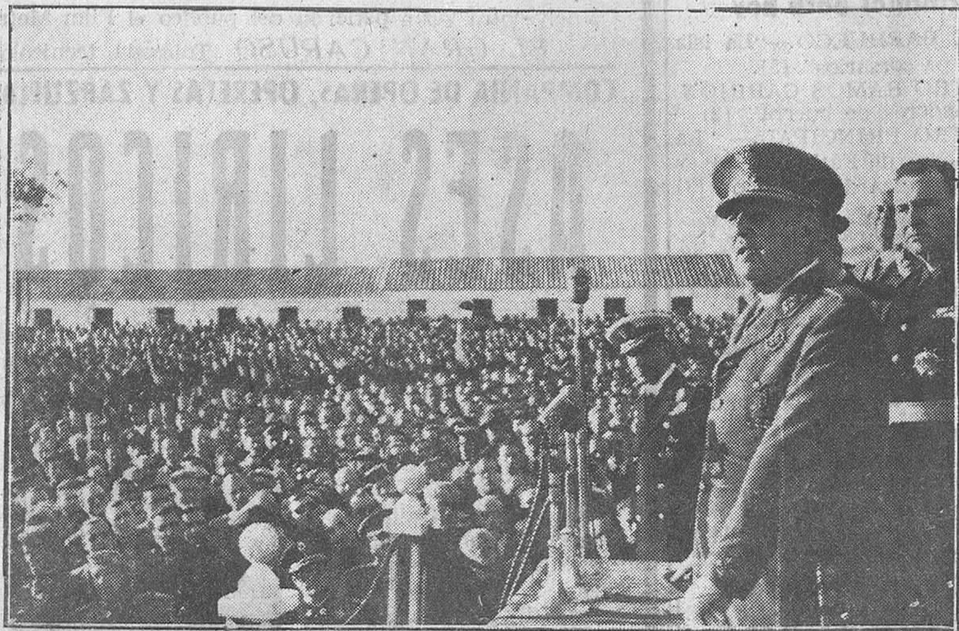
SEVILLA.—S.E. el Jefe del Estado durante el discurso que pronunció en el acto de entrega de viviendas en la barriada de Santa Teresa.

SEVILLA, 18.—Su Excelencia el Jefe del Estado salió del Alcázar esta mañana, a las nueve, para dirigirse a la zona repoblada del Patrimonio Forestal del Estado, en los términos de Almonte y Bañares, de la provincia de Huelva. Esta zona abarca una superficie de más de treinta mil hectáreas, de las cuales, la mitad ha sido repoblada de eucaliptus, y la otra mitad, de pinos.