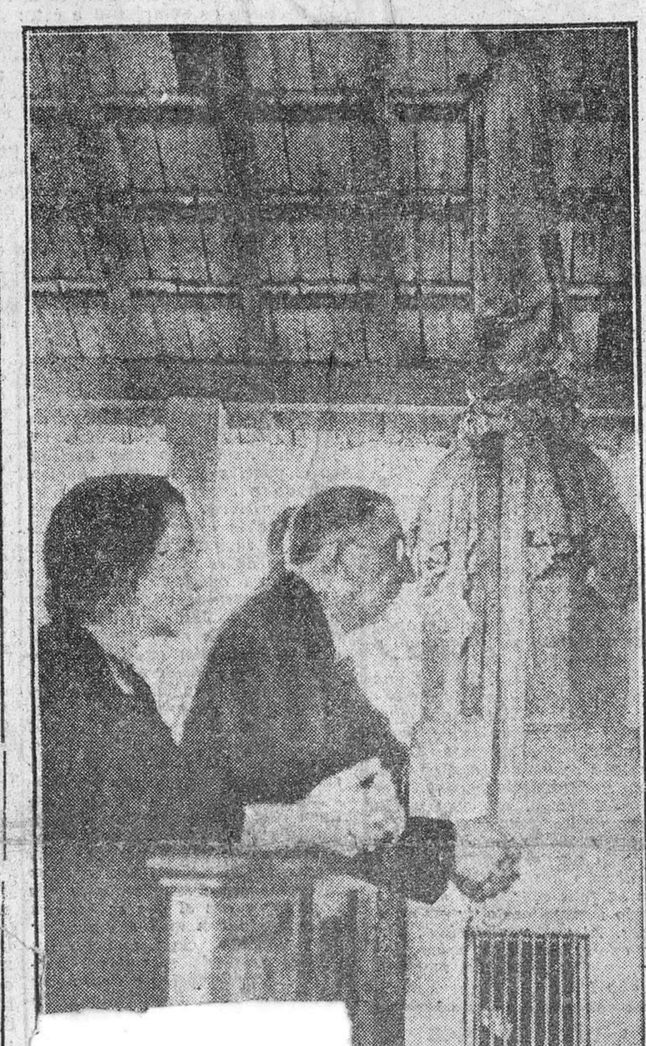
Valera en el santuario de Fatima en Portugal, rezó mucho su día nuestro corresponsal.

En Francia nuevas subidas no satisfacen ARA ASEGURAR EL SERVICIO POSTAL Paris, 19.—Para asegurar la continuidad del servicio postal, en caso de otra huelga, se ha enviado una circular confidencial desde el Ministerio de Comunicaciones, a las autoridades postales regionales y provinciales, para que hagan listas con los nombres de los empleados cuyos servicios se consideren indispensables, y para que estudien la posibilidad de castigos contra los que abandonaron sus puestos en la huelga de agosto. Los Sindicatos sostienen que esto rompe el acuerdo con el que se puso fin a la huelga. Los empleados postales no comunistas figuran entre los primeros que accedieron a retornar a sus puestos en el mes pasado. La esperada reunión de la Comisión de contratación colectiva se celebrará el martes próximo. Unirá a Sindicatos, Gobierno y empresas, en un intento de llegar a una decisión sobre aumento de salarios y jornales, para unos tres millones de personas empleadas en industrias particulares.—Efe. NI UNIDAD, NI PODER Nueva York, 19.—El "New York Times" dice hoy que el Gobierno francés no tiene ni la unidad ni el poder necesarios para ser efectivo.