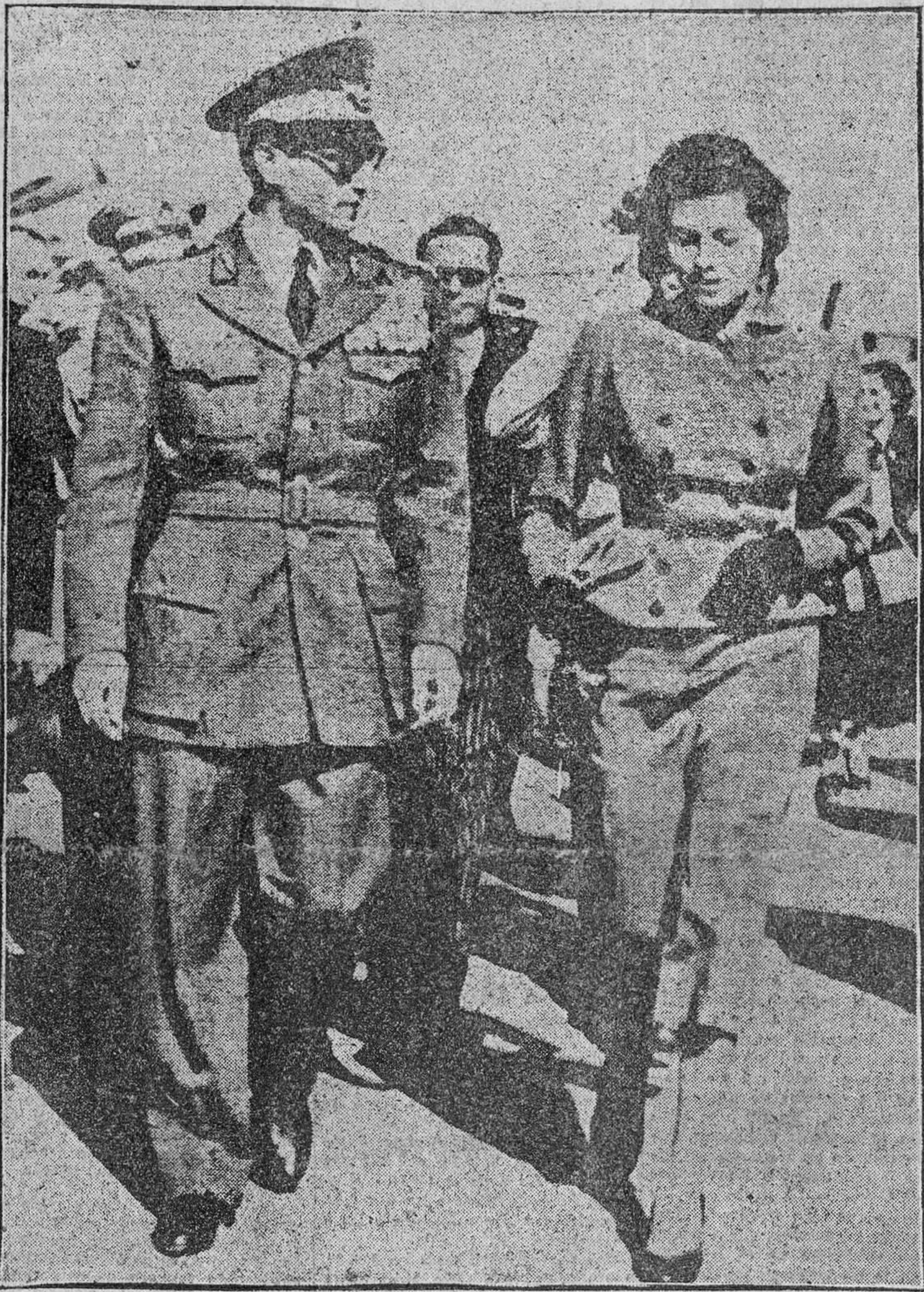
Mohamed Reza Pahlevi, Sha de Persia, con su esposa, la bella reina Soraya, a la que acudió a recibir al aeródromo de Teherán. Soraya volvió al real hogar el pasado día 6, procedente de Roma, donde pasó una temporada coincidente con la consuntiva política por que atravesó el Irán. Restablecido el orden, la reina ha regresado a casa.