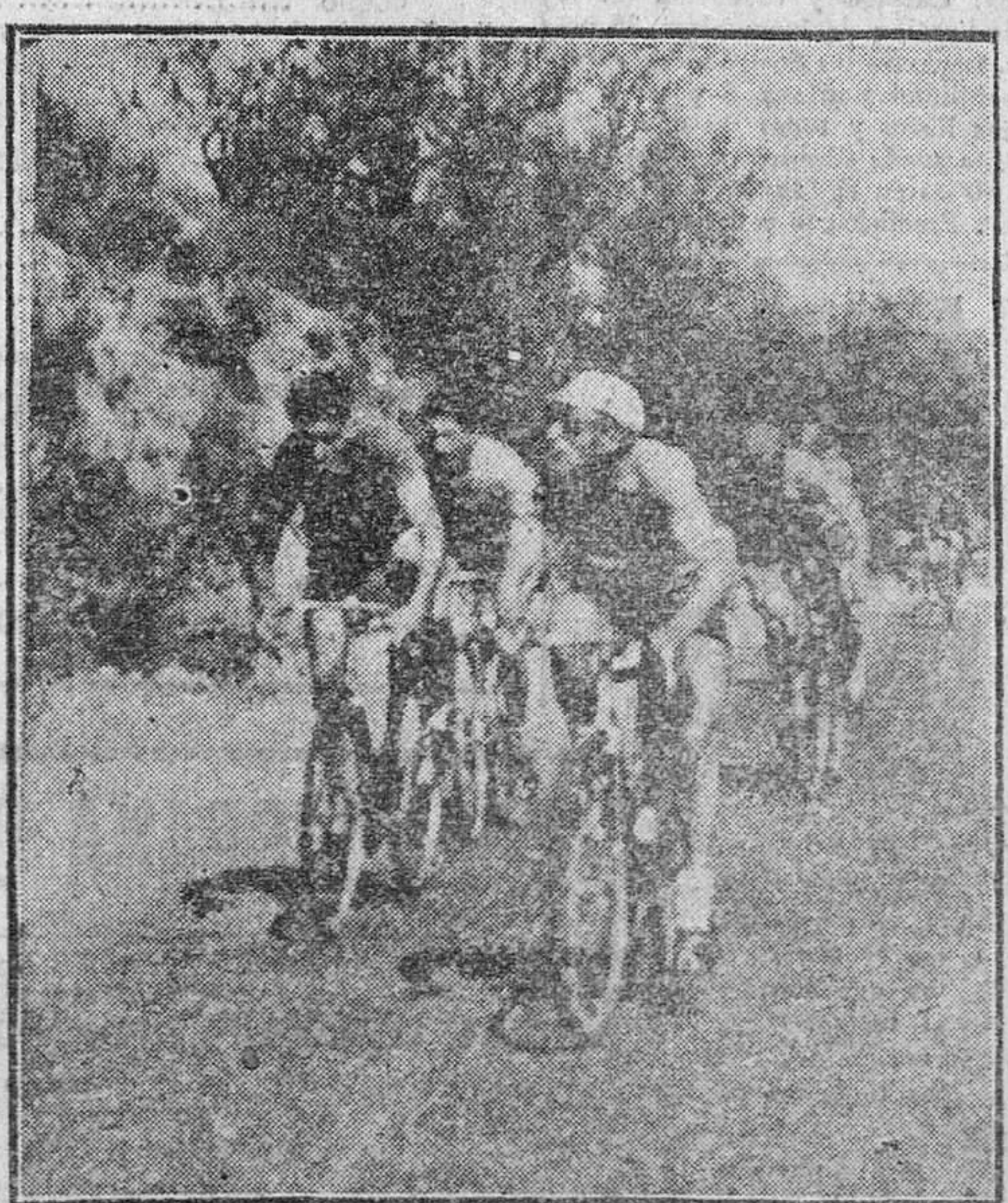
Este que encabeza el grupo es Fausto Coppi, "monstruo" de la bicicleta que acaba de adjudicarse el único gran título que le faltaba por conquistar: el de campeón del mundo de ciclismo en carretera.