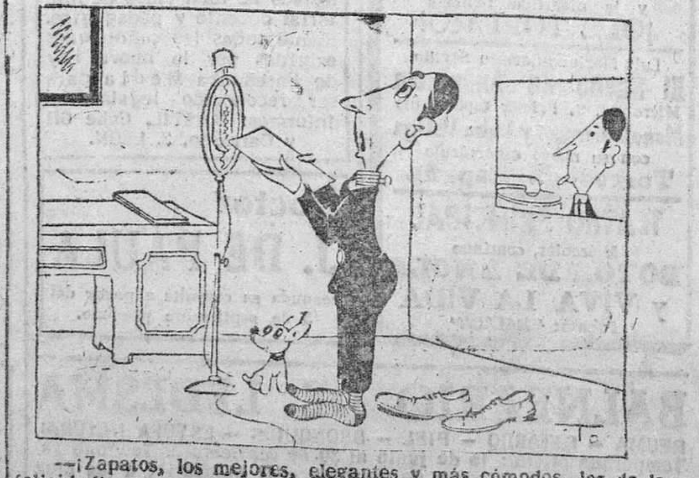
¡Zapatos, los mejores, elegantes y más cómodos, los de la felicidad!