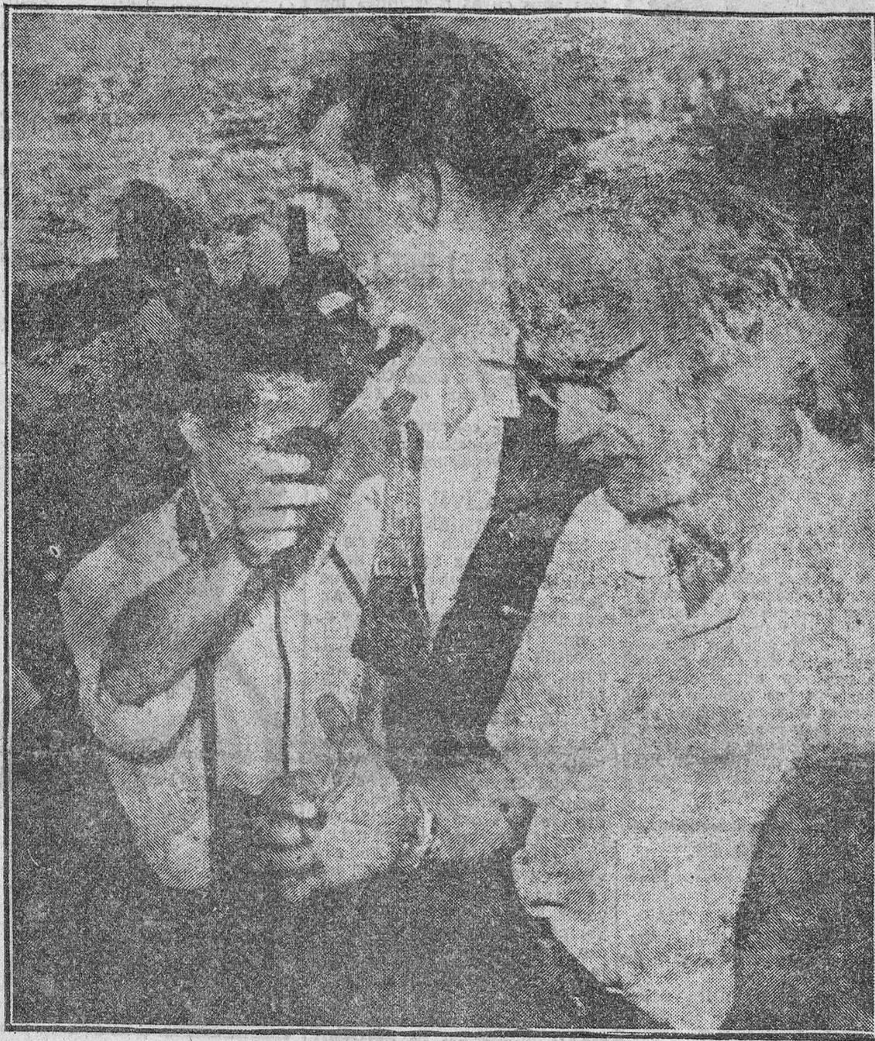
El ingeniero e ingenioso profesor Piccard, con su hijo, satisfechos después de su descensión al abismo del mar en su batiscapo.