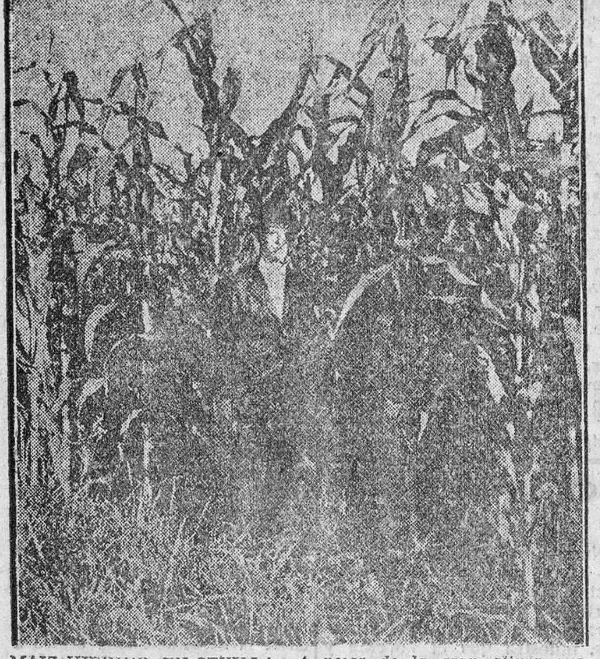
MAIZ HIBRIDO, EN SEVILLA.—A pesar de la gran altura que suelen alcanzar estos híbridos, su tallo fuerte y flexible unido a sus potentes raíces, hacen prácticamente imposible que se tumben o encamen.

Su rendimiento, mediante semillas selectas, puede llegar a 5.000 kilogramos por hectárea