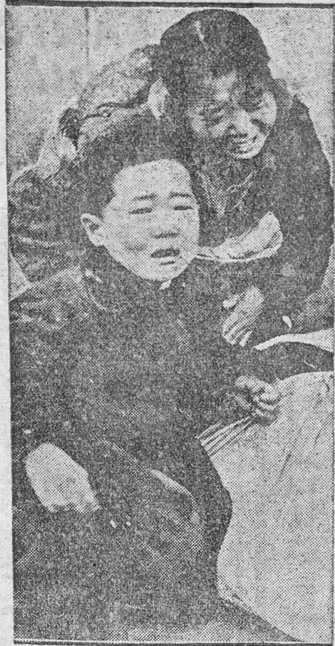
De un rincón al otro del mundo, los políticos, más o menos bien intencionados, aceptan, rechazan o aplazan conferencias. Discuten o hacen hablar a las armas. Y cuando la voz de los que sufren las consecuencias de sus egoísmos o de sus errores se alzan, quedan sorprendidos, como si alguien quisiera perturbar, sin derecho, su estúpido sesteo.

En este caso, he aquí una estampa de Corea, el pueblo que ha sufrido las "pasadas" de unos y otros y se halla sumido en la miseria y en la desesperación.