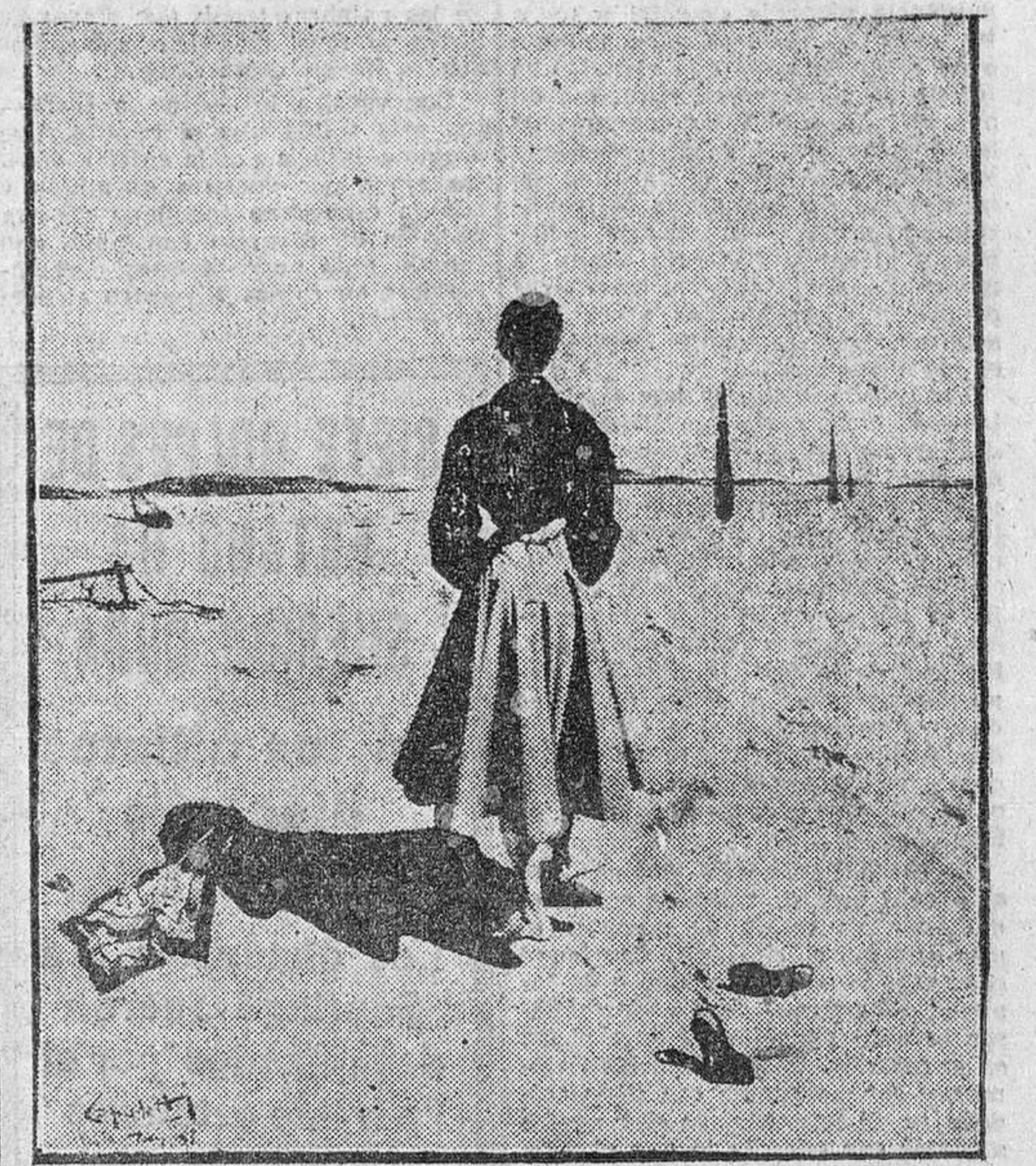
Saint Honoré, esquina a Campos Eliseos. Vendí veintidós; me quedé en uno, es decir, en cuatro, pero sacó llena la cartera mi mujer.

Todo este diálogo transcurre sin dejar de curiosar las fotografías espléndidas que me van alargando los señores de Capuletti. El grabado que reproducimos, "Muchacha paseando por la playa", es característico, y la maravilla del cuadro de donde procede la "foto" demuestra