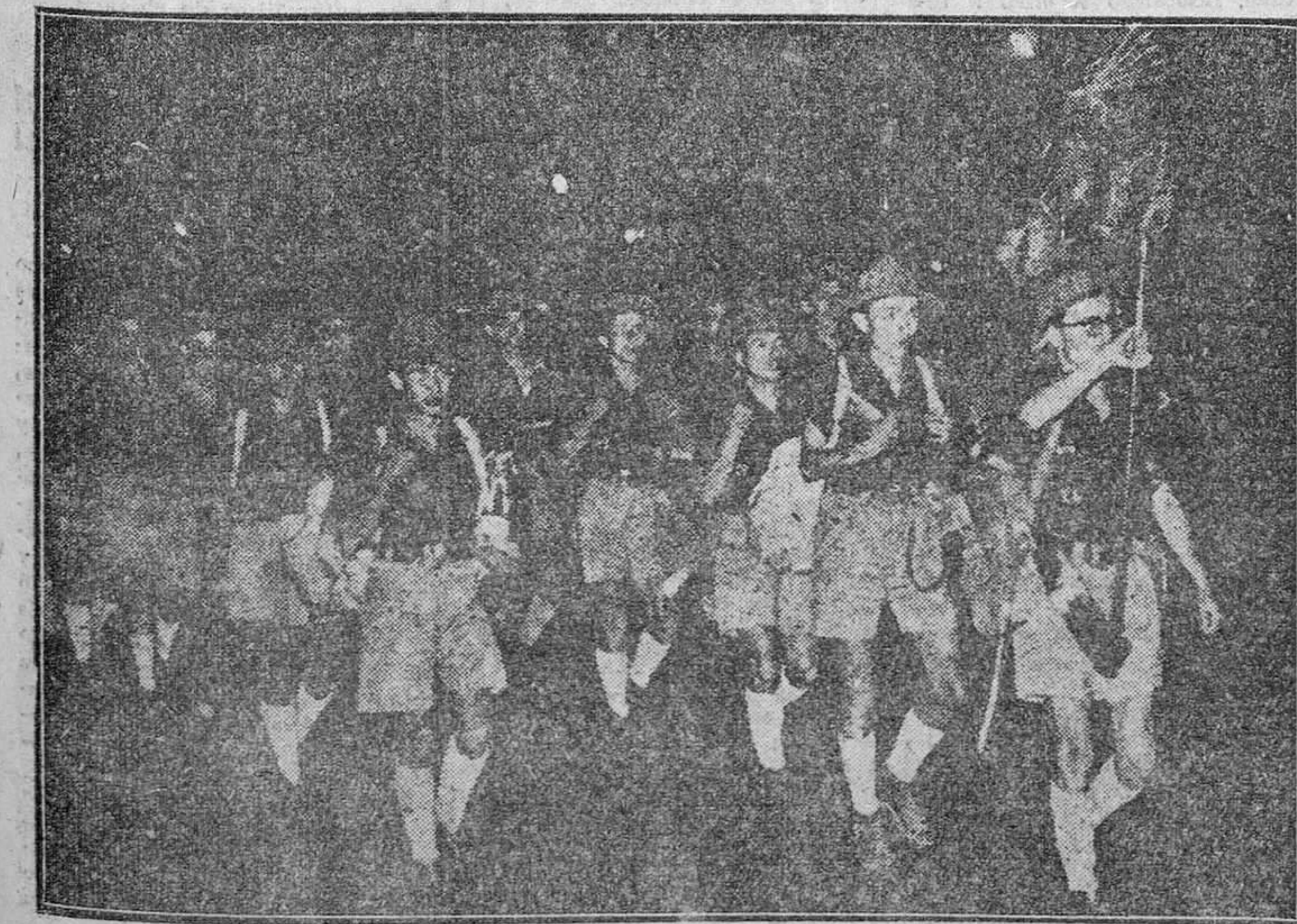
Con la alegría del deber cumplido desfilan por Madrid los camaradas de la Centuria "Gibraltar", después de haber abierto durante su período campamental 200.000 hoyos, en los que serán plantados otros tantos árboles que, al cabo de pocos años, convertirán uno de los paisajes más áridos del cerco madrileño en frondoso lugar de esparcimiento.