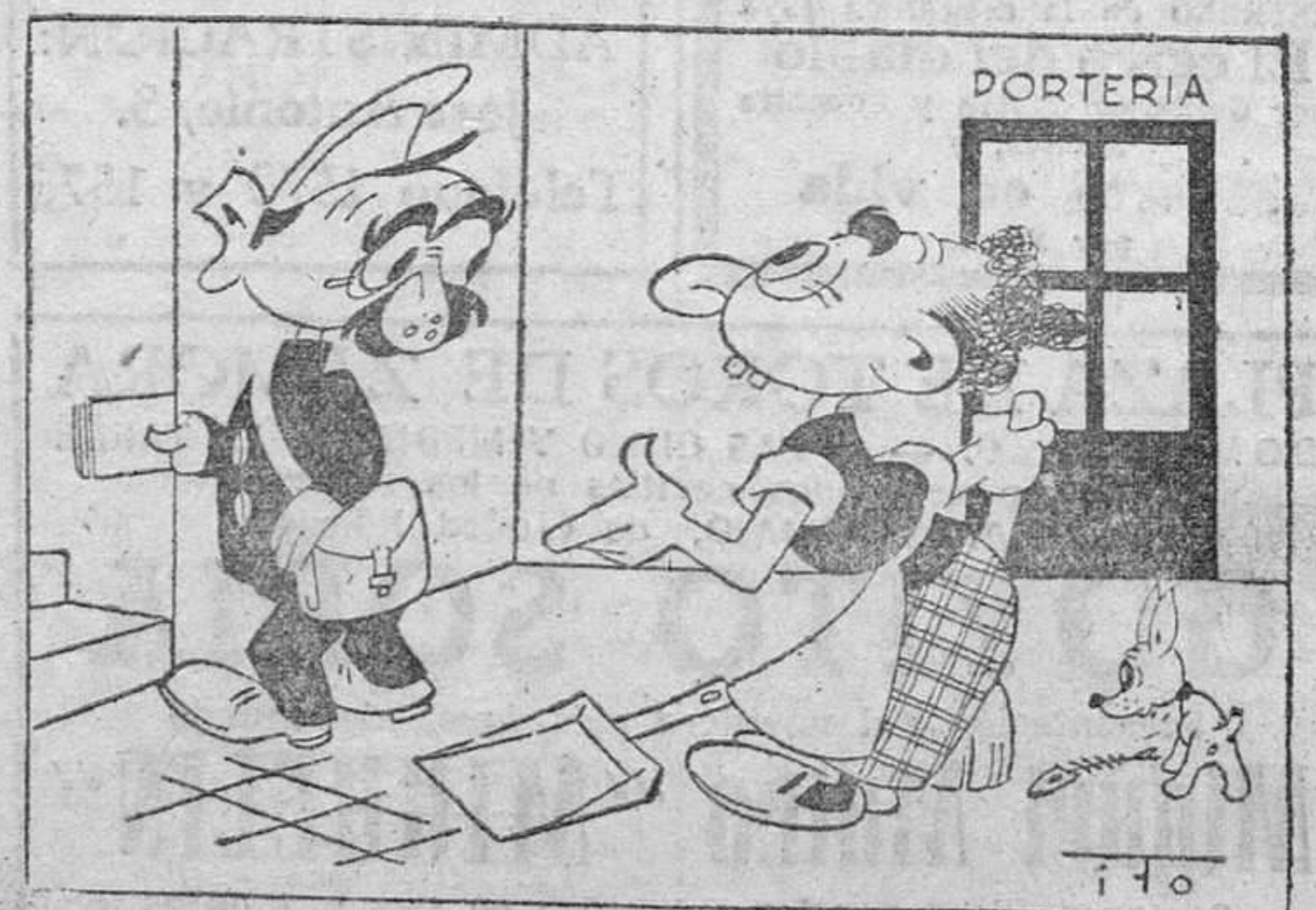
—¿Es para cobrar alguna factura atrasada? —No —Entonces no viven aquí los señores por quien pregunta.