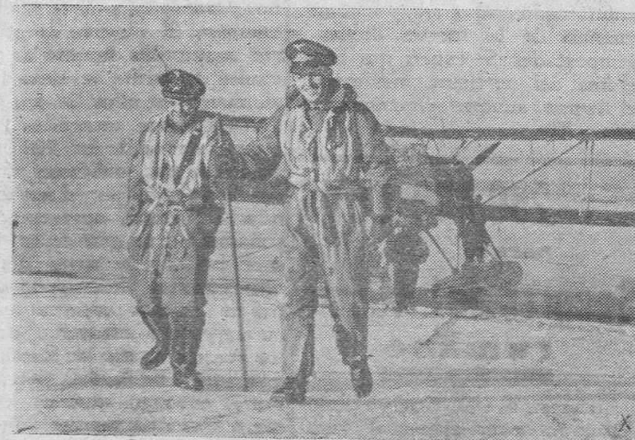
Los tripulantes de un hidroavión alemán, cumplida su misión, regresan con alegría y buen humor.