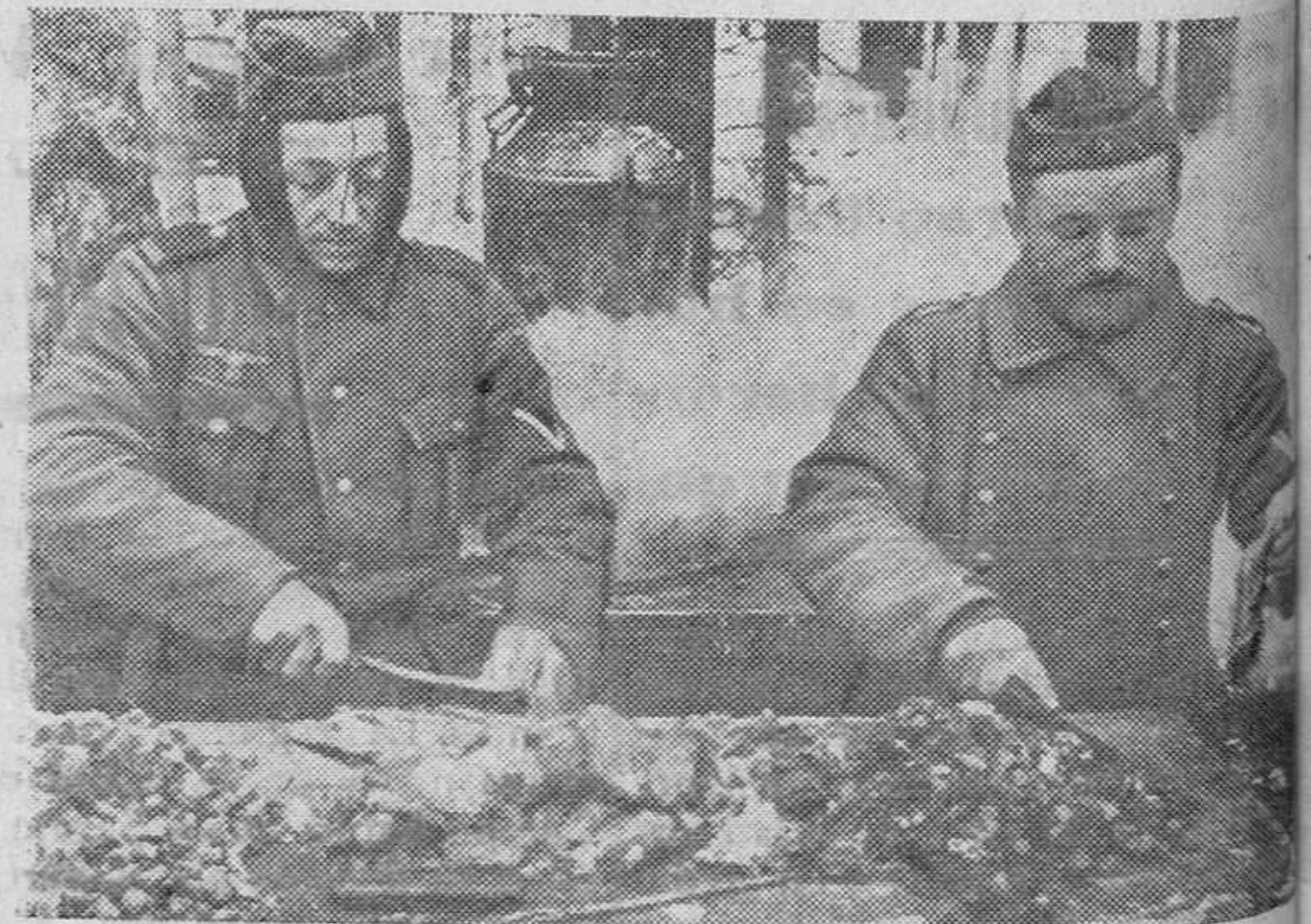
Frecuentemente, las comidas para soldados alemanes del Este se preparan al aire libre, a 15 grados bajo cero.