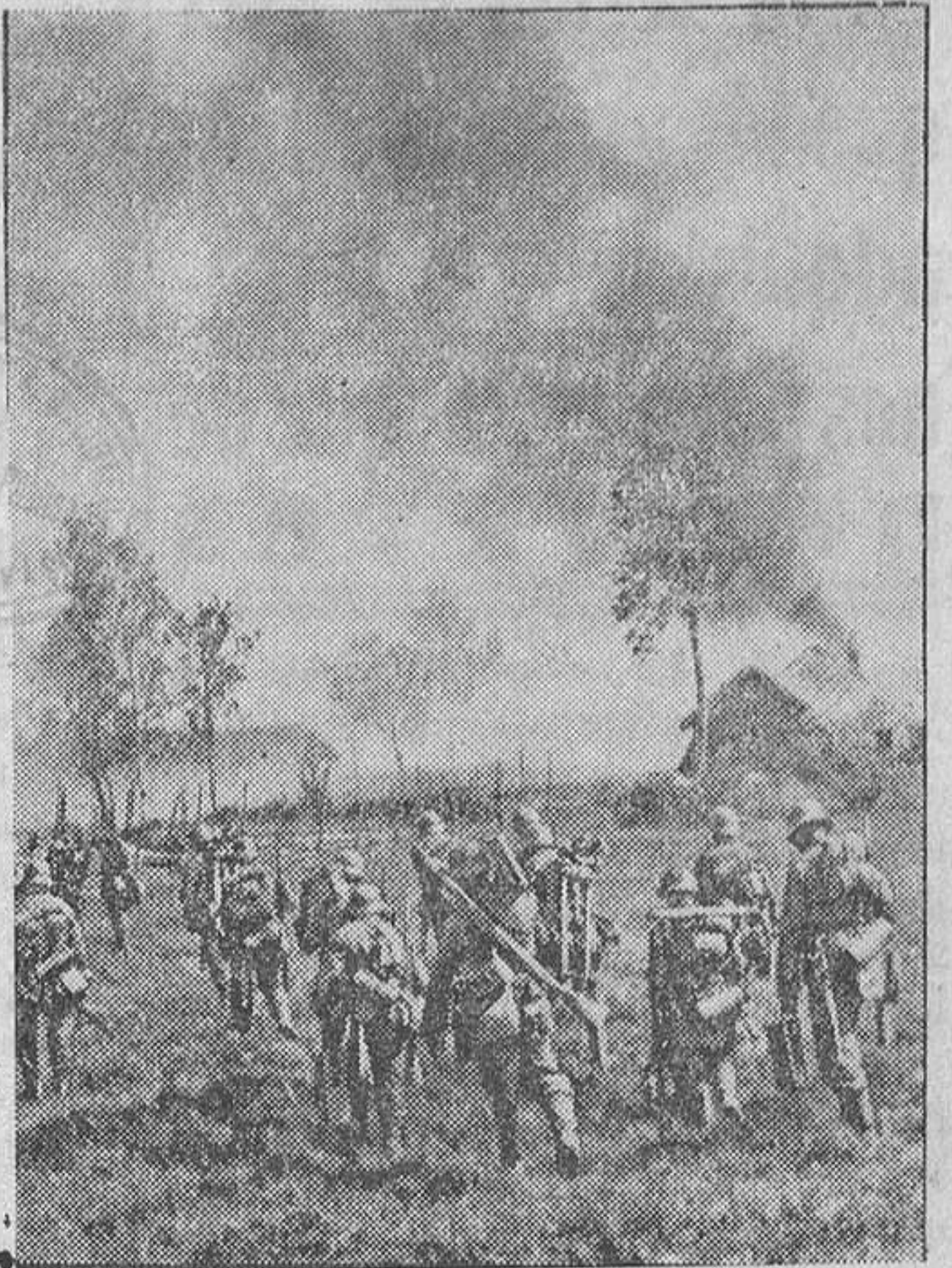
Infantería de choque alemana toma al asalto una posición tenazmente defendida por los rojos

Bilbao, 17.—El barco «Calvo Sotelo», que será botado al agua el día 22, será amadrinado por la hija del protomadrin de la Cruzada.—Cifra.