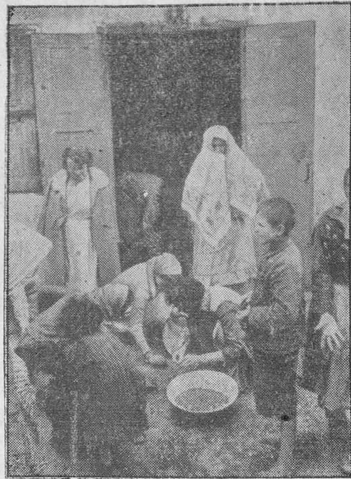
El fracaso de los métodos bolcheviques. Mujeres rusas haciendo acopio en una tienda colectiva asaltada.

años de persecución religiosa no hayan aún olvidado sus rezos, ¿pedirán efectivamente, la salvación de sus asesinos y el mantenimiento de la más terrible tiranía de la historia? Tal vez recen, más bien, por su propia liberación. En fin, todo esto nos lo explicarán los orantes, cuando sus libertadores entren en la ciudad, que ya ven desde lejos. Pero suponiendo que los veintitrés años de dominación soviética hayan conseguido que ahora los rusos recen por el triunfo de su tiranos habría que perdonarles esta aberración, tanto más cuanto que incluso algunos príncipes de la iglesia anglicana, como el deán de Canterbury, con toda su cultura, hacen lo mismo. En fin de cuentas, la mejor prueba del derrumbamiento interno de la doctrina soviética es que sus secuaces, en trance apurado, vuelvan sus ojos a Dios.