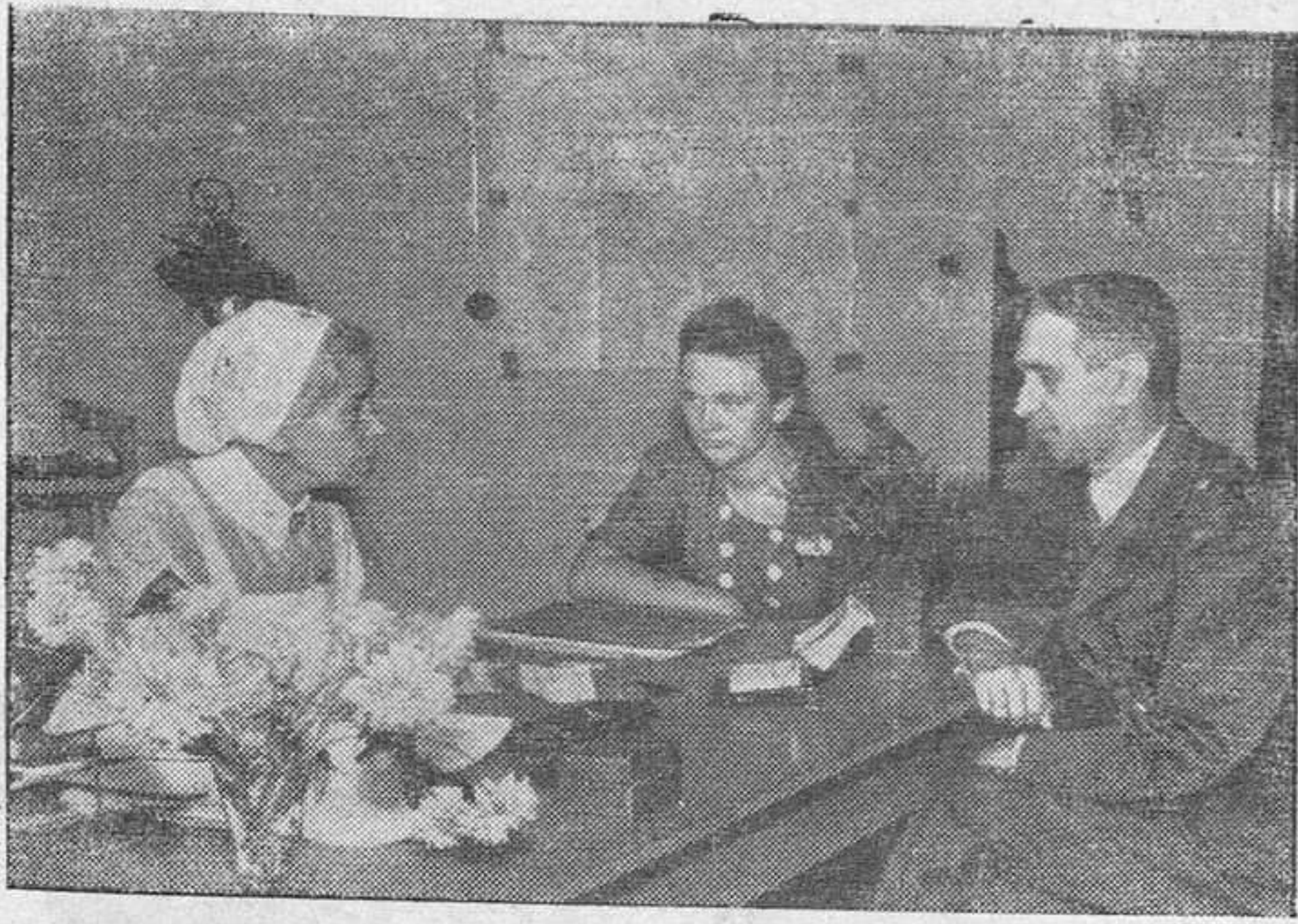
La Cruz Roja Alemana tiene oficinas de información sobre prisioneros, en las que atienden a todo el mundo.