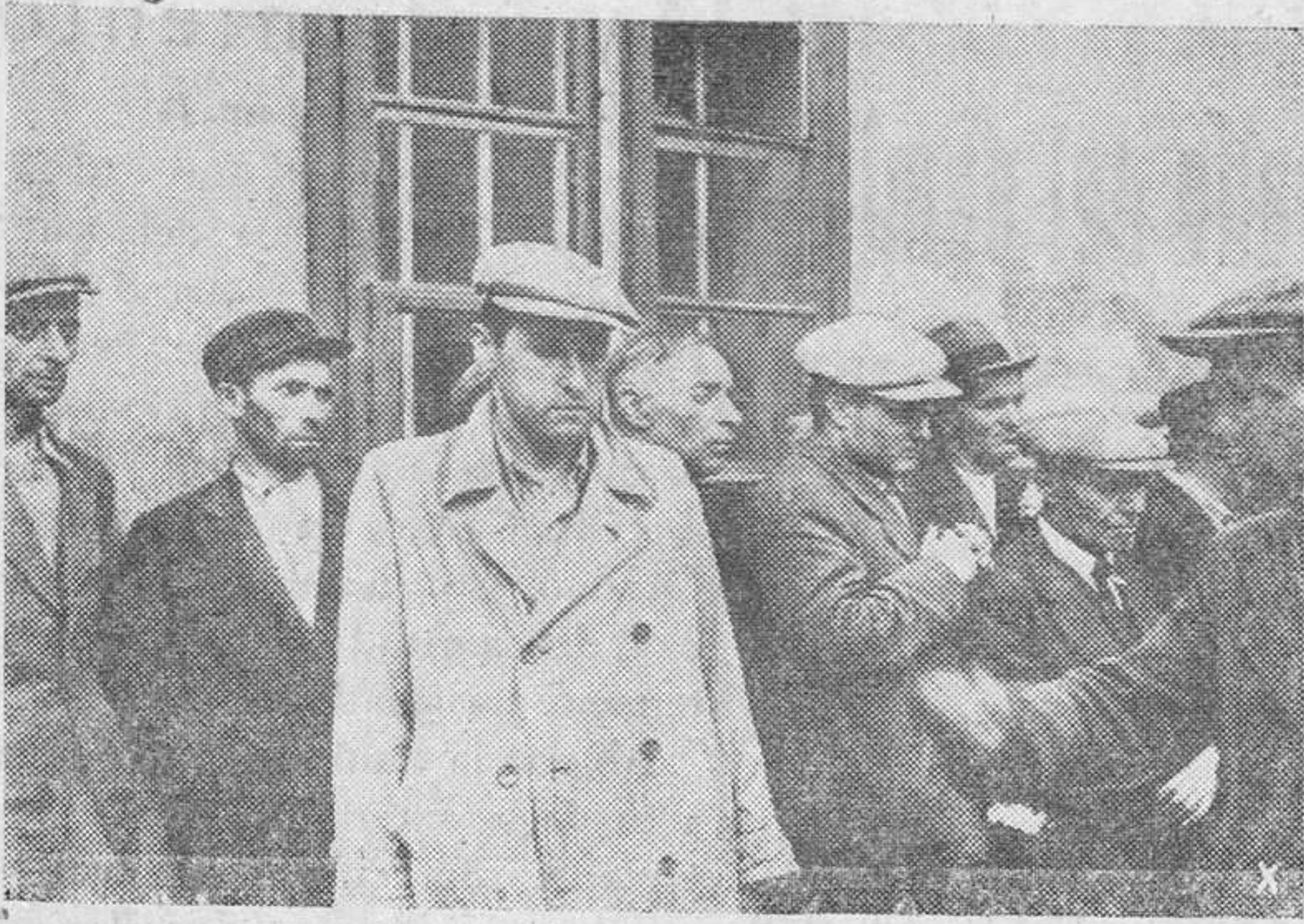
Francotiradores judíos capturados por las tropas alemanas en Rusia.