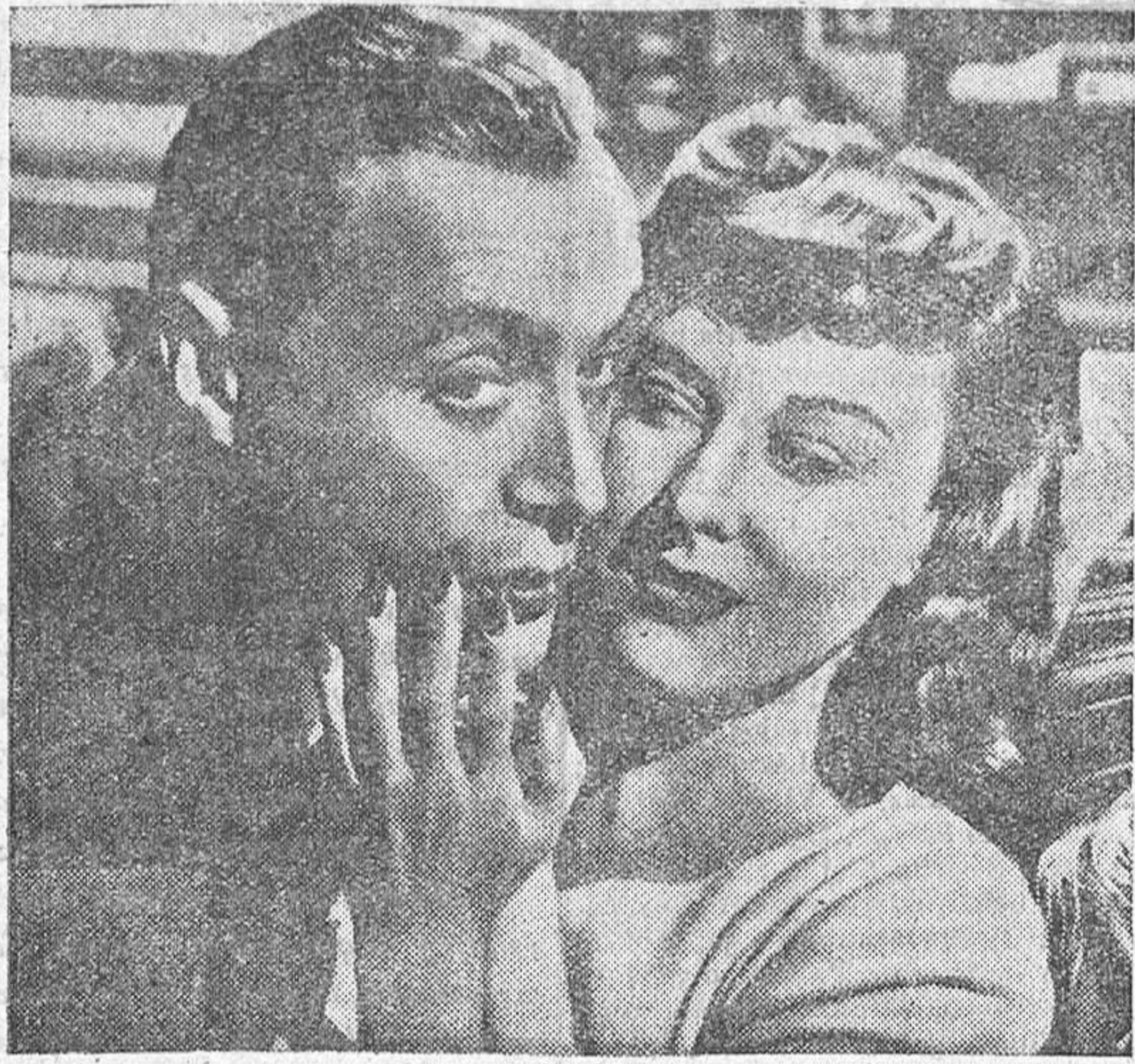
Charles Boyer, el magnífico actor francés que en la película «Al margen de la vida», consigue un gran éxito interpretativo y un gran triunfo como productor asociado del gran realizador Julien Duvivier.

faltan pocos minutos para cumplirse el plazo. Mas también le ha visto Mike a través de los escaparates y entra tras de ella, por la puerta posterior del tenducho. La modista le confiesa que un hombre a quien espera llegará de un momento a otro. Ante la pregunta que el estudiante hace de si significa ese hombre más que él, replica ella: -No, Mike; no es lo que tú te figuras. ¡Déjame!