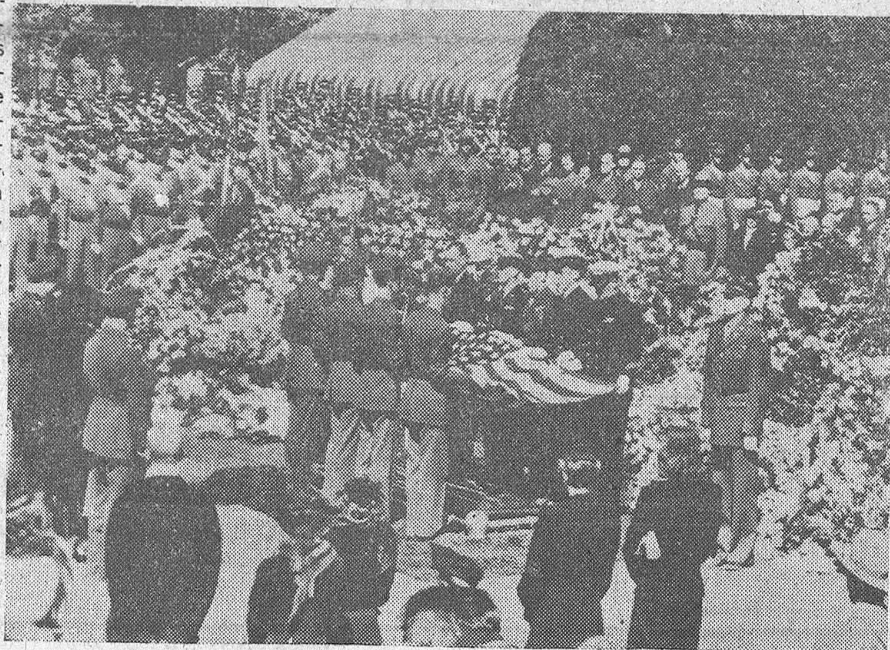
Una fotografía histórica. Los restos mortales del que fué presidente de los Estados Unidos, Franklin D. Roosevelt, reciben sepultura—ahora hace un año en Hyde Park. A la izquierda, la viuda e hijos del finado asisten a la ceremonia. En este mismo lugar Truman rindió ayer homenaje a la memoria del gran hombre de Estado, que no llegó a ver la gran victoria del pueblo norteamericano por la que tanto se esforzó.

La ración de pan en Italia es la más baja del mundo. La Embajada italiana acaba de recibir un mensaje (Sigue en 4.ª página 6.ª columna)