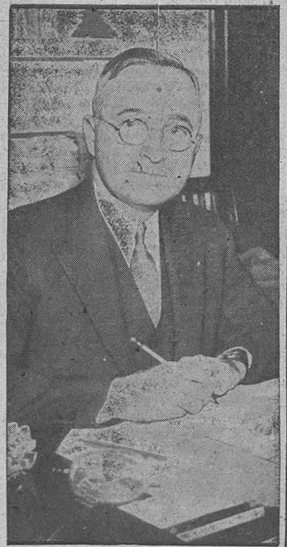
El Presidente Truman

Aunque no todo se fijara en el mensaje Mr. Truman, que últimamente recobró parte de la popularidad que se le iba separando de la mano,