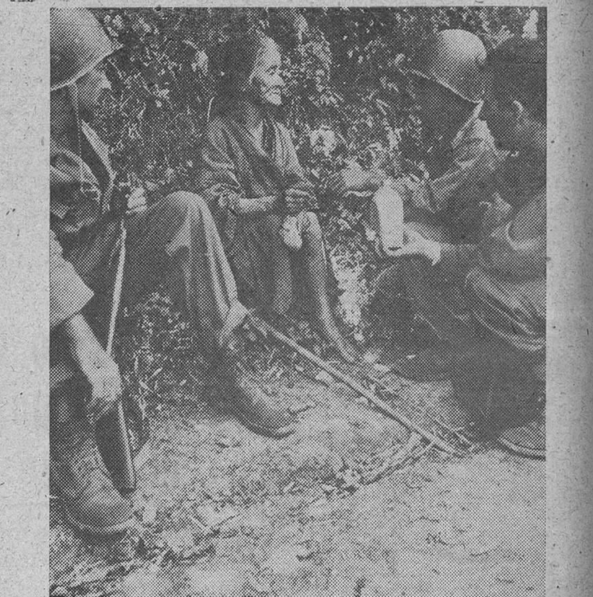
Tres soldados norteamericanos destacados en la isla de Okinawa, atienden a una mujer de 80 años, natural del país y le ofrecen alimentos y agua de sus cantimploras.