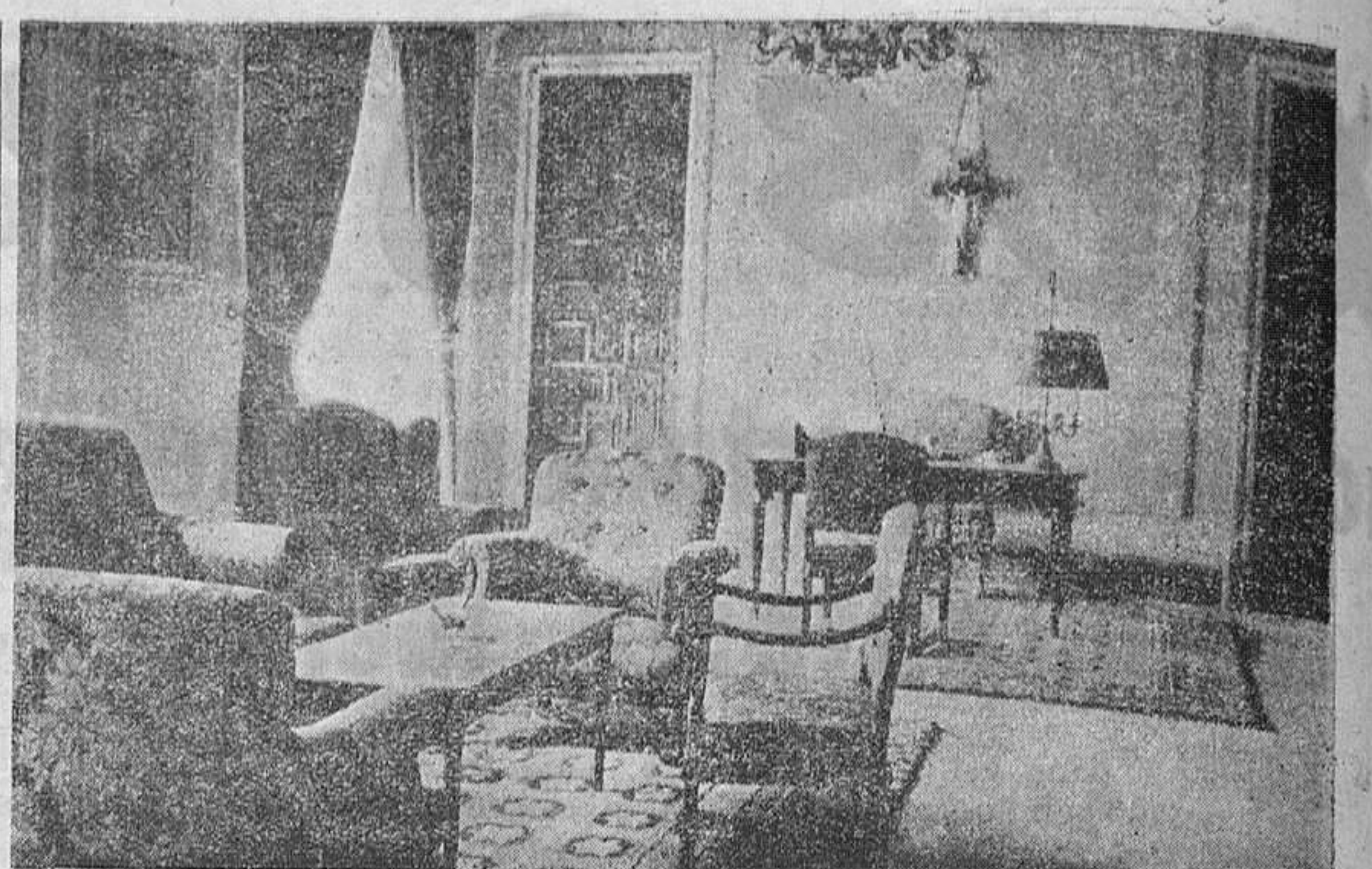
Ofrecemos hoy a nuestros lectores tres fotografías de otras tantas dependencias de la nueva Casa Consistorial. La primera corresponde al Salón de Sesiones en la que se recoge la mesa presidencial y los sillones de los concejales. La del centro nos traslada a la Sala de Comisiones con su mesa octogonal. En la tercera presentamos el despacho de recepciones, en cuyos butacones puede sentarse usted mismo cuando vaya a visitar al señor alcalde.