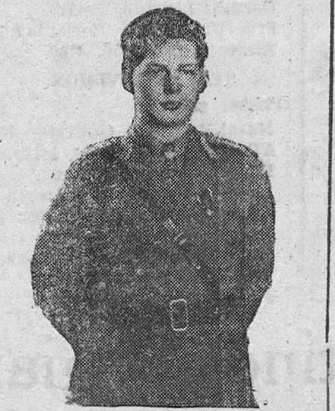
MIGUEL DE RUMANIA

Sin embargo, justo es reconocer que si el oficio de Rey no es un buen oficio, aún no ha llegado este hasta el extremo de hacer números para "ir tirando". Claro que aquellas astronómicas pensiones de que antaño disfrutaban, se han visto reducidas al compás "in crescendo" del coste de vida, agravadas al no poder prescindir de sus viajes reñam-pagos y gastos de séquito, ese séquito real que es como la espuma eternamente prendida de la popa del barco, o como los puntos suspensivos detrás de una frase con intriga... De ahí que muchos monarcas y miembros reales exiliados se vean en la precisión de recurrir a un trabajo remunerado para cubrir sus necesidades. El duque de Windsor—antes Eduardo VIII por la gracia Dios—, hoy simple duque por el hechizo de misteres Simpson, se halla escribiendo sus Memorias para ser publicadas en una revista norteamericana. Así, podrá seguir poseyendo la menguada riqueza de que disfruta actualmente: un hotelito en la parisina calle de Falsanderie; un "Citroen", un "Cadillac", y sobre todo, la conciencia limpia de todo remordimiento... aunque no es sensato suponer que habrá añorado alguna vez el rango de que disfrutó hasta el mismo día 14 de diciembre de 1936? En aquella fecha, diciendo un adios despreocupado a sus preocupados, e incluso escandalizados familiares y cortesanos, se colgó del brazo de una hermosa dama y se fue a correr, con ella, la magna aventura del Rey que no quiso serlo.