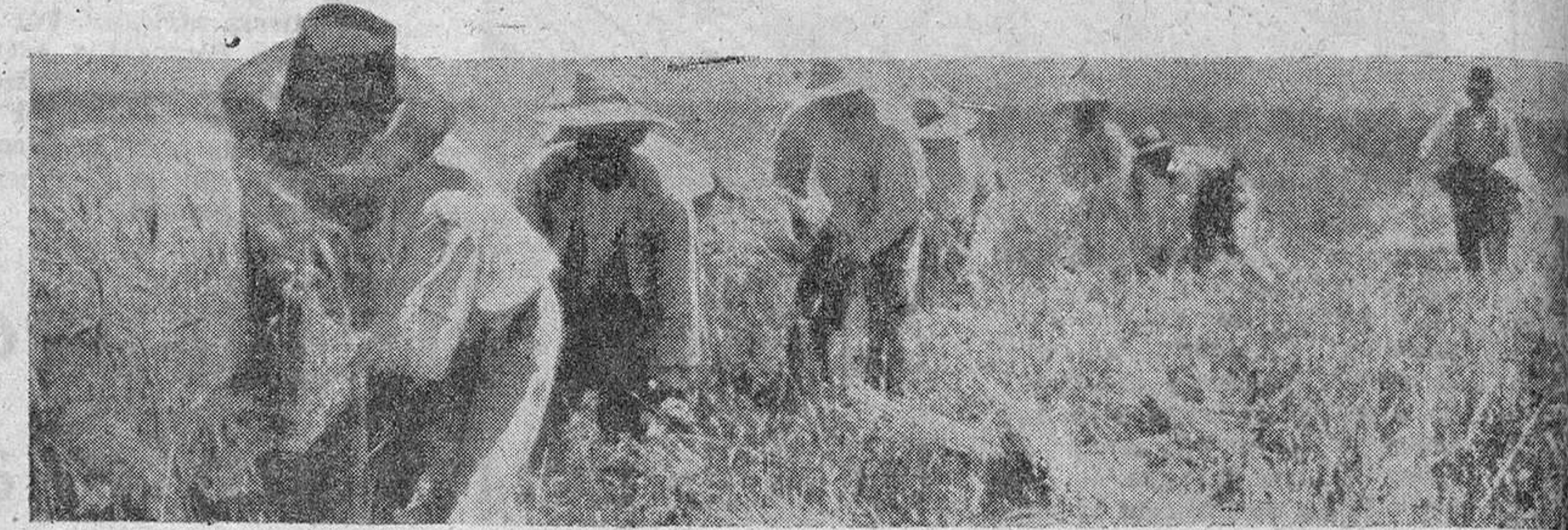
Trigo, Oro de España. Esta es la auténtica riqueza de la Patria.

No podemos decir que en la foto estén representados los tres reinos de la naturaleza; ella, si bien es verdad que admite comparación ventajosa con las bellas flores del más bello edén, se dedica sin embargo, a funciones que nada tienen que ver con la vida vegetativa; por pistas tersas de duro cemento se desliza suave, graciosa y veloz sobre ruedas. La foto nos asegura que la chica acaba de patinar; y, no debió irle mal el patinaje, pues, si parece cansada, también se muestra satisfecha. Pero patinar no es función vegetativa ni está incluida en aquella que los antiguos significaban con «Sus labores». Aquellas labores propias del sexo débil—guisar, coser...—tampoco eran vegetativas, pero permitían a los hombres vegetar. Ahora, por mucho y bien que patinen nuestras dulces enemigas tendremos los hombres que vegetar por los propios medios. El perro es un filósofo. Lanzamos esta afirmación recelando que el perro nos enseñe los dientes. Pero está más concentrado en sí mismo que el filósofo Koenigsberg. Mira sin ver las