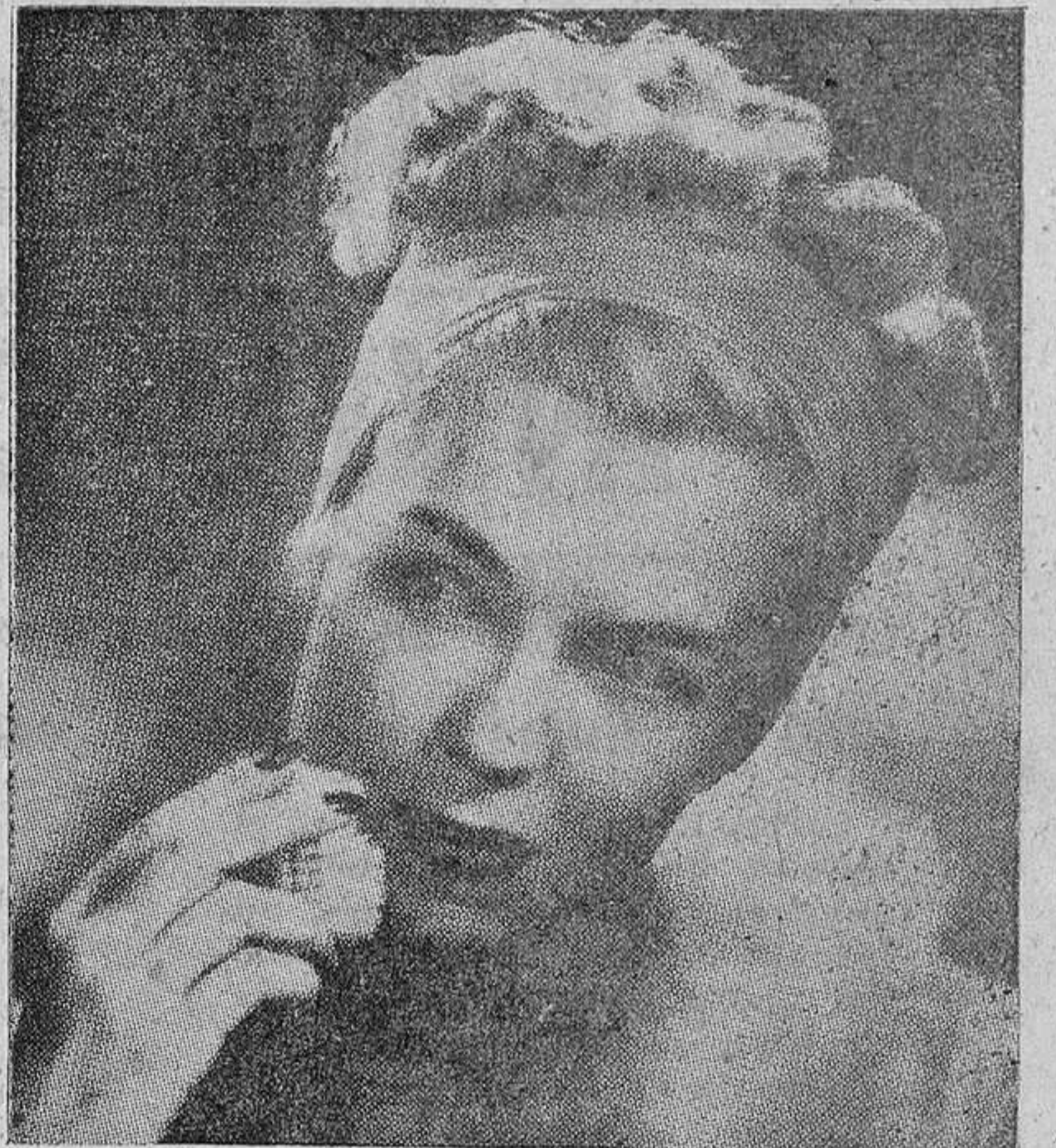
Una vez al día haga usted una limpieza verdadera de la piel utilizando el cepillo del cutis

El baño diario es un maravilloso cosmético, contribuya a hacer funcionar normalmente la superficie entera del cuerpo, como órgano de eliminación. Bebed agua en gran cantidad, especialmente si tenéis la piel seca. Si el cutis es cetrino, tomad jugo de tomate o limonada sin