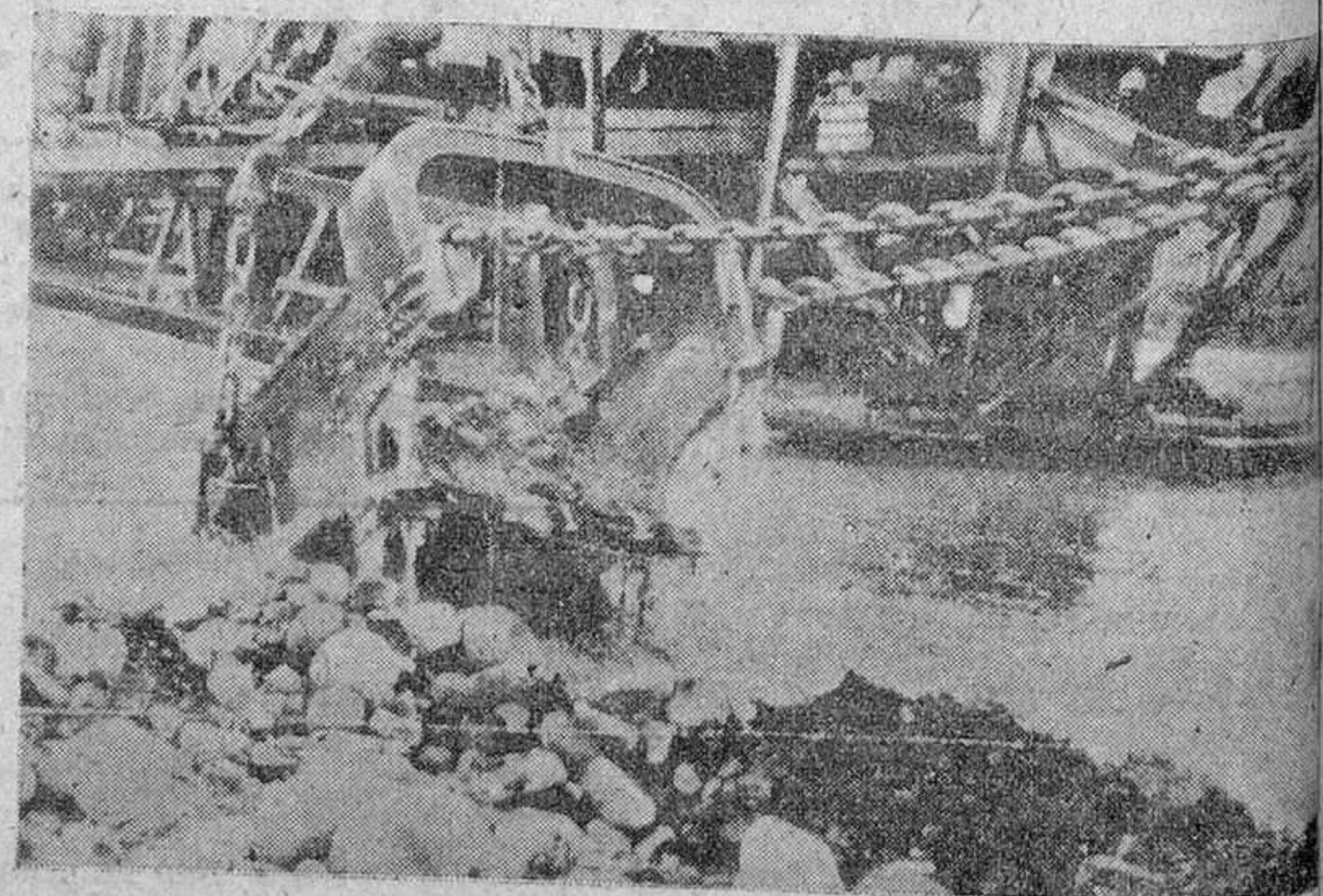
El caso de la excavadora en pleno funcionamiento.