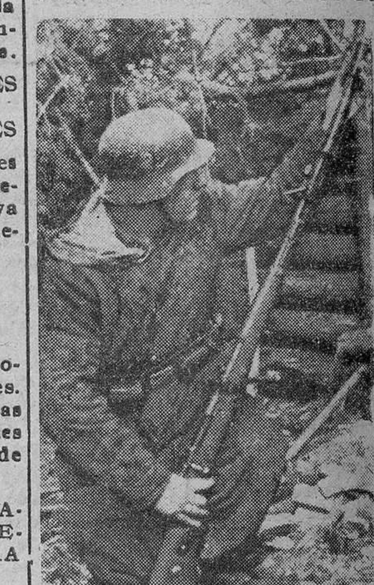
Voluntarios alemanes de la S. S. montan las granadas de fusil para batir las posiciones rusas situadas a pocos más de cien metros de la línea avanzada germana.