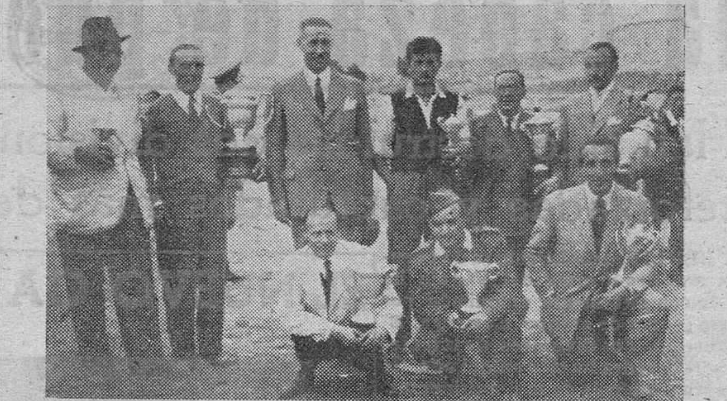
Nuestra primera autoridad civil y jerarquía falangista, camarada Fernández-Vila, rodeado de los vencedores en las distintas pruebas del Concurso de Tiro de Pichón, celebrado en Zamora en la pasada feria.