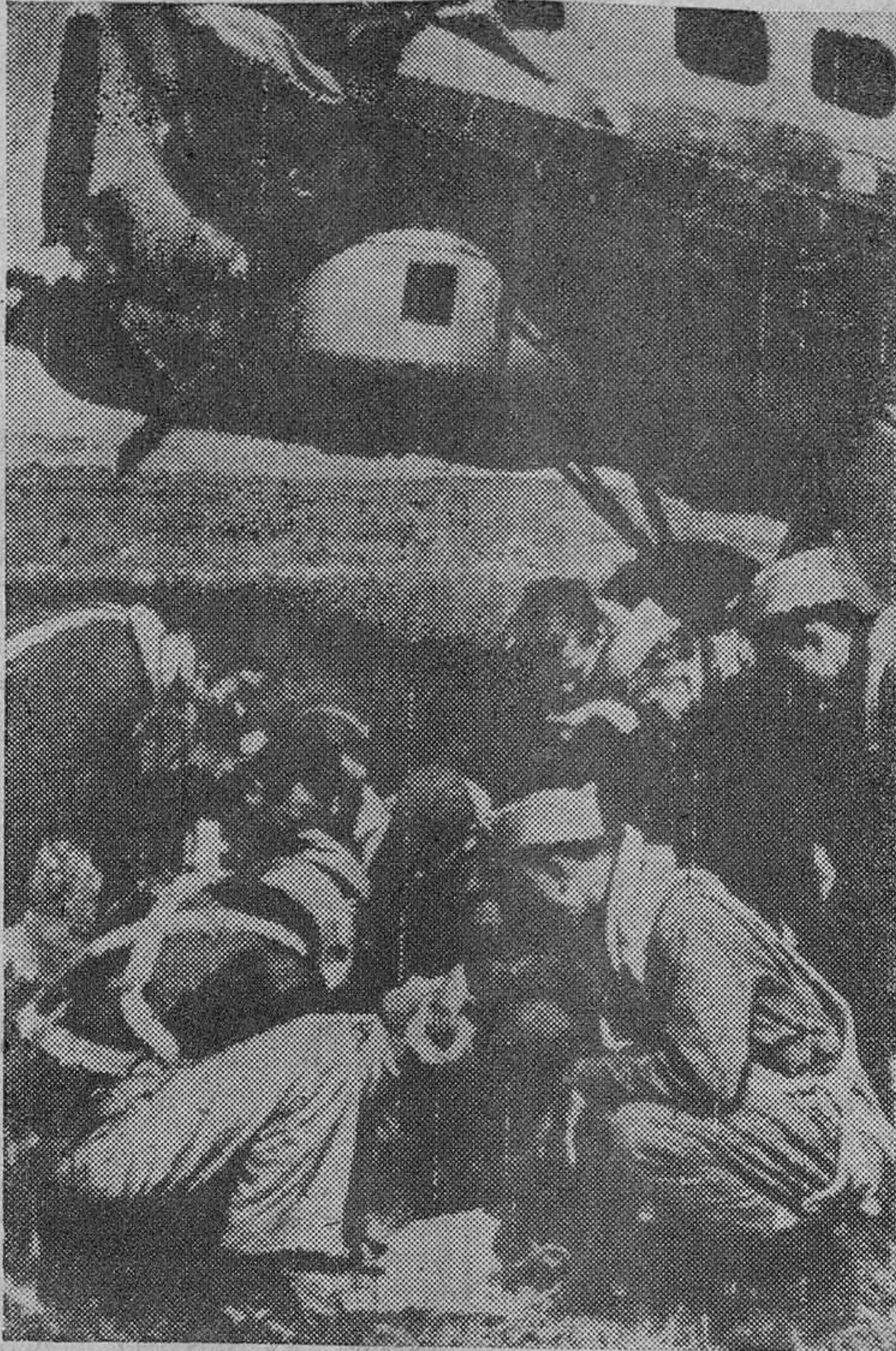
Aviadores norteamericanos, con base en Rusia, reciben las instrucciones para llevar a cabo una misión de bombardeo sobre los objetivos alemanes (Foto recibida por radio)