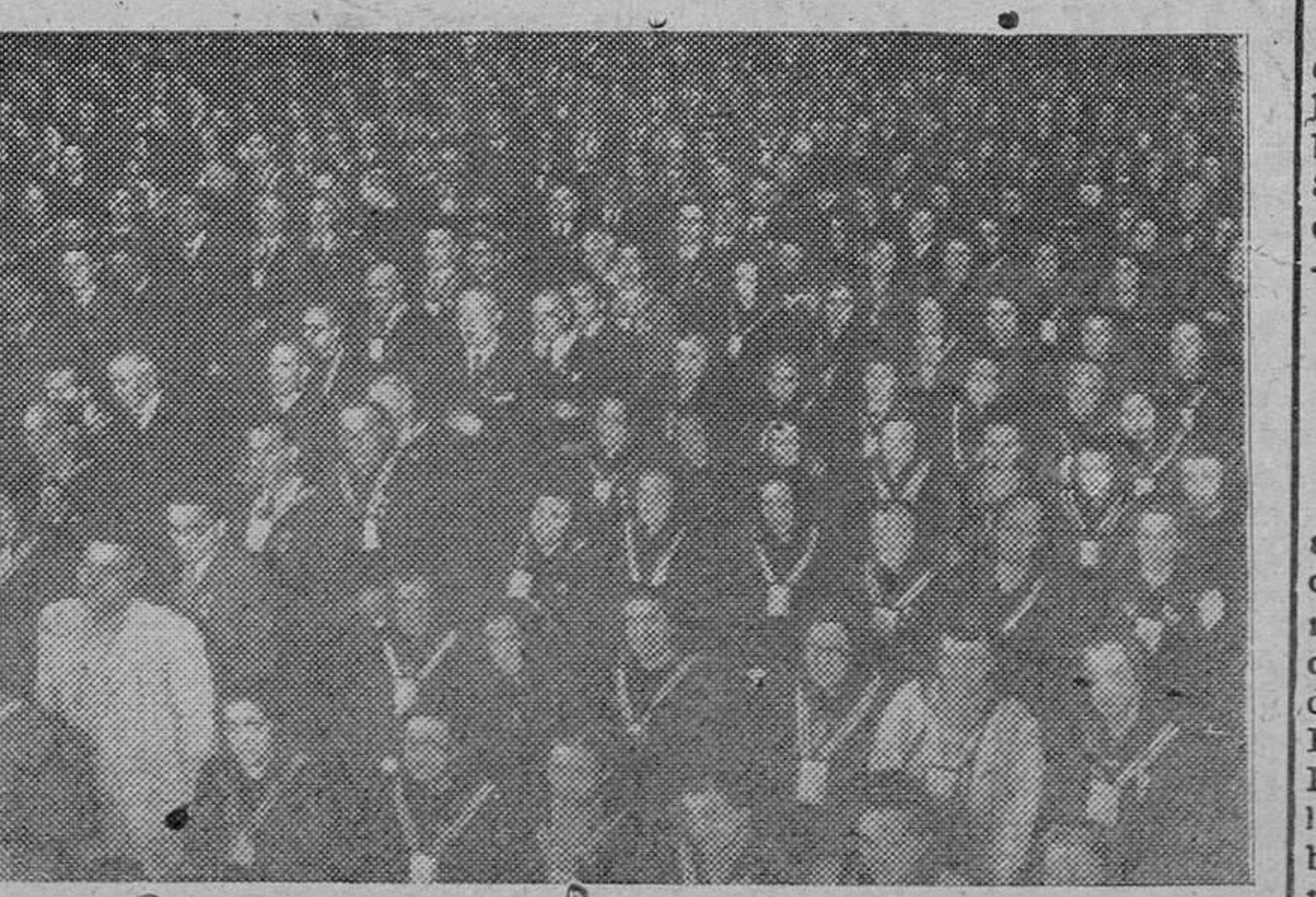
Un aspecto de la nave central de San Benito el Real de Valladolid durante la conferencia del Doctor Cortés Grau, durante la segunda sesión del día correspondiente al Primer Congreso Hispano-Portugués de la Venerable Orden Tercera. (S.O.F.)