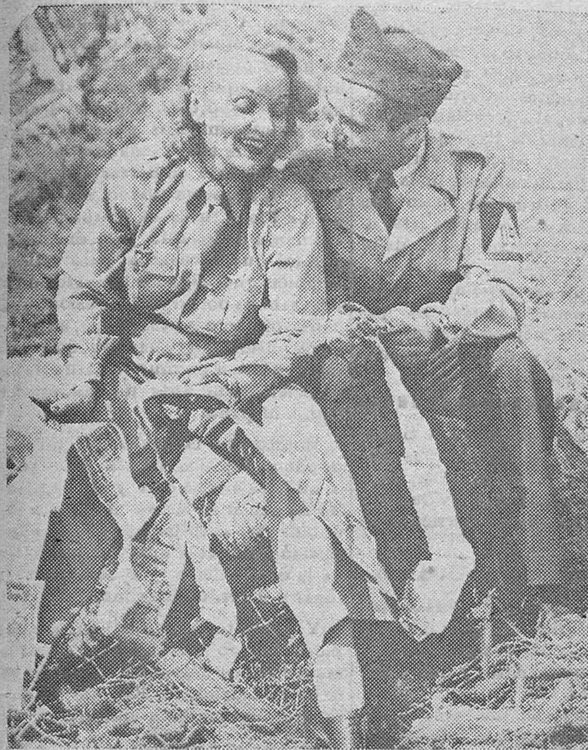
Marlene Dietrich, actriz cinematográfica norteamericana, de origen alemán, e Irving Berlin, compositor norteamericano, durante un trabajo de preparación de un programa especial destinado a una estación móvil de radio en algún lugar de Italia

Aquella que dice: «Oh cielo azul de Virginia...»