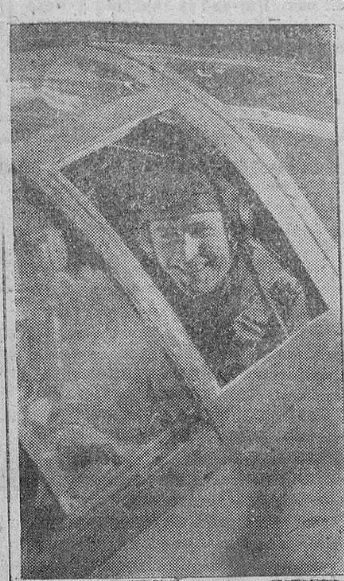
Desde la carlinga del aparato los aviadores que parten en vuelo nocturno se despiden de sus camaradas con una sonrisa de optimismo.