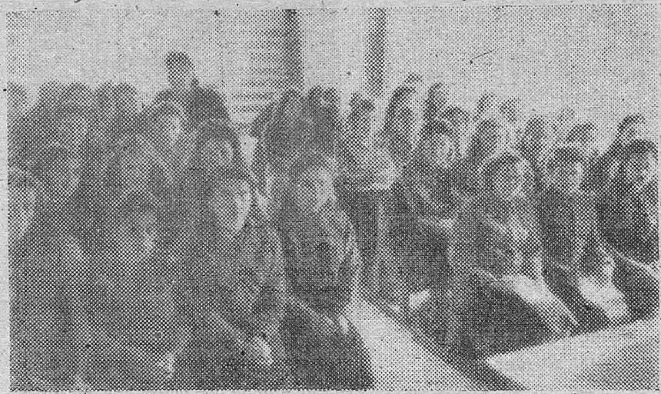
Las camaradas delegadas locales que asistieron al Primer Consejo Provincial de la Sección Femenina que se ha celebrado en nuestra capital desde el día 7 al 14 de noviembre, reunidas para escuchar una conferencia de Organización.