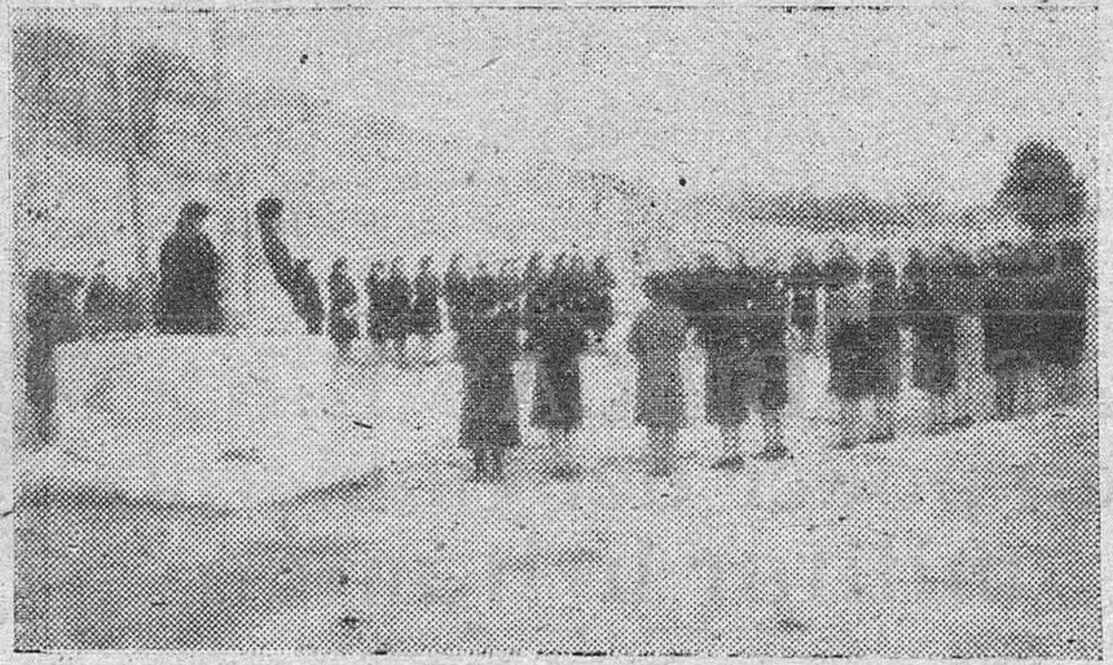
Las delegadas locales rezando las oraciones de la mañana el día de la inauguración del Consejo y en el momento de izar banderas.