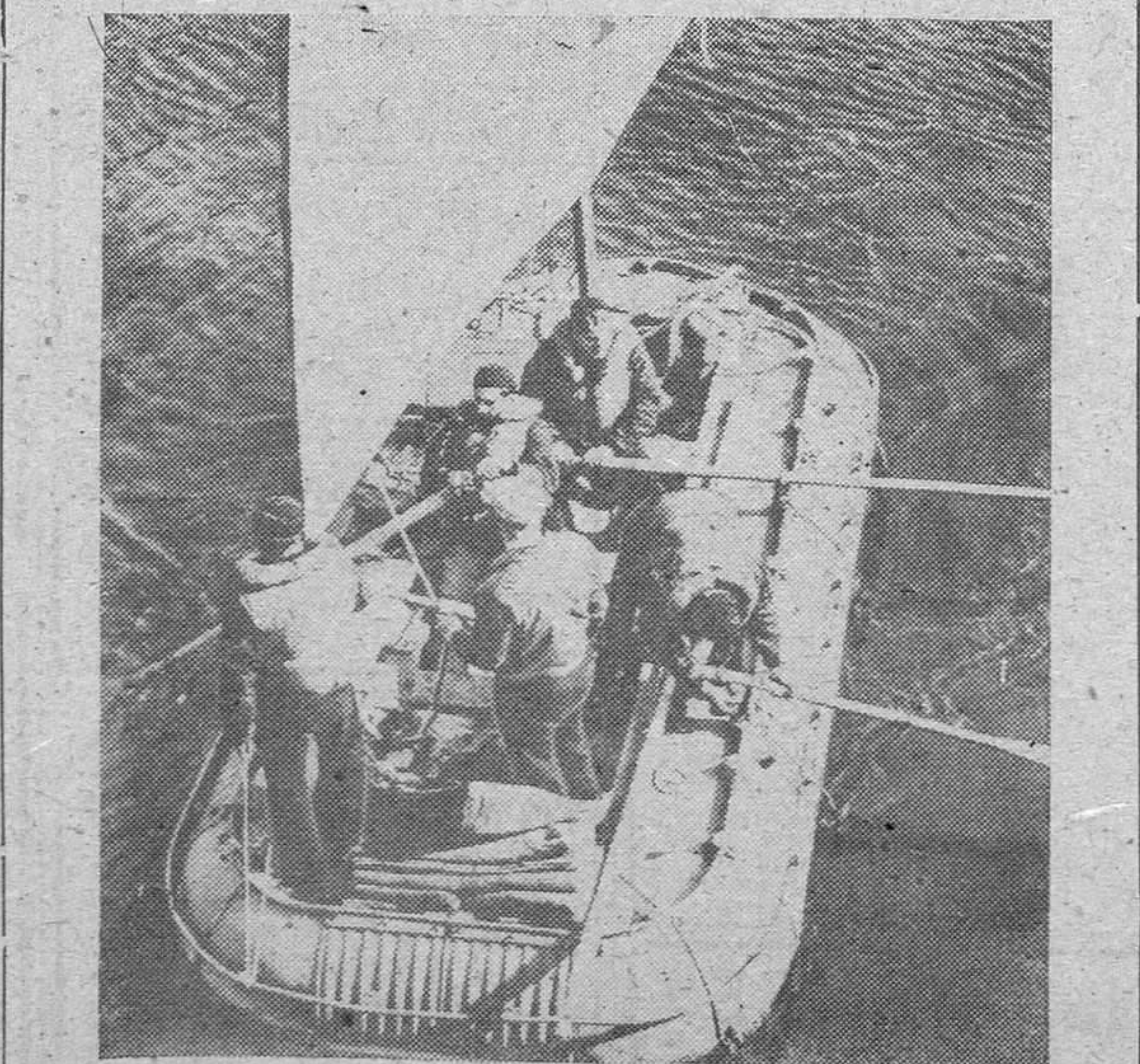
Una nueva demostración de la nueva lancha salvavidas. Tiene cabida para 20 hombres, es toda metálica, contiene una estufa de carbón para calefacción o cocina, viveres y agua para un mes, una caperuza de protección contra la lluvia e viento, cojines impermeables y mantas