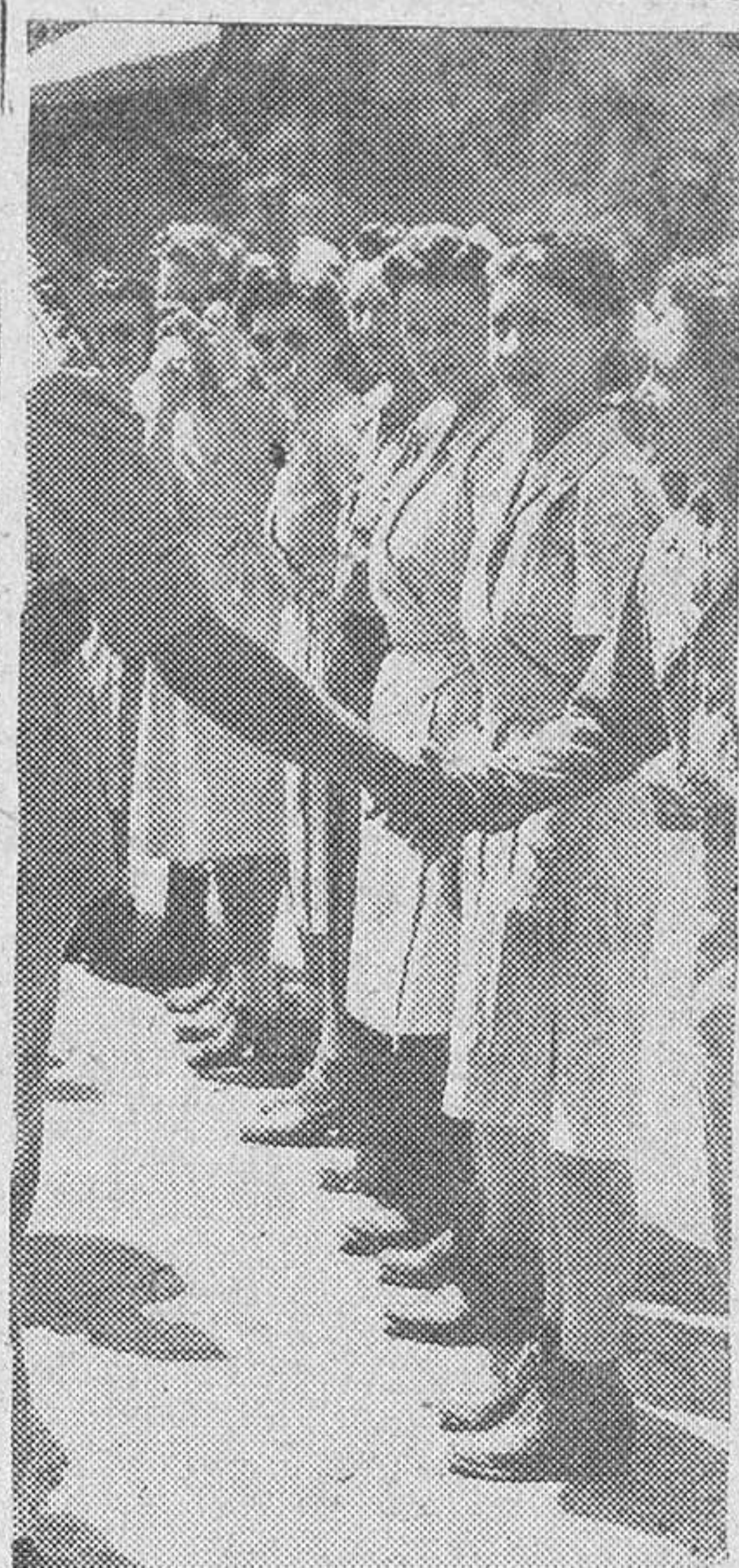
El almirante inglés lord Louis Mountbatter, saluda a las enfermeras americanas en un hospital del Lejano Oriente