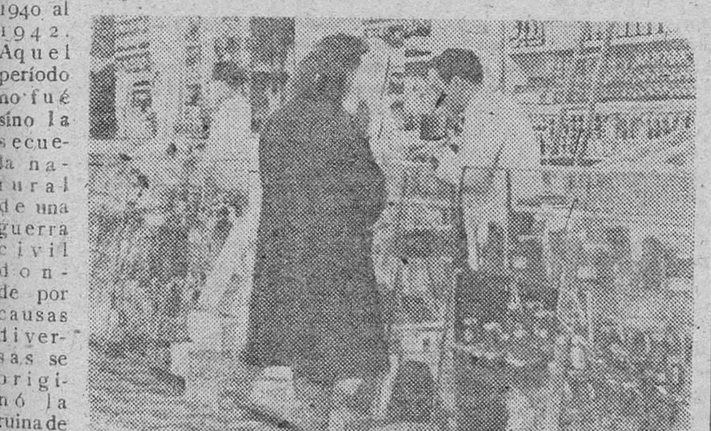
Los establecimientos de comestibles conocieron en otras fechas la soledad de los estantes vacíos y las vitrinas desocupadas. Hoy de nuevo vuelven a ofrecerse al público repeltes de artículos no sometidos a racionamiento.