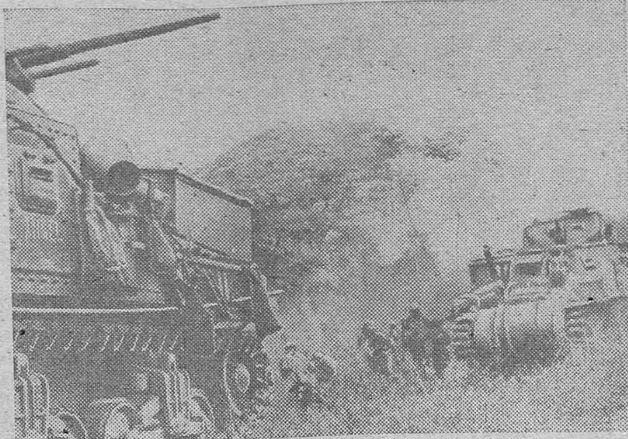
Tanques e infantería británicos avanzan contra los japoneses en el frente birmano, durante las recientes operaciones.

LONDRES, 25.—A su llegada a Londres en avión Atlee manifestó que ignora el tiempo que estará en Londres.—Efe.