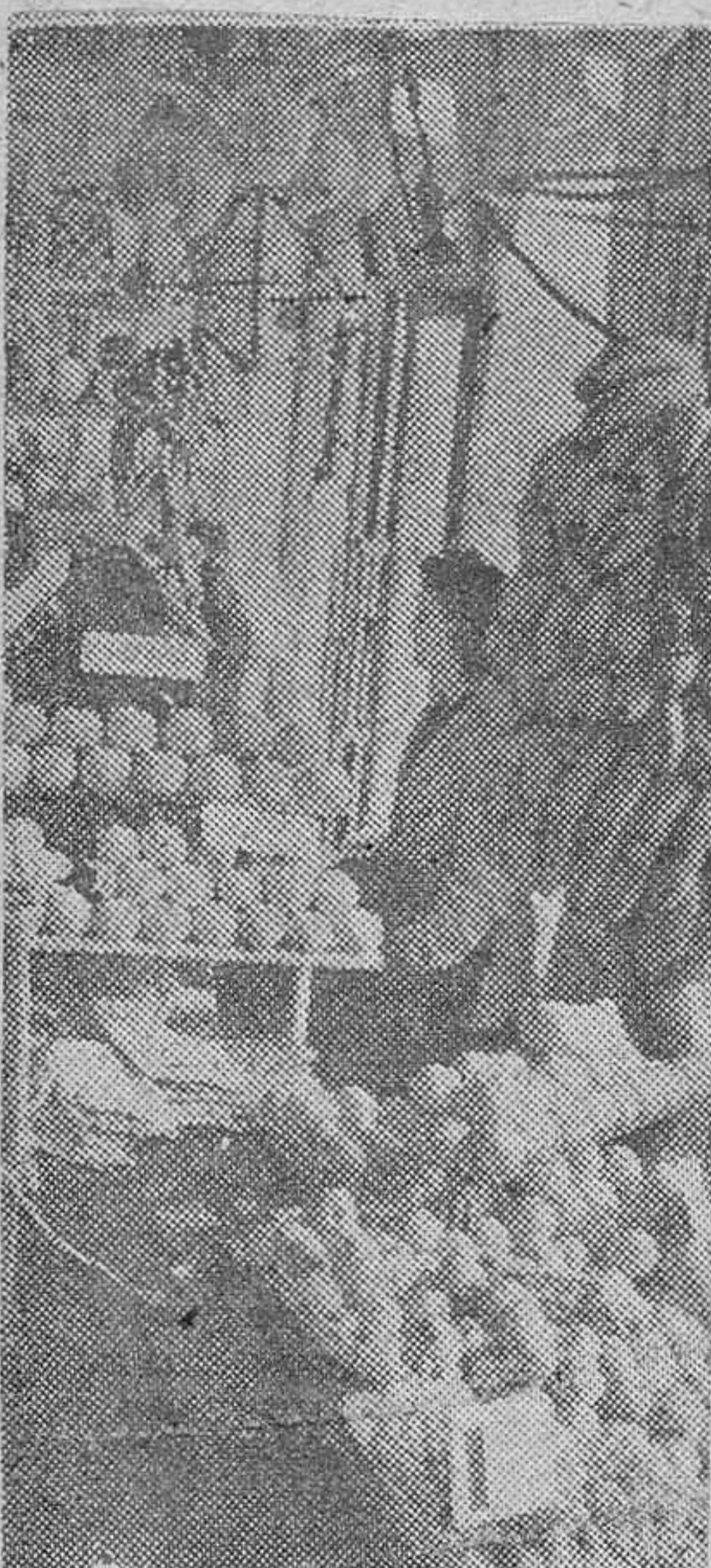
La variedad frutera de España se ofrece al público libre de intervención y así las fruterías, en esta época, rebosan de productos del campo a disposición de los consumidores sin cartapisa ninguna.

La libertad, así entendida, implica posibilidad de actuar siguiendo o contradiciendo la ley moral; pero aceptando de antemano las consecuencias que de una u otra modalidad de conducta se deriven. Frente al imperio omnímodo y esclavizador del «destino» y a la coacción sin limitaciones de la ley política, se diseña un dominio al levitánico poder de la or-