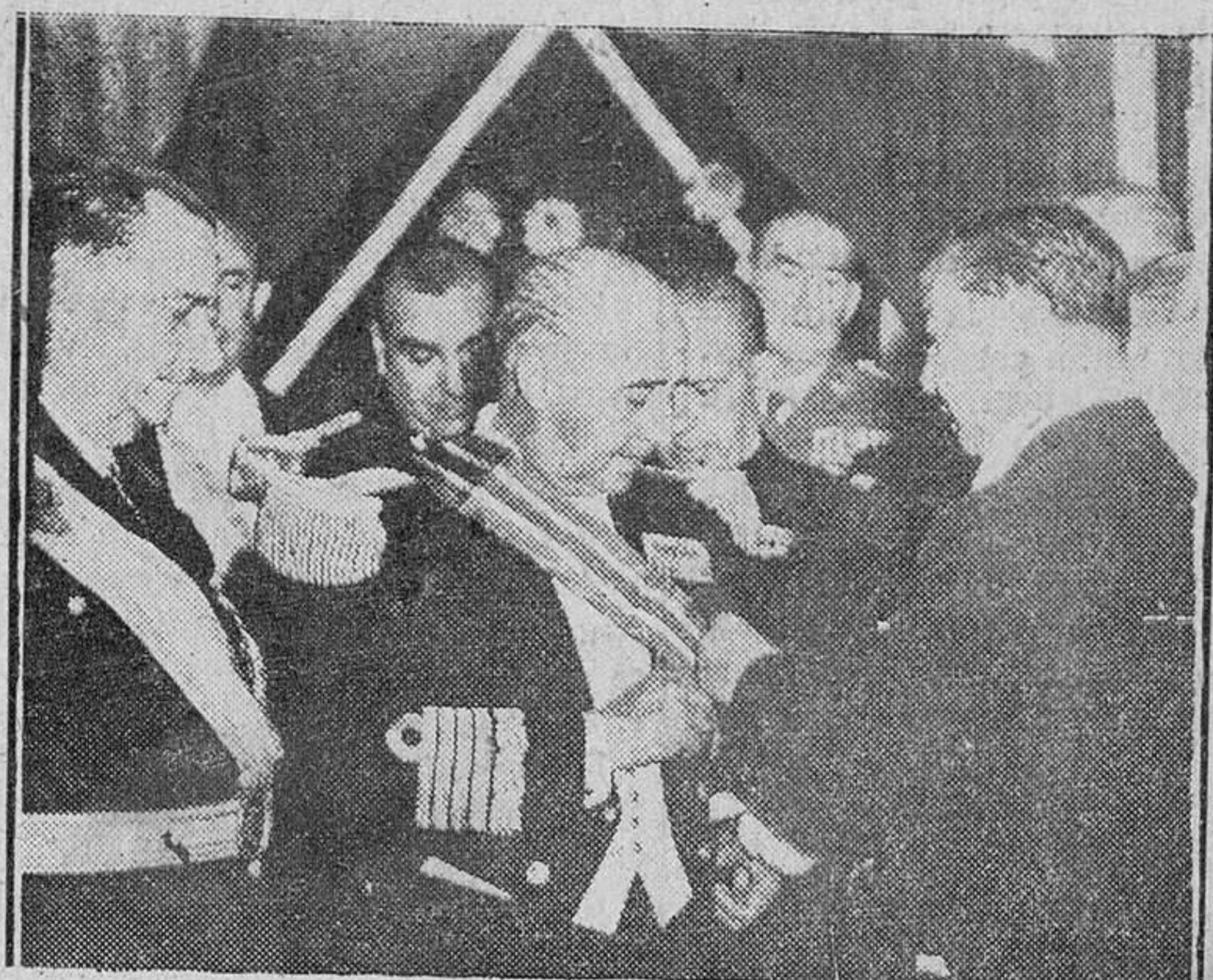
CONDECORACION FILIPINA AL CA UDILLO.—El presidente Quirino impuso, durante su estancia en Madrid, la Gran Cruz de Comandante en Jefe de la Legión de Honor de Filipinas al Generalísimo Franco, en presencia del embajador filipino, ministros y altas personalidades.

El señor Ruiz Jiménez pronunció un discurso en el que expresó el agradecimiento que el Ministerio debe al alcalde por esa generosidad y esa tenacidad que ya le están grabando como uno de los mejores alcaldes y resaltó la importancia del papel que a los Ayuntamientos corresponde en la educación de los españoles. El Estado no puede abarcar todo y es necesaria una política de descentralización. Ya lo intuyó el maravilloso genio político de José Antonio Primo de Rivera. No puede haber una gran política nacional si no es una política de conjunto del Estado, corporaciones e Instituciones, y el día que podamos incorporar a ella al pueblo más ignorado, ese día estaremos de verdad en el camino de la grandeza. Por eso, yo pido la colaboración de todos los Ayuntamientos de España que han sido siempre pilares y cimientos de las más grandes obras. Añadió que entre los problemas de su cargo estaba en primer lugar el de los maestros, que tanto han hecho y seguirán haciendo por la grandeza de España. Terminó impetrando de la Patrona del Colegio, la Virgen de la Paloma su bendición para que el nuevo centro sea mansión de paz y remanso del espíritu.—Cifra.