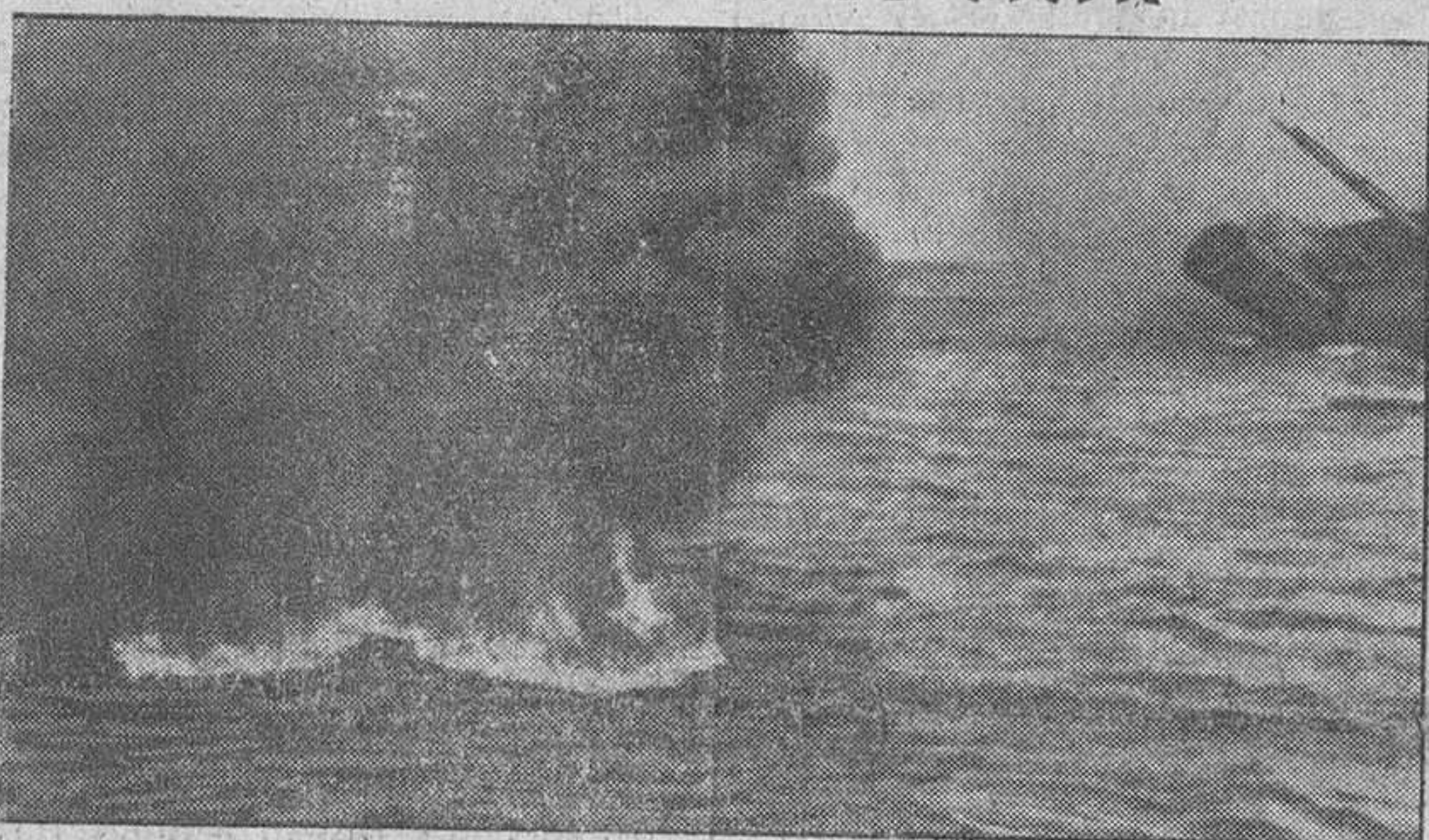
El torpedo ha hecho blanco en un petrolero que se hunde, mientras la esencia que conducía arde sobre las aguas