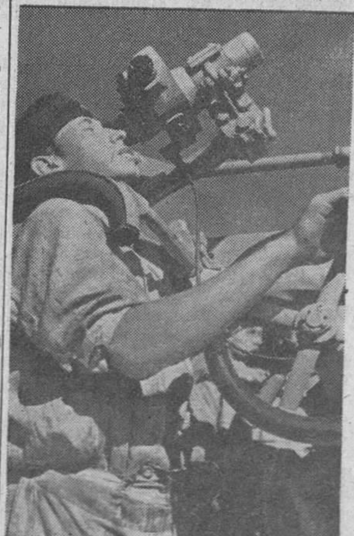
El servidor de un antiaéreo de una lancha rápida alemana fija la posición de tiro