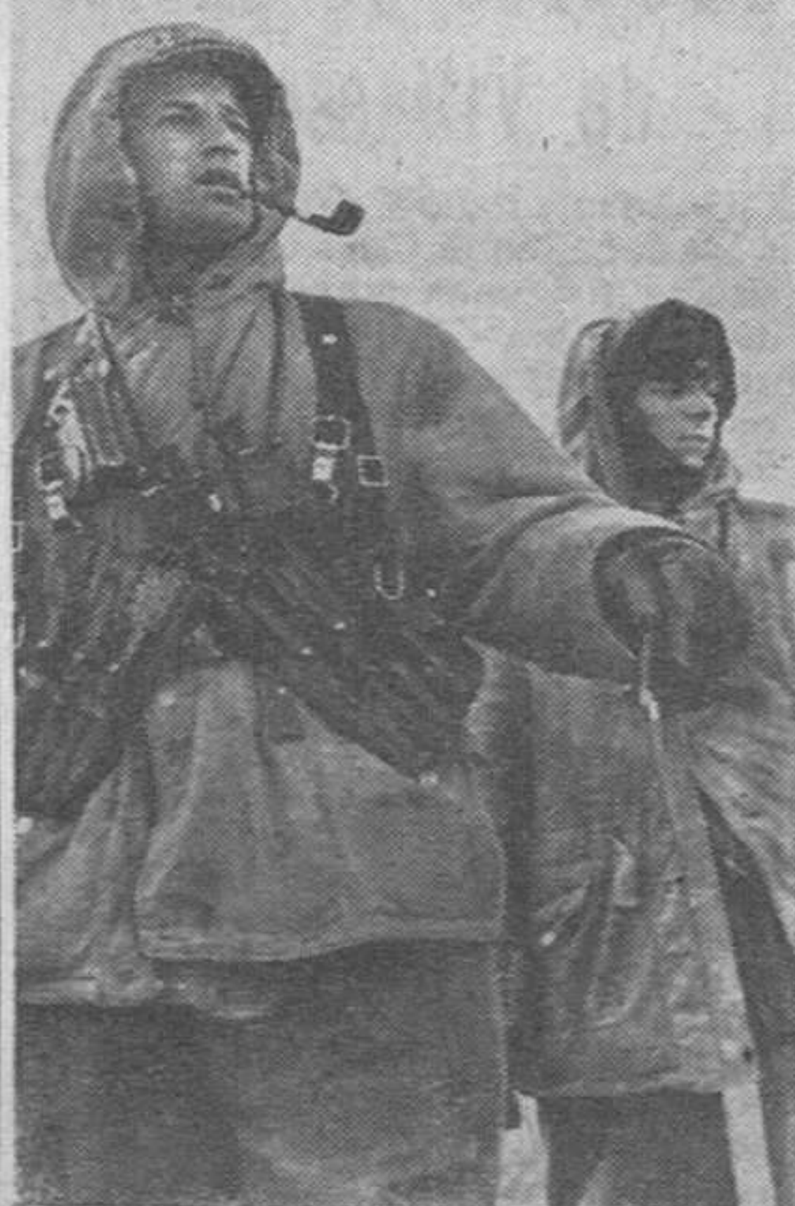
Soldados alemanos pertenecientes a un grupo encargado de aniquilar a los rojos rezagados en las batallas

Se cree que Roosevelt espera el resultado de las negociaciones colectivas que hoy se reanudarán entre los representantes patronales y obreros en Washington. Se recuerda que el presidente declaró al parar los primeros trabajadores antes de que se acordase la tregua: «El carbón saldrá de las minas y no importa lo que piense cada uno».—Efe.