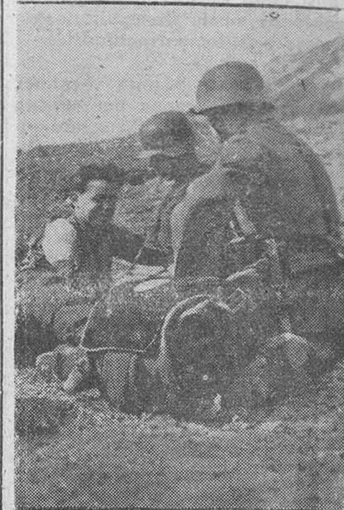
Soldado alemán herido recibe los primeros auxilios en plena línea de fuego