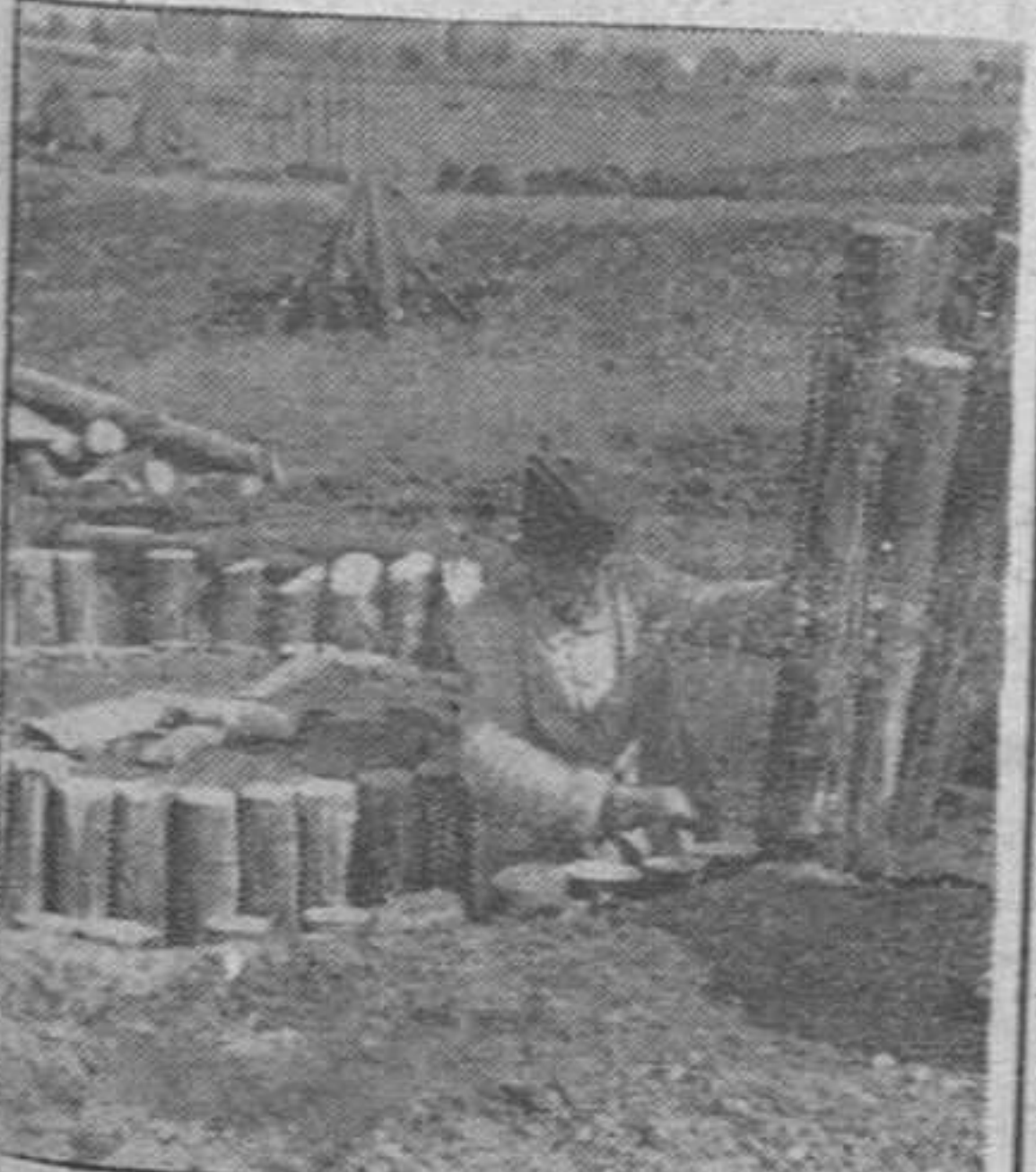
Joven alemán del servicio de trabajo construyendo un fortín para un puesto de ametralladora

Se afirma que no han llegado a un acuerdo Giraud y De Gaulle