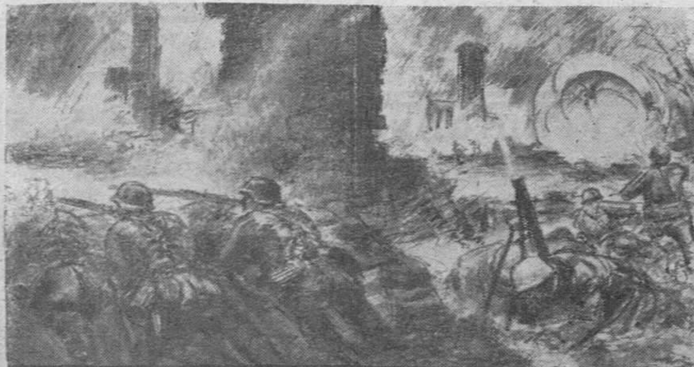
Grupo de las S. S. alemanas en un momento de la lucha, según un dibujo de un corresponsal de guerra