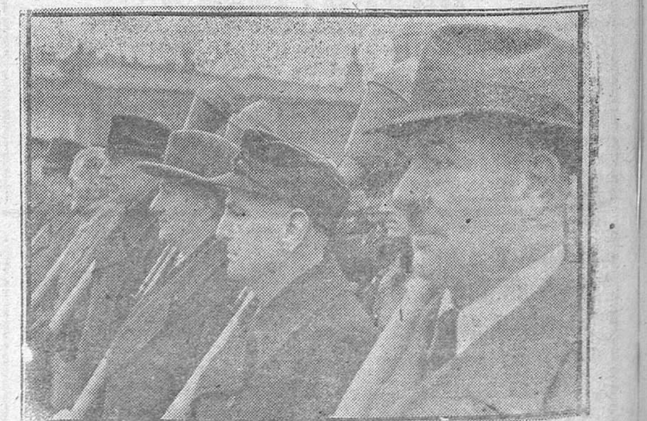
Con las farmas antitanque sobre el hombro los hombres de la nueva Milicia Nacional Alemana esperan el momento solemne del juramento