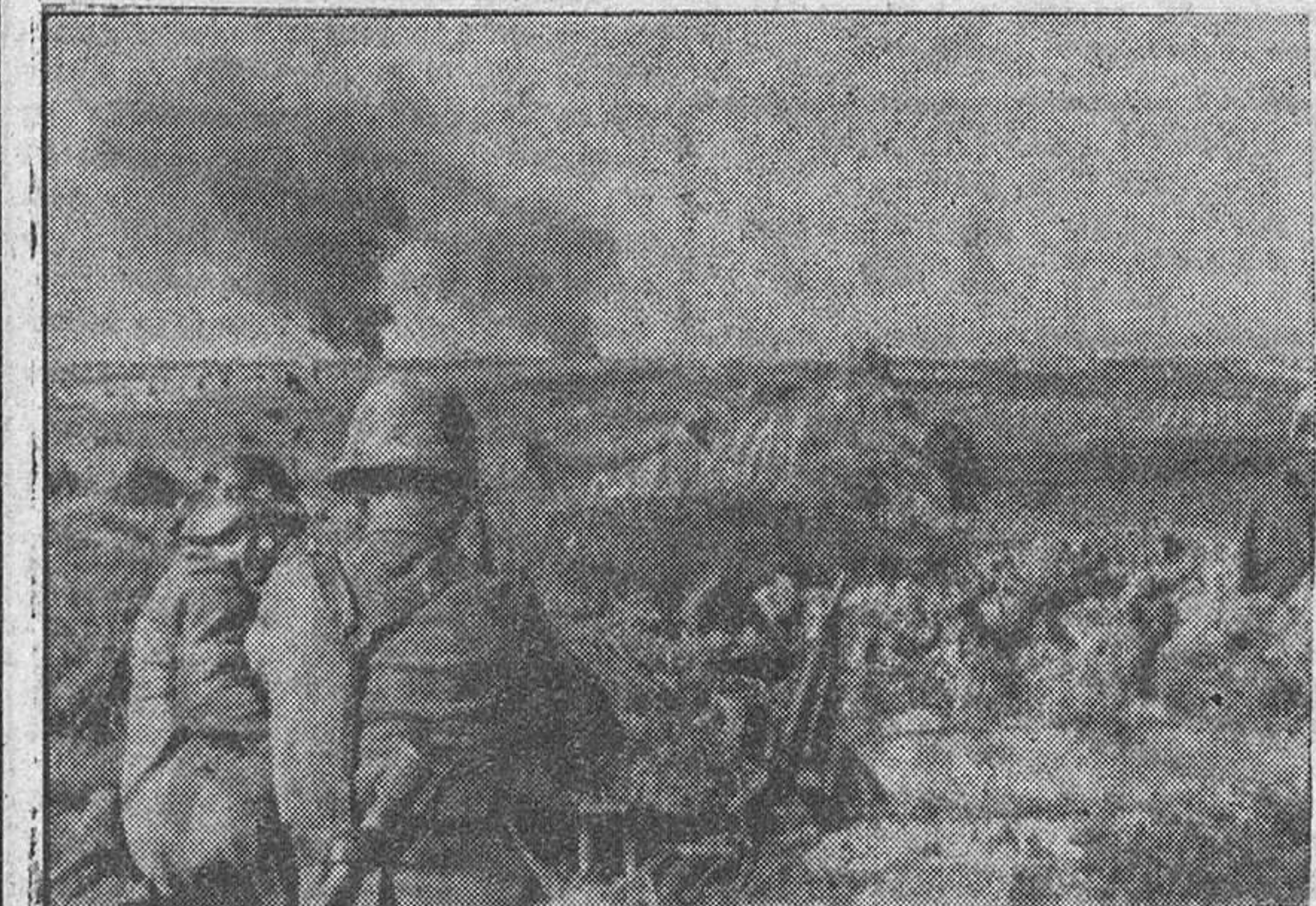
Granaderos alemanes observan desde sus posiciones improvisadas el efecto de los disparos de la artillería propia sobre las líneas enemigas, mientras llega la orden de contraataca.