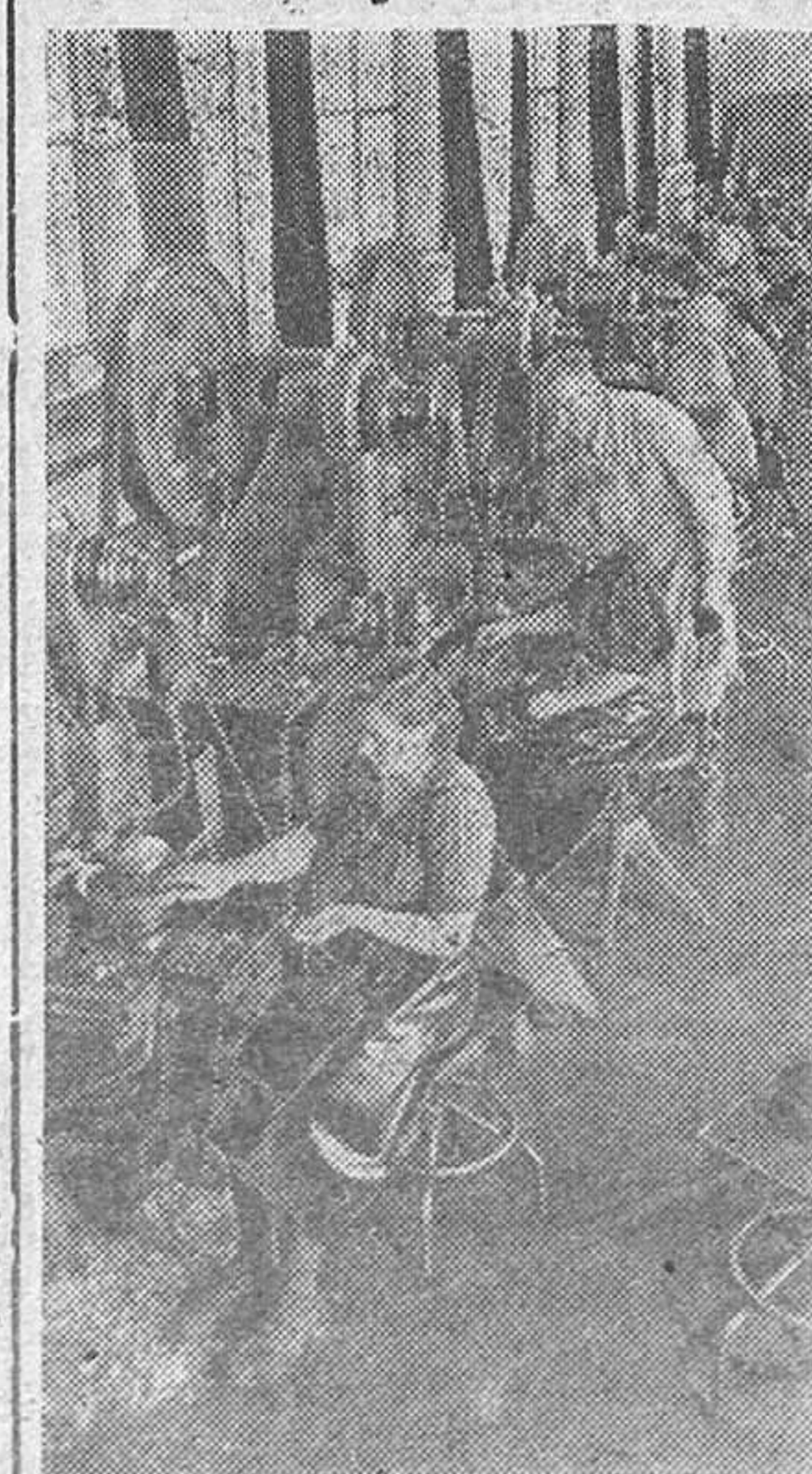
Mujeres alemanas aportan su trabajo al esfuerzo bélico del Reich. Una nueva operaria recibe instrucciones del jefe de grupo