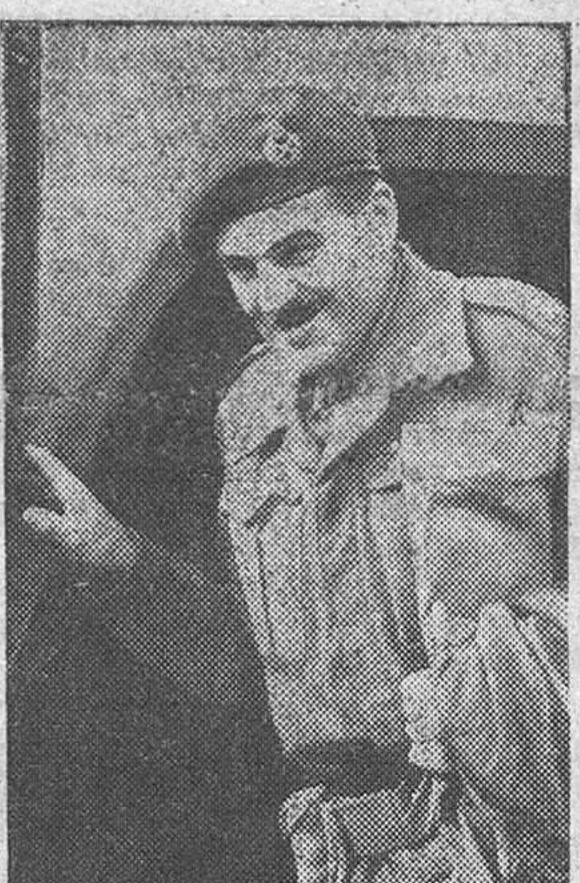
El general Urquhart, jefe de la División aerotransportada británica que aterrizó en Holanda.